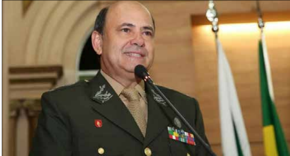
General Luiz Felipe Carbonell comandou o Regimento de São Miguel do Oeste entre outras unidades militares