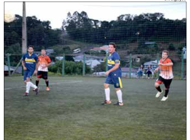
A quarta rodada aconteceu normalmente na sexta e sábado da semana passada