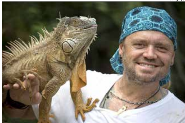
O biólogo Richard Rasmussen tem uma forma espontânea e irreverente de cuidar e se relacionar com os bichos

apresentador, economista, biólogo e naturalista. Profundo conhecedor do meio ambiente e do comportamento animal, tem uma forma espontânea e irreverente de cuidar e se relacionar com os bichos. Richard ganhou destaque e visibilidade quando começou a apresentar o quadro "Selvagem ao Extremo", na Rede Record de Televisão.