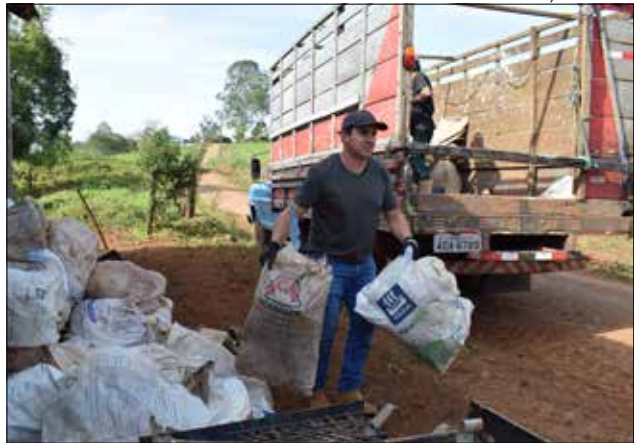
A orientação é que os moradores acondicionem os materiais em sacas e deixem na margem da estrada geral