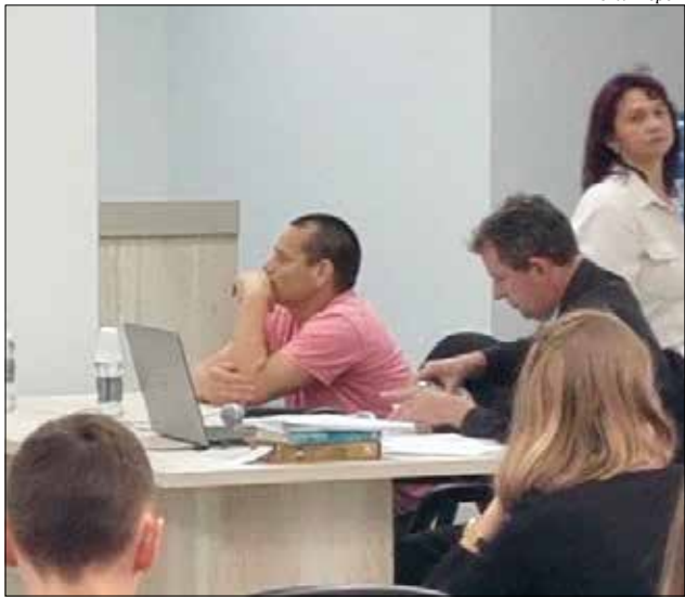
Júri foi realizado na manhã de segunda-feira