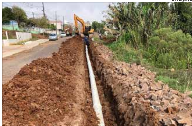
A adutora de 250 milímetros de diâmetro vem sendo implantada no município desde o ano passado

A Casan está investindo R$ 2.347.204,91 em recursos próprios na obra, que vai melhorar todo o sistema de abastecimento de São Miguel quando estiver em operação plena, no final de julho ou início de agosto. Até lá, a Companhia terá de realizar uma série de testes, sempre com interrupções no abastecimento. "Os testes servem para interligar as bombas de maior potên-