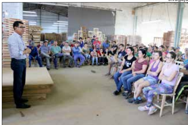
Prefeito esteve em uma das indústrias do município para divulgar o serviço diferenciado

Cada terça-feira terá um dentista na unidade