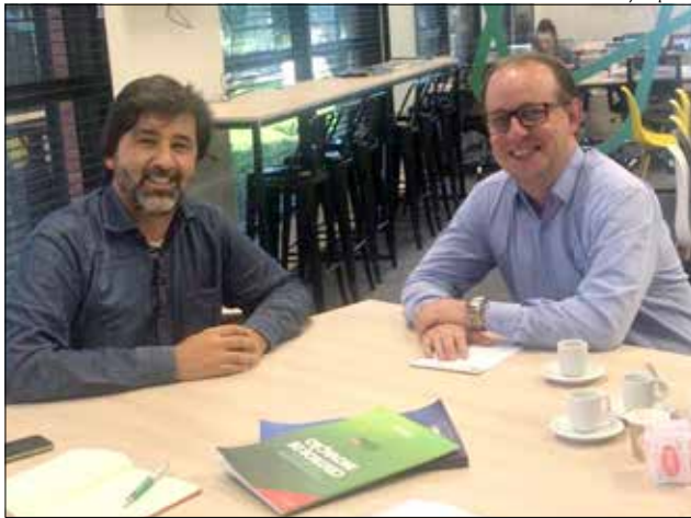
Vice-prefeito manteve audiência em Florianópolis para tratar sobre o assunto