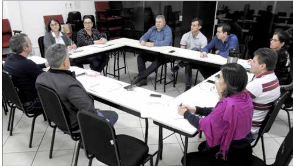
Reunião na semana passada tratou sobre a comercialização dos estandes