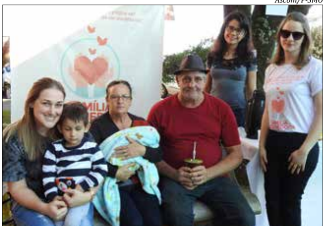
Hoje o município conta com duas famílias acolhedoras aptas

Carline explica que os acolhimentos citados foram efetivados, inicialmente, através de convênios com municípios vizinhos. Após a inscrição, avaliação e capacitação, hoje o município conta com duas famílias acolhedoras aptas. No último domingo, 09, a equipe que atua junto ao Serviço esteve na praça Walnir Botaro Daniel, divulgando o trabalho e sensibilizando famílias para o acolhimento.