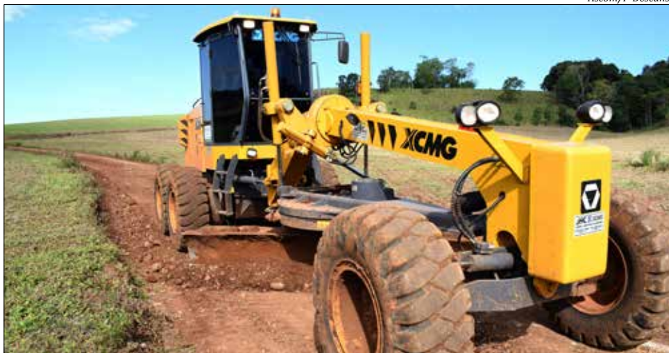
Manutenção em estradas e ações nas propriedades foram retomados com a melhora do tempo