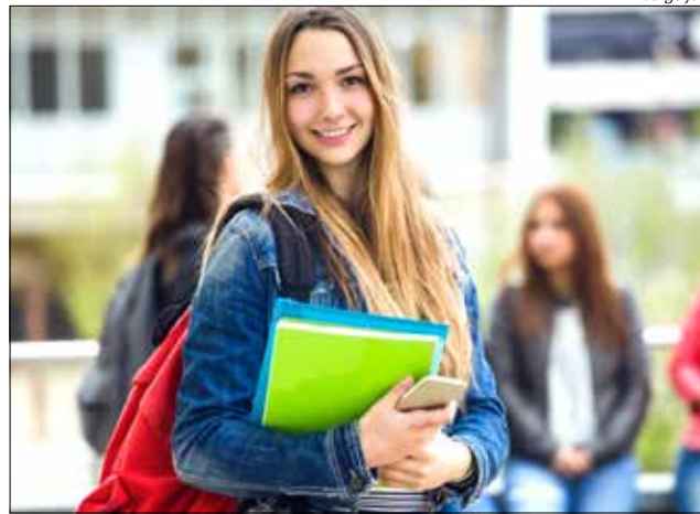
No Campus de São Miguel do Oeste há vagas para Direito

Podem concorrer às bolsas integrais candida-