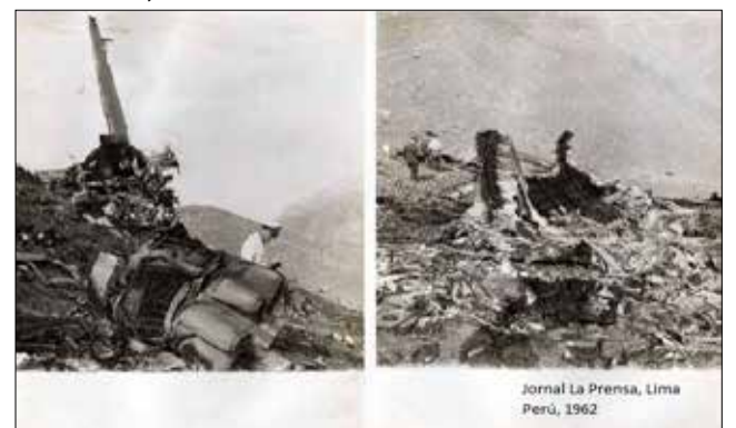
Avião que caiu no Peru em 1962 e que carregava geladeiras recheadas de armas

Editor do jornal online The Intercept Brasil, divulgou mensagens trocadas no aplicativo Telegram com o intuito fictício de soltar Lula, mas real de se vingar de Moro e Dallagnol. O primeiro petardo disparado domingo (9/6), à noite, alcançou seus objetivos, criando um grande rebuliço na caverna de Ali Babá em que se transformaram as cumbrucas do Congresso Nacional, a virada para cima para receberem propinas e a emborcada para se esconderem da polícia. Mas ele mesmo não se fez de rogado e assegurou ao Uol que há ainda muito mais a revelar.