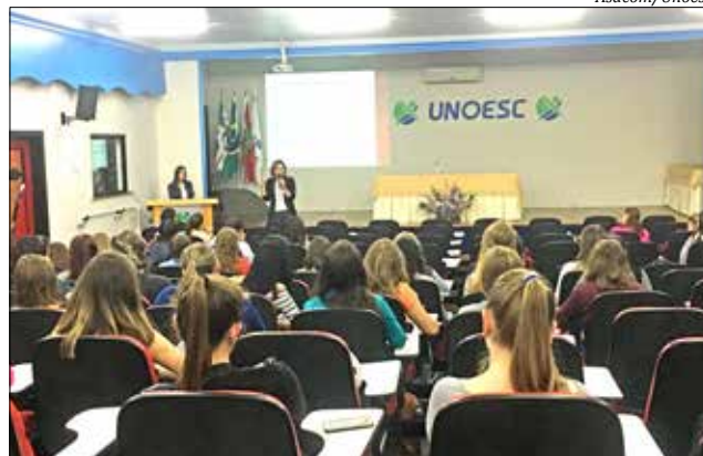
Ciclo de Debates reuniu acadêmicos de Pedagogia no auditório da Unoesc

Já no dia 21 de outubro, o curso de Pedag-