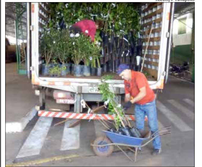
Mudas chegaram ao município segunda-feira

As mudas recebidas são provenientes do Viveiro Dal Molin, de Ijuí (RS), certificadas pela Cidasc de Palmitos. A maior parte das mudas é utilizada pelos moradores para renovação dos pomares mais antigos. O cultivo de árvores frutíferas consiste, em sua maioria, na produção de frutas para consumo das próprias famílias.