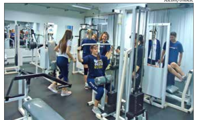
Alunos desenvolveram exercícios na Sala de Musculação

Para a professora de Educação Física do Colé-