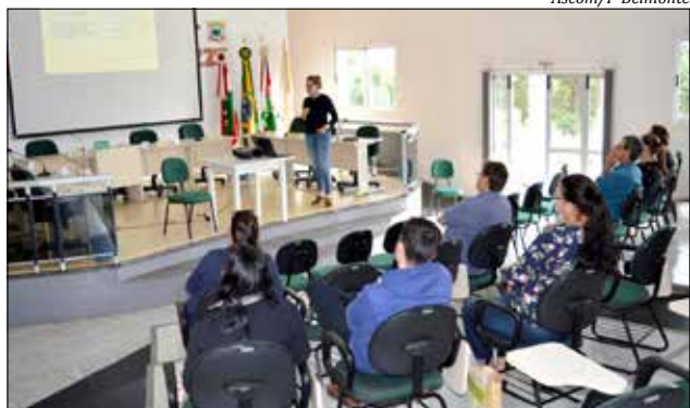
Audiência pública foi realizada na tarde de ontem