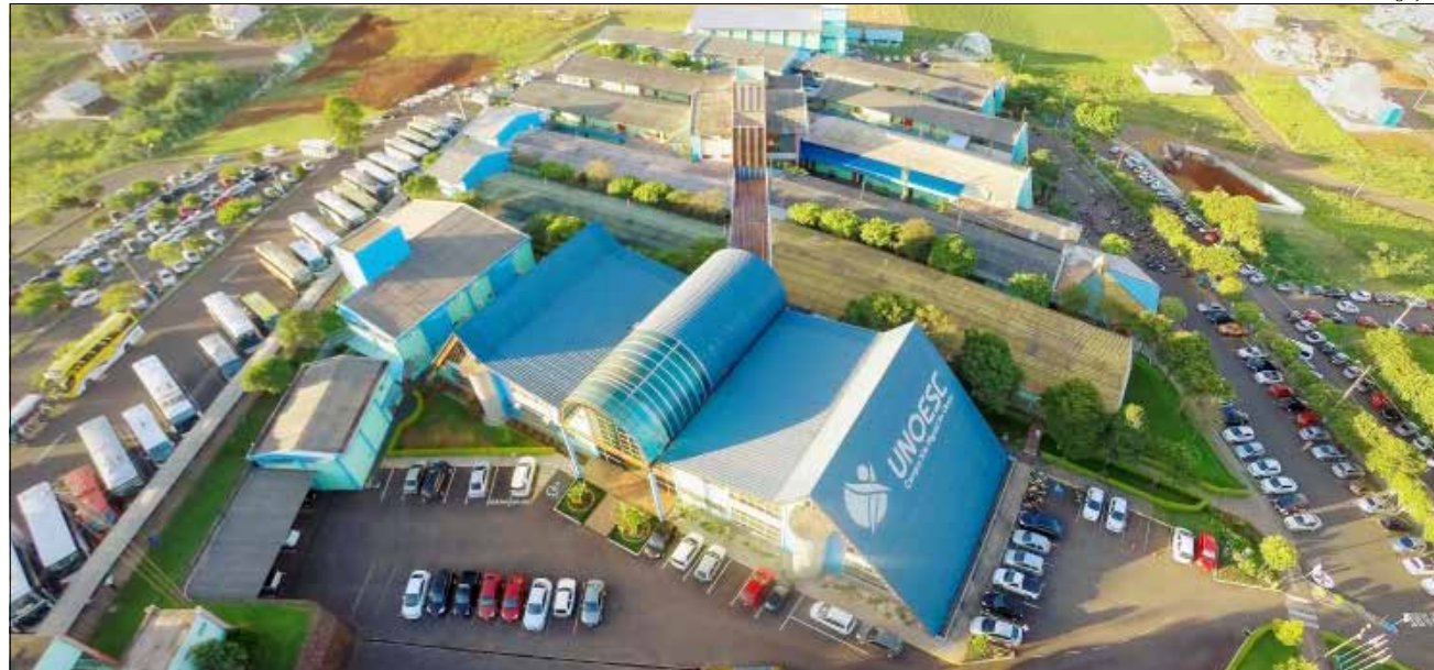
Curso de Direito Unoesc foi o que mais aprovou na prova da OAB no Oeste do estado