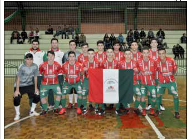
O sub-16 e sub-18 permanecem na liderança com 100% de aproveitamento