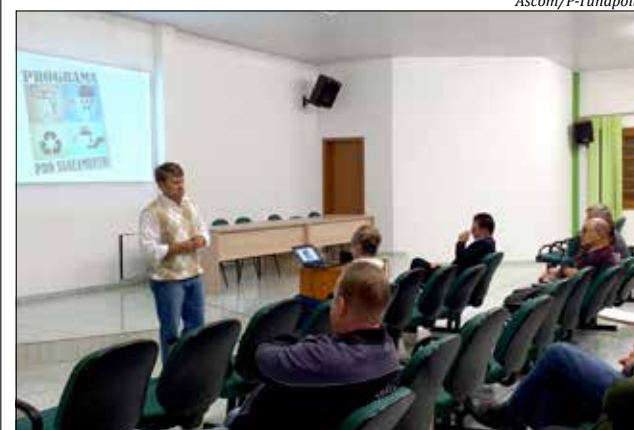
Programa foi lançado pela prefeitura na semana passada