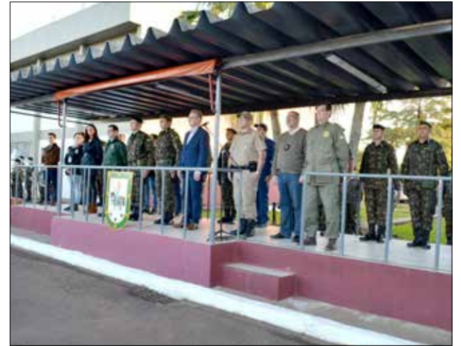
Solenidade no 14º RCMec marcou o final da operação de repressão aos crimes transfronteiriços

Sábado, 25, 60 mil dólares em espécie foram