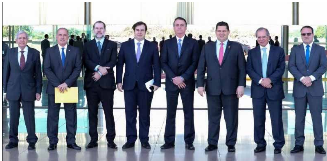
Pacto uniu as lideranças dos três poderes da República

Depois dos protestos pró-governo no domingo, 26, o presidente conseguiu mostrar força, não na dimensão desejada por sua equipe, mas suficiente para evitar um isolamento diante dos movimentos no Congresso para assumir o protagonismo da agenda econômica. Nesta linha, ato contínuo às manifestações, ele abraçou a proposta de pacto para “zerar o jogo” e acertar um entendimento entre os três poderes em nome de um Brasil desenvolvimentista nos moldes dos anos 70 do século passado, respeitadas as proporções da época.