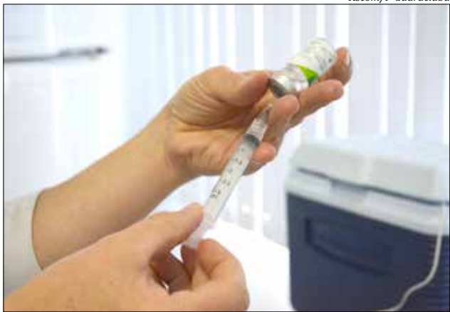
Mais de três mil pessoas já haviam recebido a vacina até sexta-feira