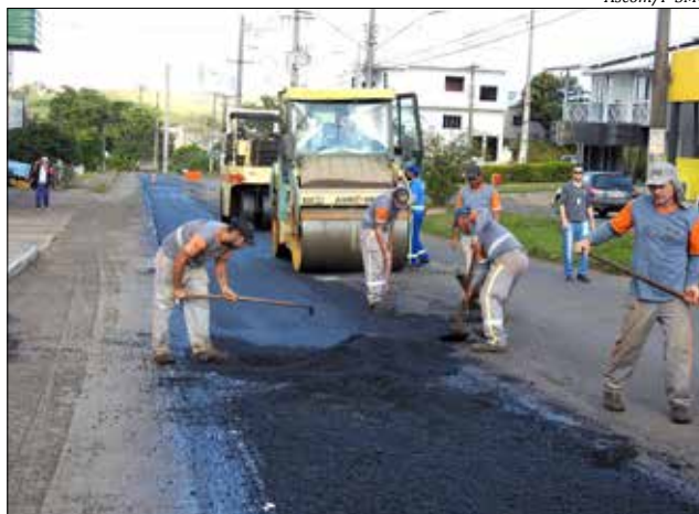
Obras estão sendo desenvolvidas na Willy Barth e várias outras ruas centrais