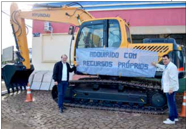
Máquina foi adquirida com recursos próprios do município