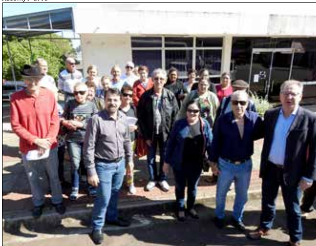
Pacientes foram embarcados para o vizinho município de Iporã do Oeste