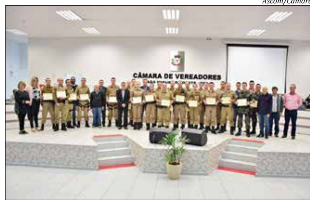
Militares foram homenageados na sessão de quinta-feira

O vereador cita ainda que a Polícia Militar contou com apoio da comunidade, recebendo informações que auxiliaram na localização do suspeito. Barp destaca que os po-