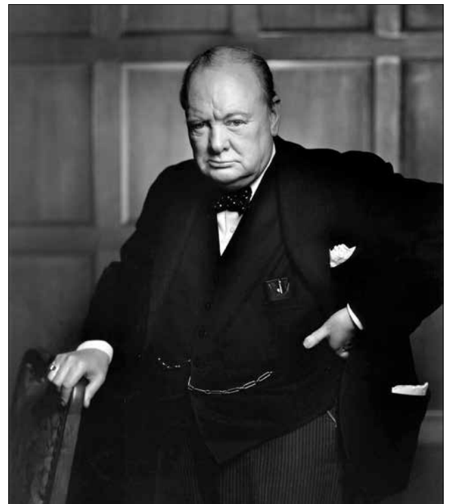
Winston Churchill, EM 1941

Salvo melhor juízo, as manifestações pró-Bolsonaro serão contra o propinoduto, barganha costumeira no Congresso Nacional, quando da votação que pode resultar numa Nação mais justa e próspera.