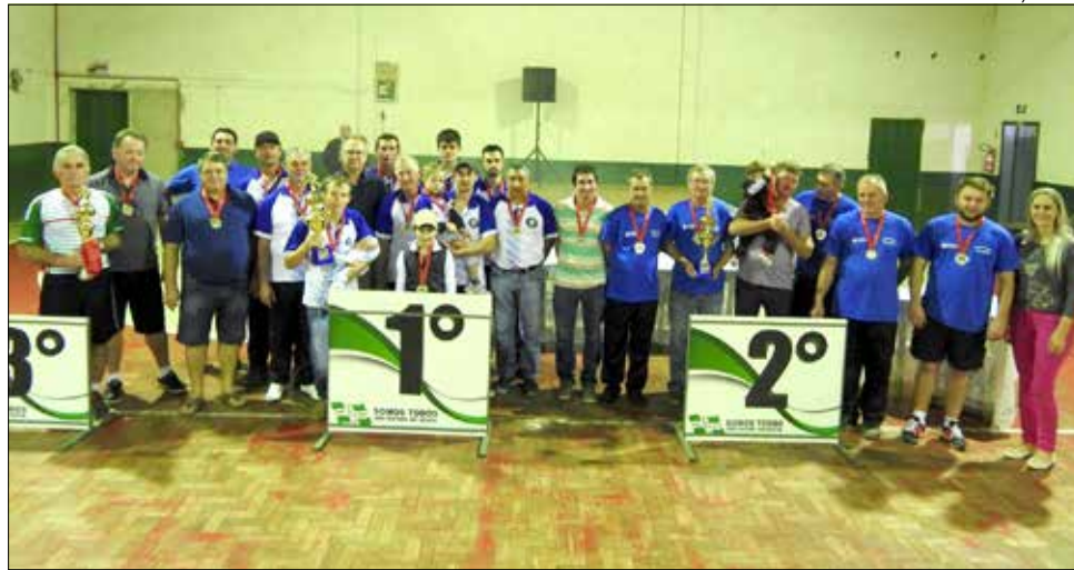
Equipes confraternizaram em solenidade realizada sábado

No feminino, a equipe do Bom Sucesso, do Bairro Salete, sagrou-se campeã, ficando em 2º lugar a CTG Porteira Aberta e em terceiro o Bairro São Jorge. No