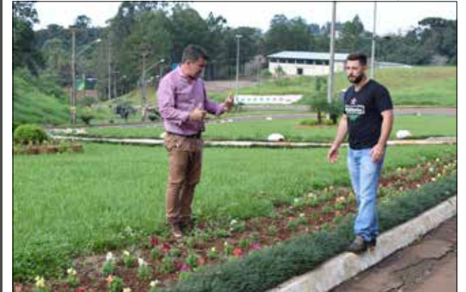
Com variações de cores, para esta época foram plantadas boca-de-leão, petúnia, amor-perfeito e cravina