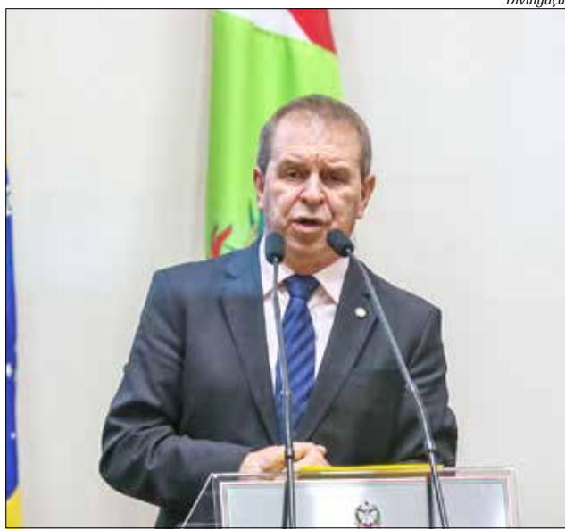
Deputado estadual Maurício Eskudark

O parlamentar citou ainda que estes trechos são importantes para a economia do Estado e principalmente na preservação e qualidade de vida dos cidadãos. "Além da importância para a logística e escoamento da produção, o bem-estar do catarinense e uma maior segurança aos que trafegam são desejos da população", conclui Eskudark.