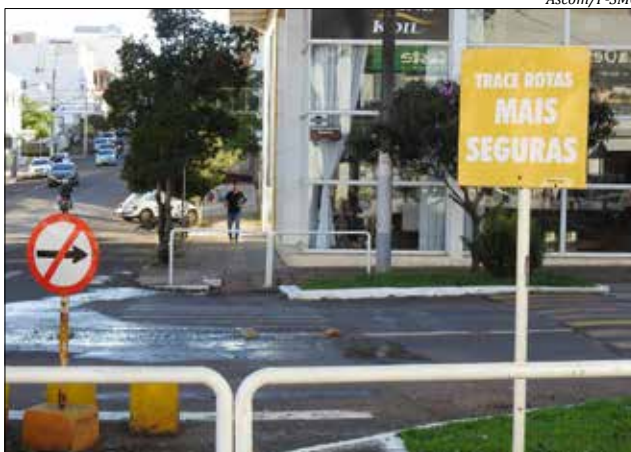
Placas indicativas conscientizam motoristas