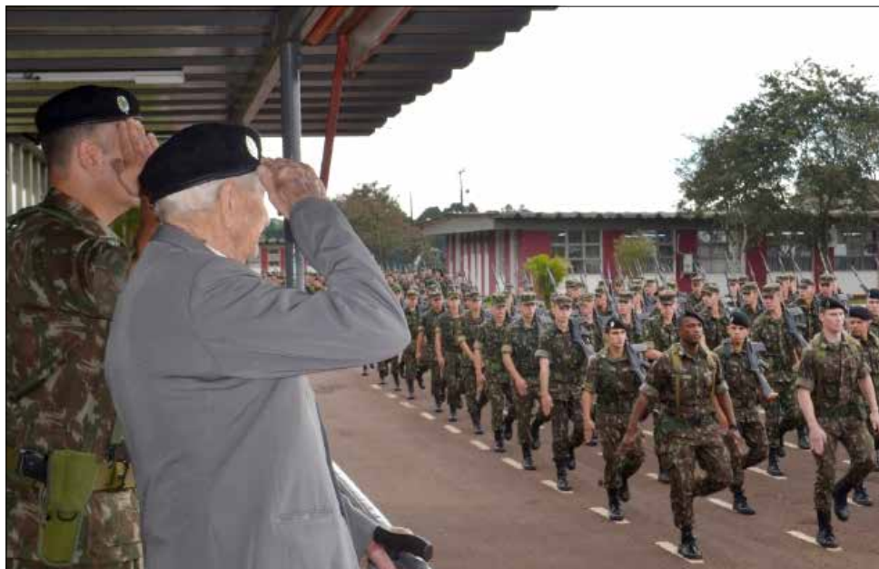
A tropa desfilou em continência ao Comandante e em Homenagem aos veteranos da 2ª Guerra

O comandante do Regimento, em seu pronunciamento, lembrou dos feitos dos personagens brasileiros que estiveram nas batalhas em solo italiano. “Nós sabemos que a guerra não é uma coisa bonita, mas é um sacrifício que tivemos que fazer.