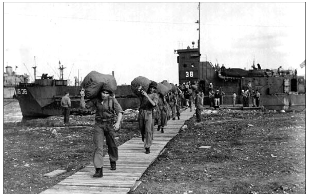
Unidades brasileiras desembarcaram em Nápoles, na Itália

Em setembro de 1945 chegava ao fim a Segunda Guerra Mundial. Estados Unidos e os aliados saíam vencedores no conflito que matou cerca de 60 milhões de pessoas, entre civis e militares. Na volta ao Brasil, os expedicionários foram recepcionados calorosamente pela população brasileira e pelas famílias que aguardavam ansiosas por notícias.