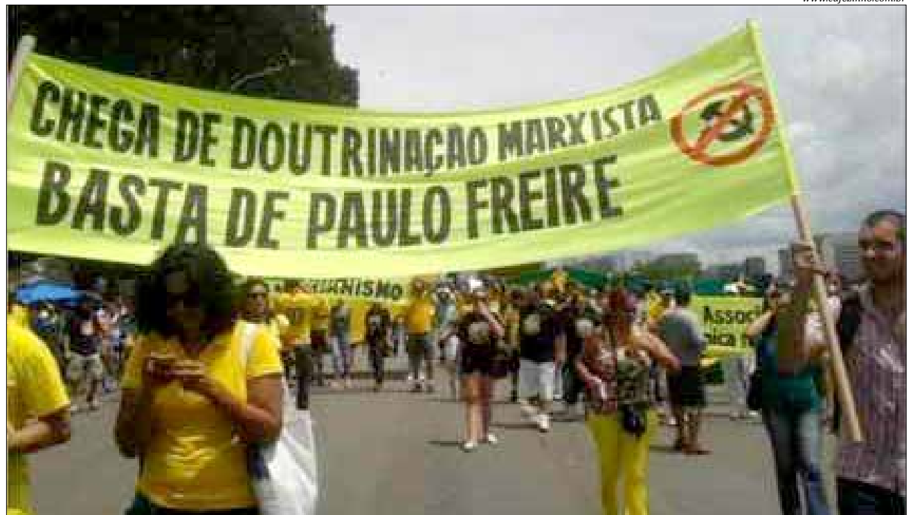
Proibir professores de abordar temas políticos em sala de aula é inconstitucional, mas já faz primeiras vítimas

São anos e anos de pedagogia pirata cabeça adentro da garotada: os esquerdopatas são heróis da moderna revolução, o Plano Real corresponde ao neoliberalismo que oprimiu os pobres, Lula matou a fome do povo porque já passou por isso na vida, os sindicatos parasitários são a salvação do trabalhador, o capitalismo é mau, a Europa é perversa e a África é boazinha, privatizar é roubar a população e quem realmente roubou a população aparece lindo na fotografia da resistência democrática contra a ditadura militar... Por aí vai.