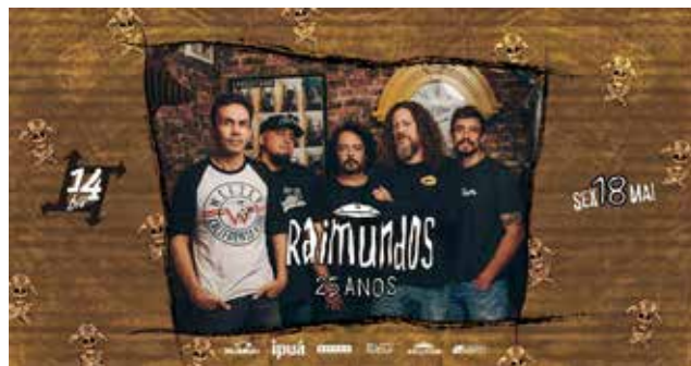
Neste dia 18 de maio, sábado, tem show com a banda Raimundos/Tour 25 anos, em Chapecó

Informações sobre ingressos, mesas, camarotes e outros assuntos: (49) 9 9202 0014 (WhatsApp).