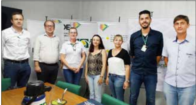
Encontro foi realizado quinta-feira