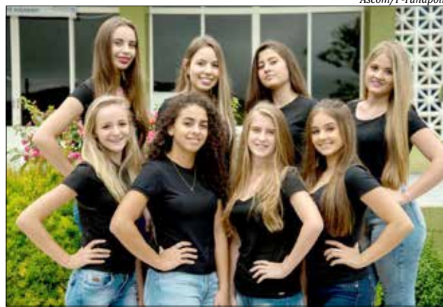
O baile de escolha das soberanas será no dia 25 de abril

As três eleitas já terão compromissos no dia 26, aniversário do município, e no dia 27, onde serão prestadas homenagens