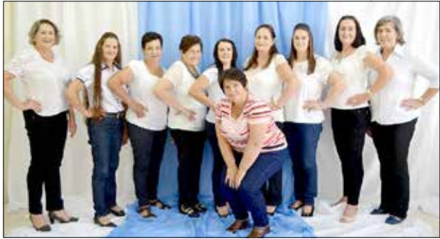
As nove candidatas vão concorrer aos títulos no dia 1º de maio