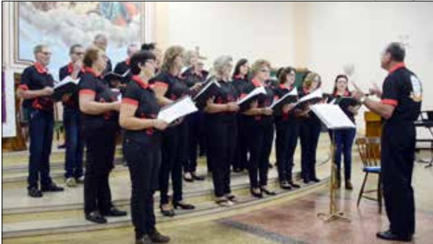
Associação Coral Santa Cecília foi a anfitriã do encontro