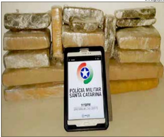
Droga estava na mochila do rapaz