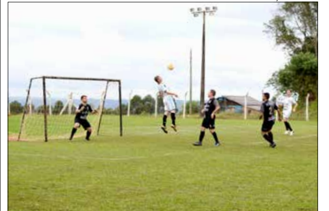
Campinas sediou a última rodada da primeira fase