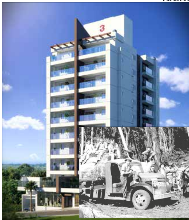
Edifício levou o nome Madero em homenagem ao ciclo da madeira, que desenvolveu a região pós colonização

"Um empreendimento que une tradição e tecnologia, oferecendo ao morador uma excelente oportunidade de