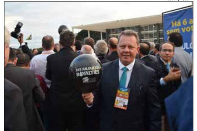
Prefeitos fizeram manifestação em frente ao STF pela demora no julgamento de liminar dos royalties do petróleo

O segundo dia terminou com uma manifestação dos prefeitos em frente ao Supremo Tribunal Federal (STF), numa simbólica comemoração pelo aniversário de seis anos em que o Tribunal não julga a liminar que redistribuiria os royalties do petróleo para todos os