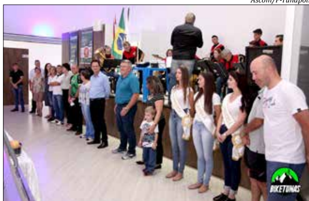
Programação foi lançada domingo, durante a realização do 2º Pedala Tunápolis

O ponto alto da programação será no dia 24, a partir das 19h, no Centro Esportivo Municipal, quando serão relembradas as conquistas esportivas com homenagem e