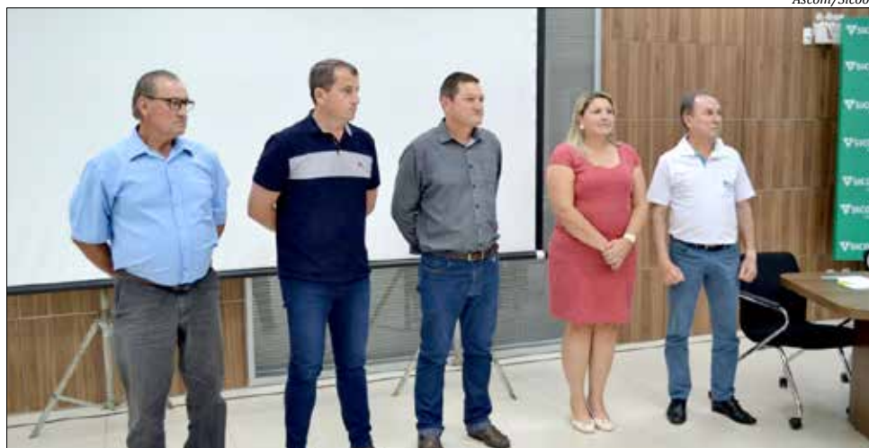
Durante a assembleia, foi eleito o novo conselho fiscal

Durante a assembleia, também foi realizada a eleição do novo Conselho Fiscal. Os delegados, que representam o quadro social da cooperativa, aprovaram a prestação de contas e mudanças estatutárias. Dentre os itens aprovados, a distribuição de sobras, que somarão mais de R$ 5 milhões depositados na conta corrente dos associados a partir do dia 1º de abril.