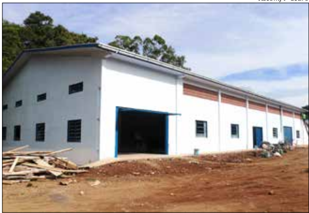
Obras de reforma e ampliação estão em estágio final