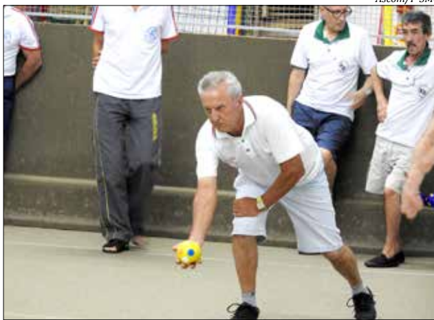
Mais de 250 atletas que participaram das modalidades de bocha, bolão, canastrão, dominó, truco e bolãozinho

Conforme o secretário Juliano Siebel, foram momentos de integração e de confraternização entre as pessoas da terceira idade de São Miguel do Oeste e também como preparação para a 2ª edição das Olimpíadas da Terceira Idade da Ameosc, que acontecem em agosto, no município de Itapiranga, com a participação dos vencedores de cada modalidade.