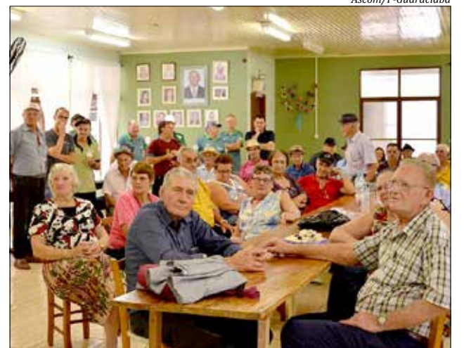
Os jogos aconteceram durante o dia de sexta-feira

No final da tarde da sexta-feira, autoridades municipais estiveram no Centro de Convivência para entregar a premiação aos três primeiros colocados de cada Categoria. O prefeito Roque Luiz Meneghini parabenizou os participantes e ressaltou a importância na participação. "Esse foi um dia diferente, de competição, mas também de se divertir, fazer novos amigos e isso é o que importa" mencionou.