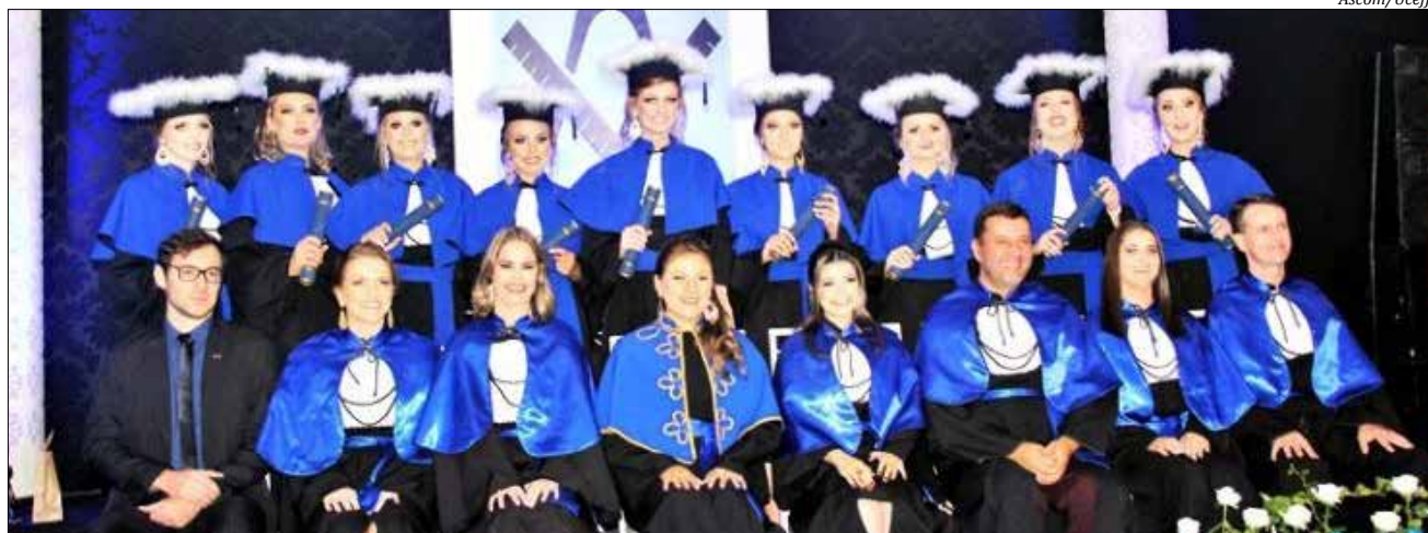
Cerimônia de formatura aconteceu no Clube Imigrantes