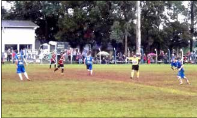
Jogo de ida aconteceu no Estádio Lauro Rauber, em Iporã do Oeste

Enquanto isso, em uma partida com muita chuva e campo encharcado, o Cometa de Itapiranga enfrentou o Inter de Santa Helena, também na tarde de domingo, 17. O jogo terminou com uma goleada de 4 X 0 pelo Cometa, com gols todos marcados no primeiro tempo. Agora, o Inter pre-