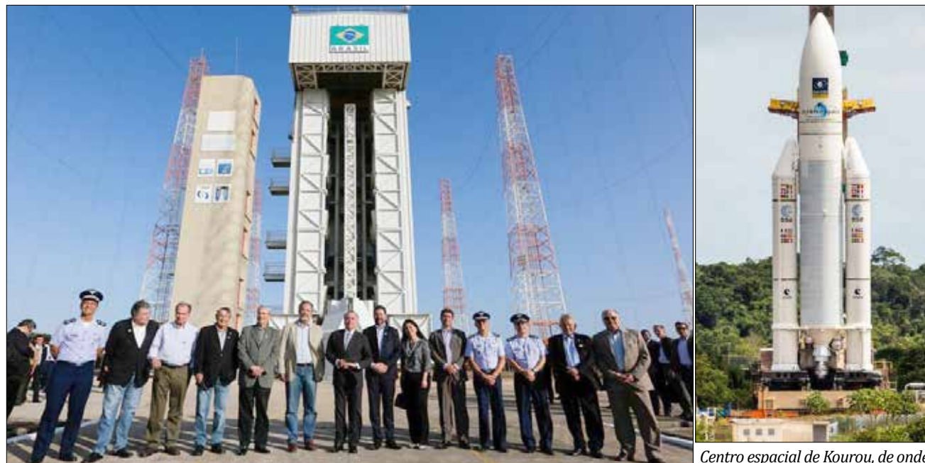
Base de Alcântara: pelo menos cinco empresas norte-americanas demonstraram interesse depois de uma visita à base

Também cedeu a base aeroespacial de Alcântara no Maranhão, nos moldes de Getúlio em meados do século passado, no qual o Brasil barganhou a CSN, a primeira siderúrgica do Brasil que alavancou a revolução industrial tardia, no Brasil. Além do forró "for all" que contagiou o Brasil como um todo. Também vale lembrar que a Guiana Francesa, fronteira com o setentrião brasileiro, cedeu espaço para os europeus lançarem os seus satélites. Lá o bolsa família é de mil euros.