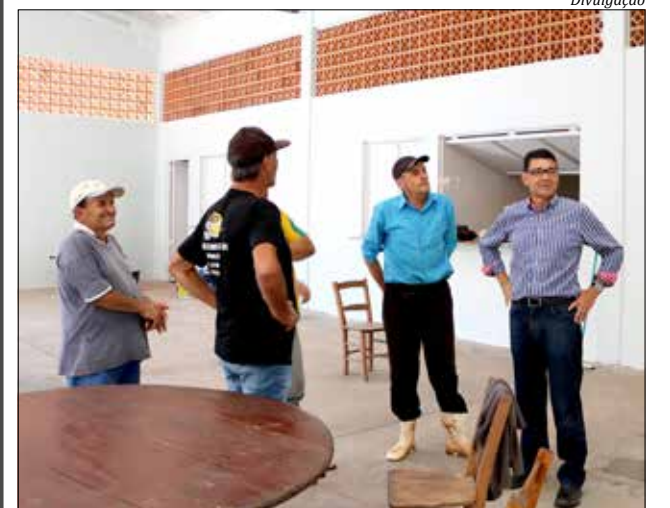
Pavilhão está sendo construído na Linha Jataí

Estão sendo investidos R$ 211 mil nessa segunda etapa da obra. Plínio destaca que o valor é oriundo de recursos próprios do município. Na primeira etapa foram investidos R$ 110 mil, recurso proveniente de emenda parlamentar do deputado Altair Silva.