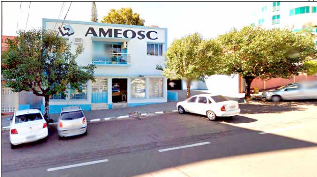
Sede está localizada na Rua Padre Aurélio Canzi, no centro da cidade