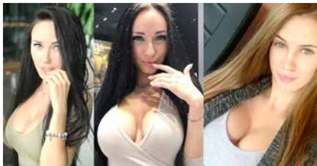
As belas mulheres russas

Mundo plural - As mulheres vítimas acabam passando aos filhos um modelo de submissão que não os ajuda a ser plenos na vida adulta. É preciso esquecer esse personagem feminino construído pela sociedade. Isso é liberador também para os homens. Existem muitos homens que apoiam o feminismo e que estão ao lado das mulheres em casa e no trabalho. E será com eles que nós construiremos um mundo plural. Com menos repressão, menos violência. A chave é a humanidade.