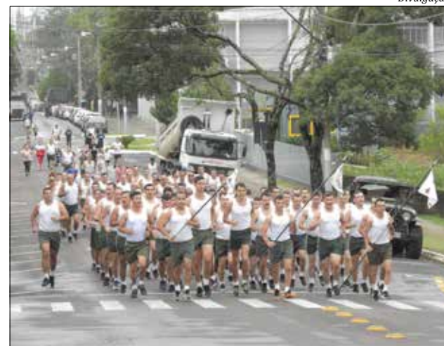
A corrida passou pelas principais ruas da cidade