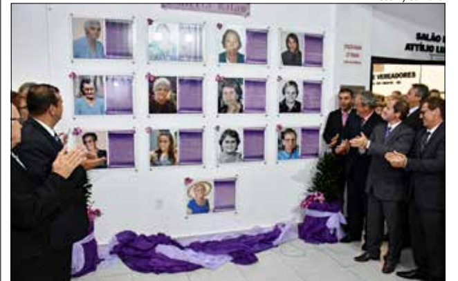
Galeria Lilás foi renovada para o ano de 2019