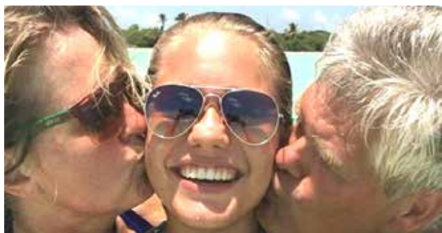
Lotte van der Zee entre os pais

Lotte Van Der Zee, a Miss Teen Universo, morreu aos 19 anos na Áustria. A informação foi divulgada nesta sexta-feira (8). A modelo holandesa sofreu um ataque cardíaco na quarta-feira (6) durante uma viagem com a família. Isso é lamentável!