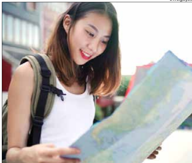
Inscrições podem ser feitas até o dia 12 de abril