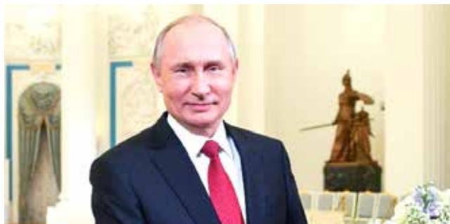
Putin: "mulher precisa de aparelho de ginástica, massagista e pretendente" - Eu concordo com o Vladimir.