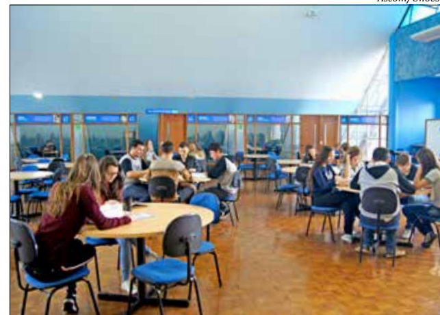
Além do acervo físico, alunos poderão agora acessar os livros virtualmente