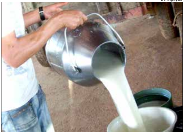
Dentre os resultados que vêm sendo apresentados destaca-se o aumento na eficiência produtiva, qualitativa e reprodutiva