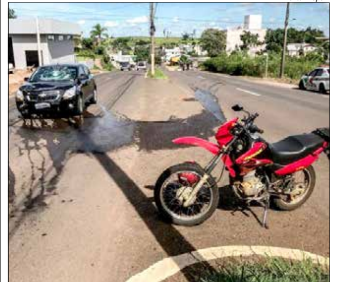
Acidente aconteceu no centro da cidade no dia 27 de fevereiro