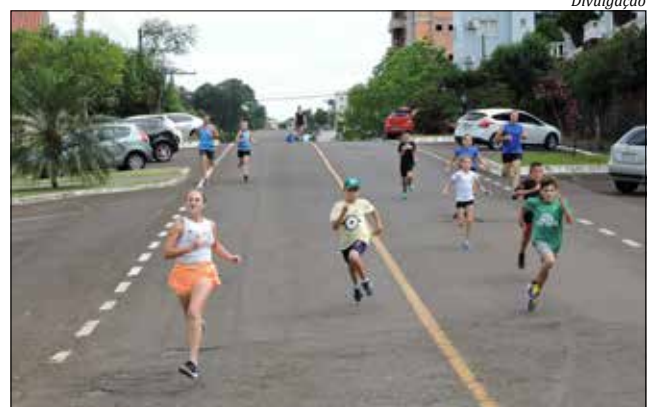
Evento reúne centenas de atletas todos os anos anos, 12 a 14 anos, 15 a 19 e mais de 60 anos. A premiação será em medalhas do 1º ao 5º lugar de cada categoria e troféus do 1º ao 5º lugar geral.

te. As inscrições podem ser efetuadas até o dia 15 de março. Para os atletas que irão participar de todas as etapas do Circuito neste ano, o valor será de R$ 30,00 para adultos e R$ 15,00 para o infantil. Já para os atletas que optarem apenas pela prova em São Miguel do Oeste, a inscrição é gratuita. Não serão aceitas inscrições no dia da prova, com exceção da categoria kids. Juliano destaca que serão 13 categorias nos naipes masculino e feminino, 06 a 08 anos, 09 a 11