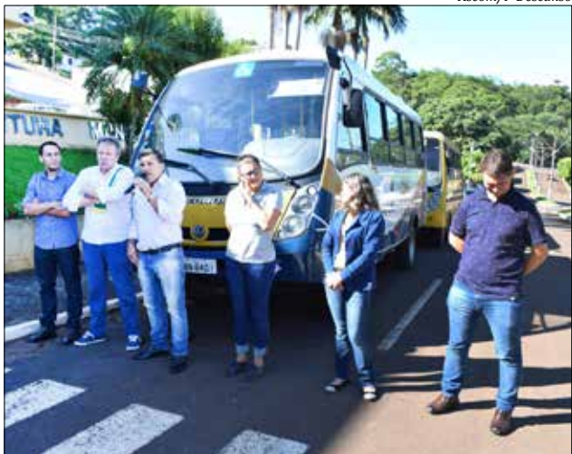
Entrega do micro-ônibus reuniu autoridades, alunos e professores