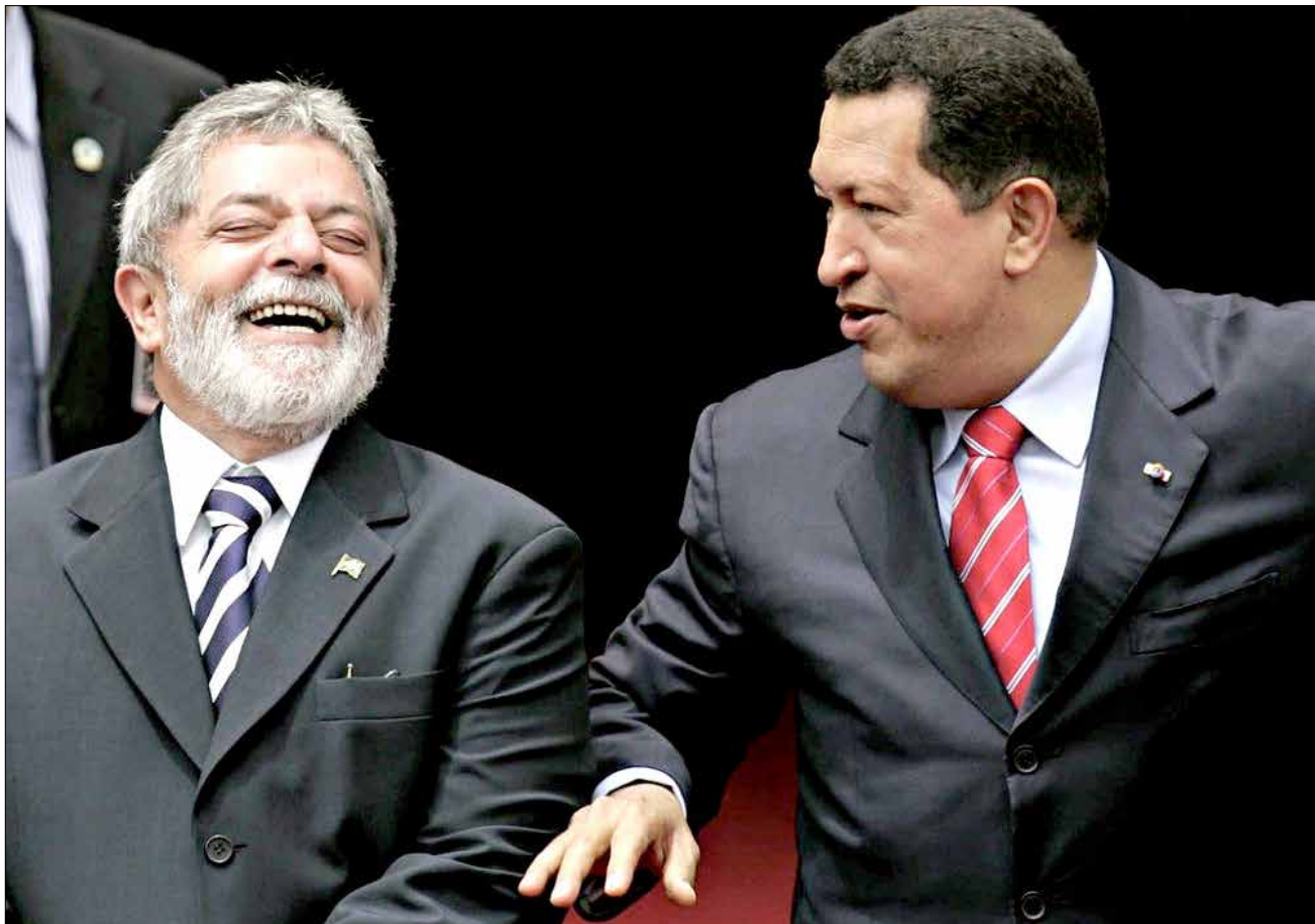
Os então presidentes Luiz Inácio Lula da Silva e Hugo Chávez

Em abril de 2006, numa discursão em Curitiba, Hugo Chávez pediu à plateia que reelegesse o presidente Lula, qualificado pelo companheiro venezuelano de “herói do Brasil”. A retribuição veio em novembro do mesmo ano: num comício em Ciudad Guayana, na Venezuela, Lula recomendou aos espectadores que mantivessem Chávez no poder. Entusiasmado com o som da própria voz, o futuro presidiário incluiu no berreiro uma saudação a Daniel Ortega, que acabara de vencer a disputa pela Presidência da Nicarágua.