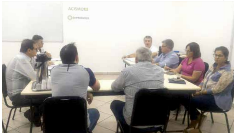
Data foi definida durante reunião da CCO e administração municipal

“Iremos manter a gratuidade do ingresso no Parque Rineu Gransotto e os shows serão terceirizados. Cada detalhe da organização da Faismo 2019 será pensado para ser atrativo