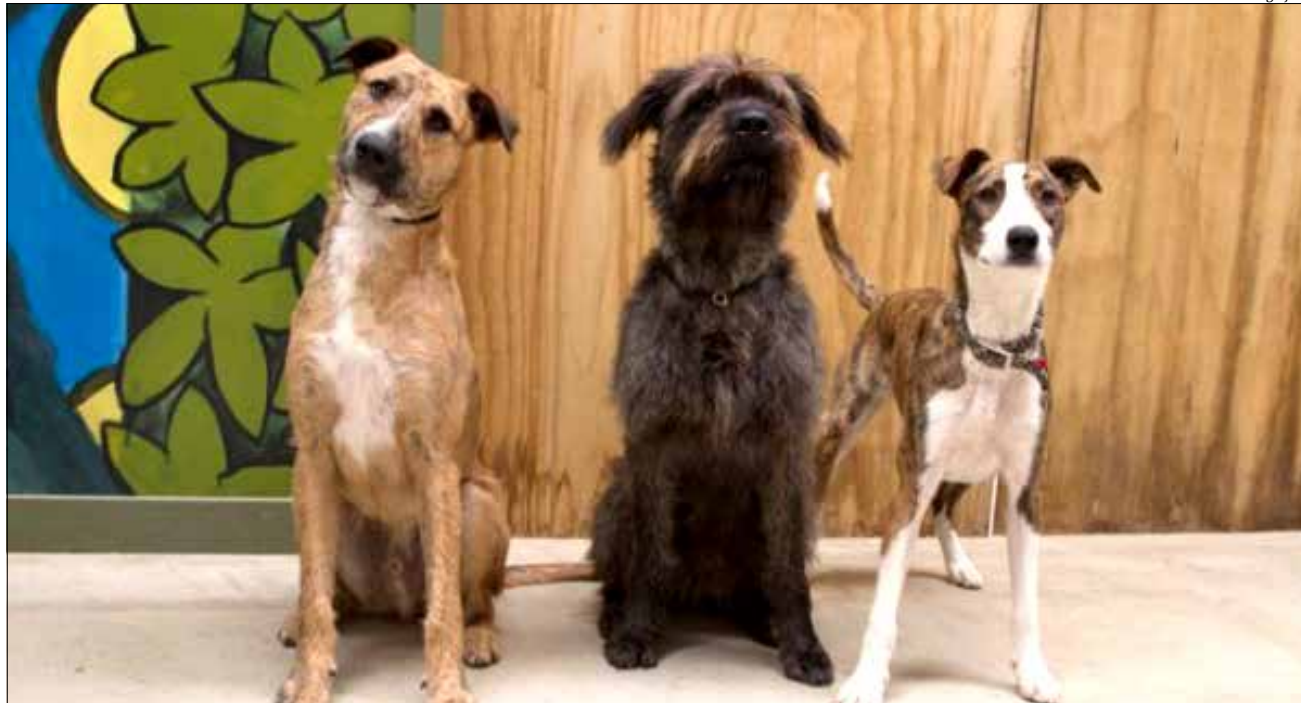
Exposição e concurso de cães acontece no dia 22 de março, durante a feira