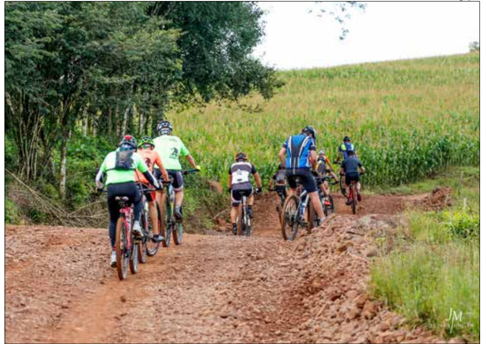
Primeira edição do evento foi realizada em 2018

Os inscritos terão as opções de trajetos de 30