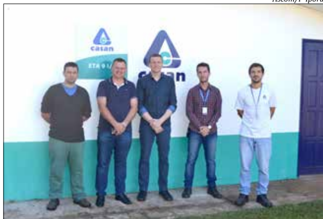
Biólogo, acompanhado de autoridade, percorreu pontos do sistema de captação