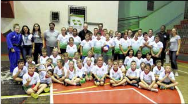
Entrega das camisetas aconteceu na última sexta-feira