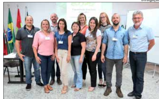
Reunião foi realizada quinta-feira, na sede do Sindicato dos Produtores Rurais

O Plano de Recursos Hídricos foi contratado pela Secretaria de Estado do Desenvolvimento Econômico Sustentável (SDS) e elaborado pela FAI Itapiranga. A Ecopef vai disponibilizar para o Comitê Antas uma equipe técnica formada por um coordenador regional, uma engenheira agrônoma, especialista na área de recursos hídricos e uma técnica em administração.