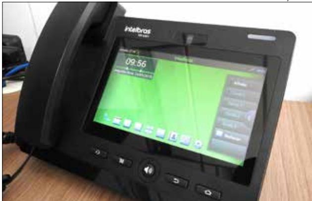
Segundo a administração, a mudança vai gerar economia de 80%