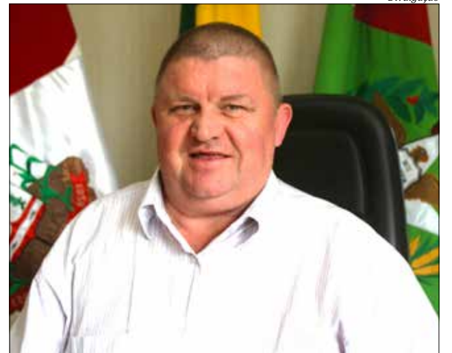
Prefeito de Itapiranga, Jorge Welter