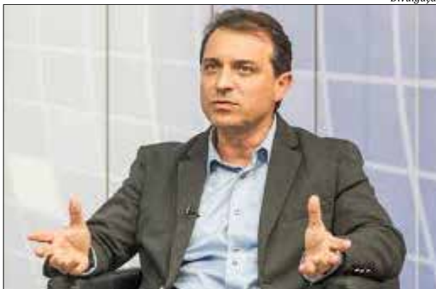
Governador Carlos Moisés prometia a desativação ainda durante a campanha eleitoral

A partir do dia 1º de maio, as estruturas devem estar desativadas e as setoriais e entidades da administração direta que detêm a competência legal ou regimental devem assumir as