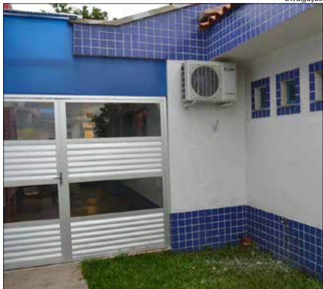
As obras devem estar concluídas até o dia 11 de janeiro