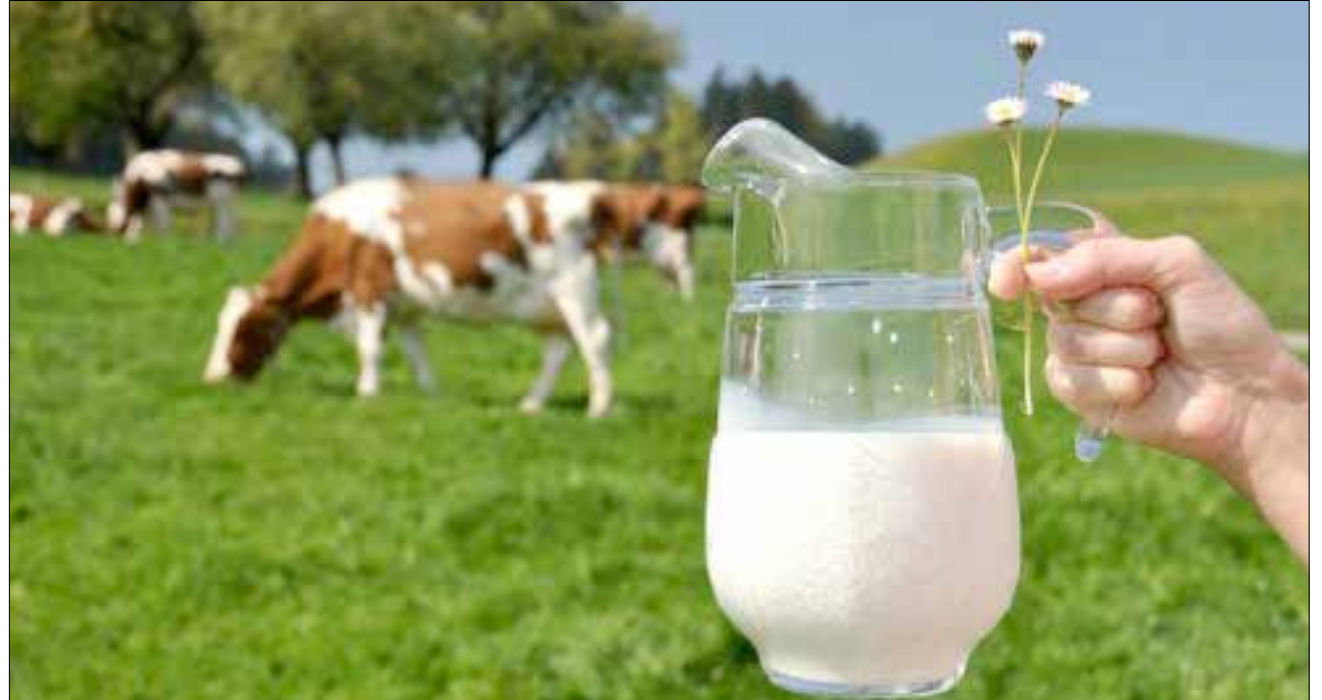
O Brasil é autossuficiente em lácteos e a importação injustificada cria um ambiente prejudicial ao setor