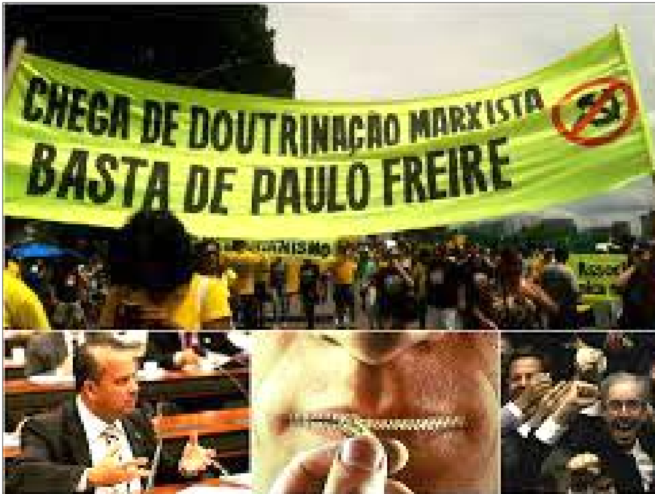
As investidas contra a "doutrinação política e ideológica" a esquerda nas escolas

Dados mostram a insuficiência do sistema de cotas e de programas de subsídio financeiro para fazer frente às brutais diferenças de oportunidade entre as classes sociais. Os alunos das escolas públicas são alvo fácil para o curral ideológico e eleitoral, uma vez que medem a fidelidade segundo convicções próprias e não o conhecimento.