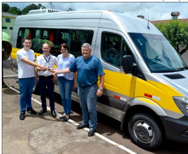
Novo veículo foi entregue sexta-feira