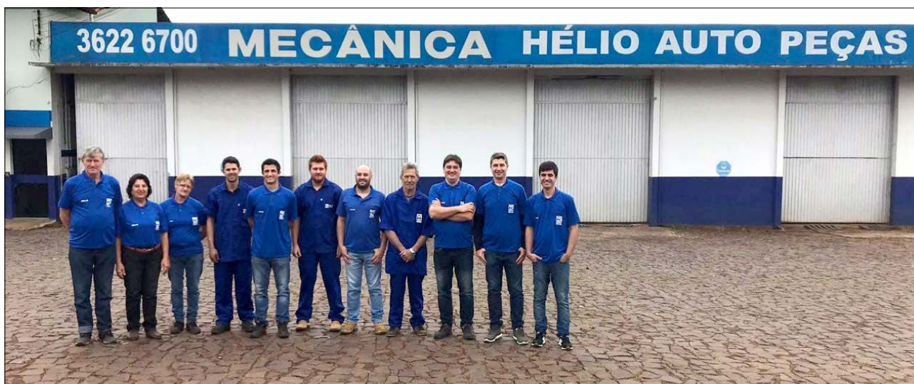
Proprietários e funcionários que fazem da Hélio Auto Peças uma referência em mecânica pesada