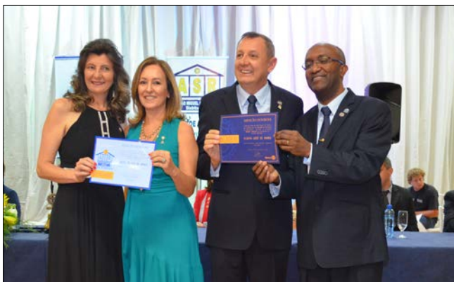
Os rotarianos que, de uma forma ou outra, contribuíram com o clube de serviço foram homenageados

ção de uma Casa de Apoio para abrigar familiares de pacientes que estiverem em tratamento no Hospital Regional. Para esta ação, a prefeitura de São Miguel do Oeste fez a doação de dois terrenos e o Rotary promoveu uma ação entre amigos com o sorteio de um veículo.