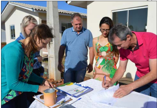
Ato de assinatura dos contratos aconteceu sexta-feira