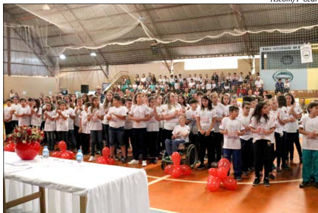
O Proerd é realizado com alunos do 5º ano das escolas municipais e estaduais

O Proerd é realizado com alunos do 5º ano das escolas municipais e estaduais. O programa tem o objetivo de