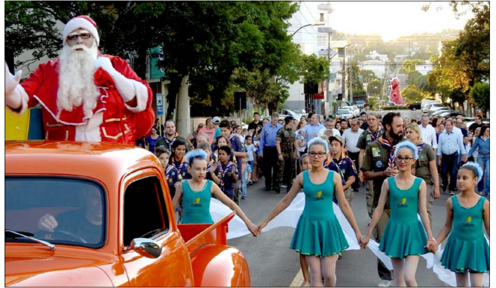
Em São Miguel do Oeste, programação iniciou com o desfile do Papai Noel pelo centro da cidade

Já na tarde de domingo, as duas praças centrais de São Miguel do Oeste foram palco de atrações musicais. À noite, foi realizada a “Caminhada das Lanternas”, um evento ecumênico coordenado pela Igreja Evangélica de Confissão Luterana do Brasil. A caminhada saiu da Igreja Evangélica de Confissão Luterana do Brasil e seguiu até a praça Walnir Bottaro Daniel, onde foram lidas mensagens e entoados cantos natalinos.