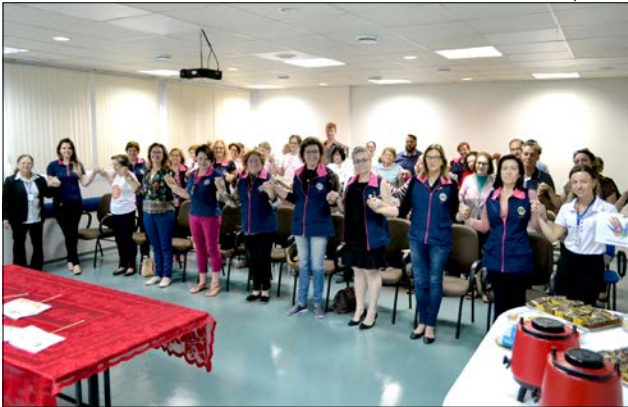
Entidades voluntárias foram recepcionadas ontem