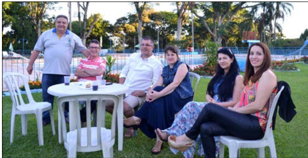
Associados podem aproveitar toda a infraestrutura junto à natureza