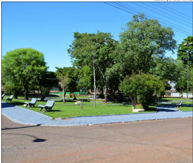
Praça recebeu obras de revitalização