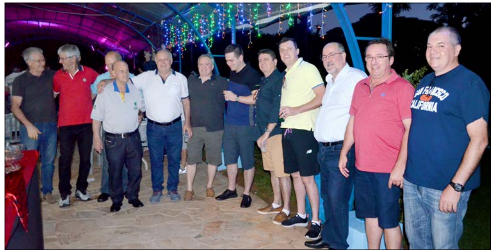
Diretoria e associados confraternizaram em festa realizada sábado