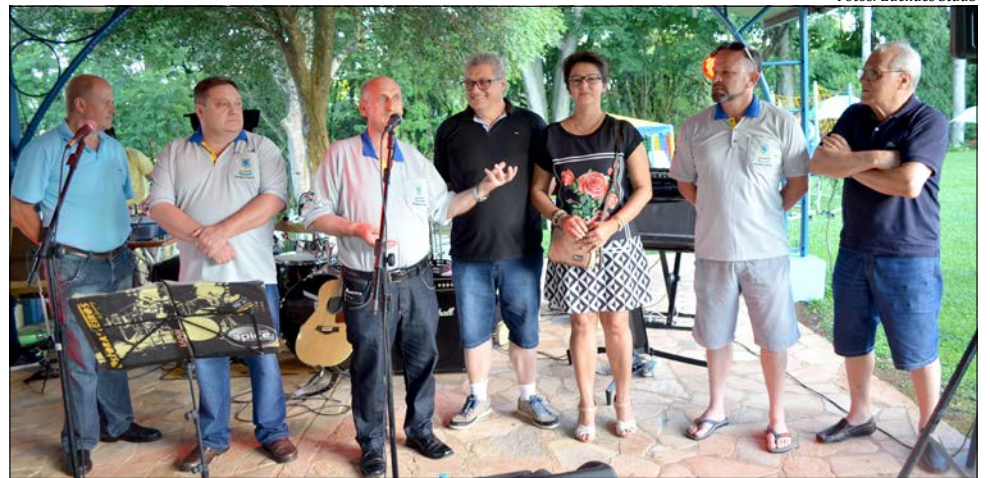
Abertura oficial da temporada foi feita pelo presidente Edi Bagetti