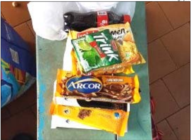
Com o acusado foram encontrados chocolates e outras mercadorias