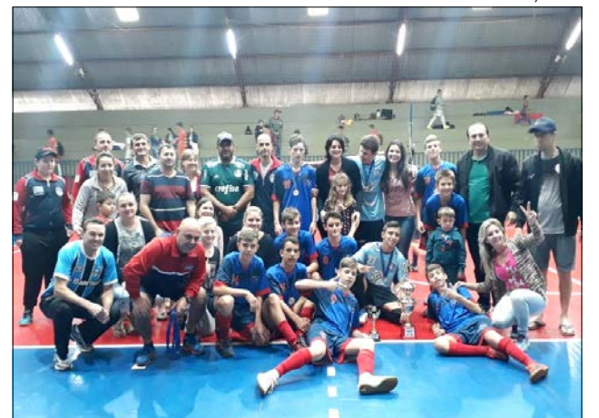
Equipe sub-14 foi uma das campeãs