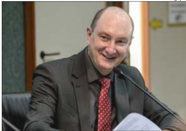
Deputado estadual Mauro De Nadal