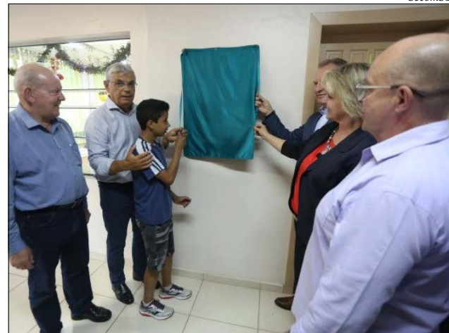
Inauguração das obras de ampliação foi realizada sexta-feira