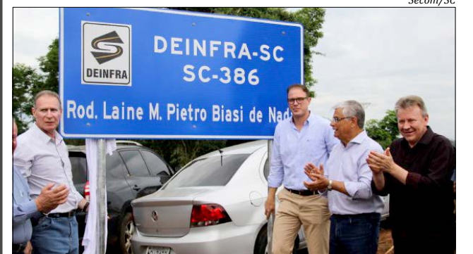
Ato de descerramento da placa foi realizado sexta-feira