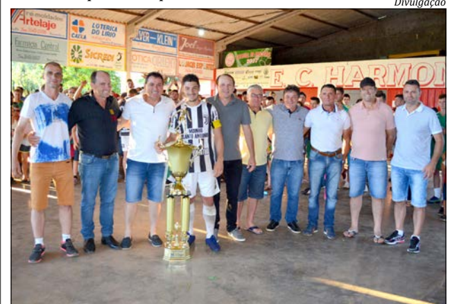
Juventude venceu o Itapajé e levou a taça

As finais da Categoria Aspirante que aconteceriam na última sexta-feira, 23, precisaram ser adiadas. Nesta semana nova data será divulgada pelo Departamento Municipal de Esportes.