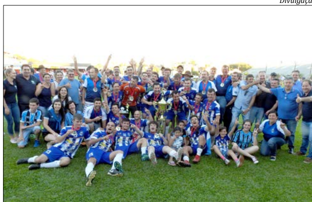
Grêmio Guamerim levou a taça ao empatar em 2 X 2 com o Atlético