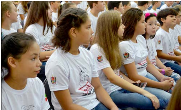
A formatura para os 113 alunos ocorreu no Centro de Múltiplo Uso Professor Alfredo Ames