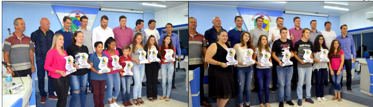
Integrantes dos dois grupos do Parlamento Jovem receberam cópia da Lei Orgânica de Descanso, do Regimento Interno da Câmara e um exemplar do livro "Nos rastros da Coluna Prestes"