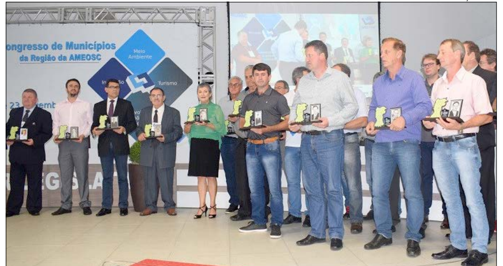
Ex-presidentes e colaboradores foram homenageados no último dia do congresso

O Congresso teve por objetivo o debate de ideias e a troca de experiências envolvendo a administração municipal. Para isso, contou com nove palestras, centradas em três eixos temáticos. A abertura oficial foi proferida pelo presidente da Ameosc e prefeito de