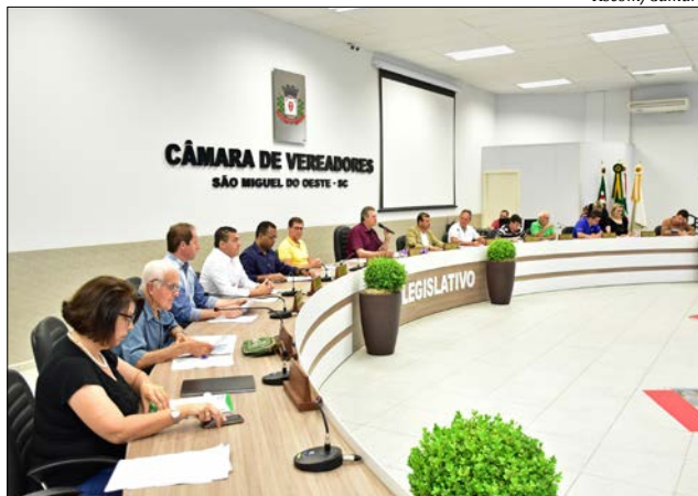
Vereadores aprovaram três projetos de lei em sessão extraordinária

FINANCIAMENTO Já o Projeto de Lei 122/2018, autorizaria o Executivo a contratar