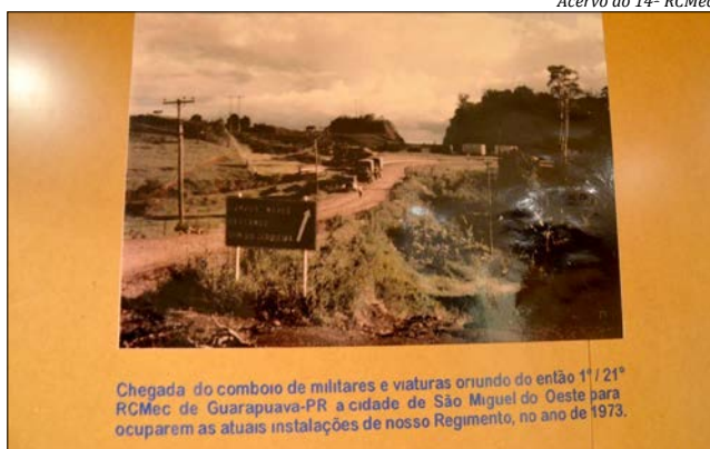
Chegada do comboio de militares e viaturas oriundo do então 11º/21º RCMec de Guarapuava-PR a cidade de São Miguel do Oeste para ocuparem as atuais instalações de nosso Regimento, no ano de 1973.

21º RCMec foi a primeira unidade do Exército em São Miguel do Oeste desde 1973