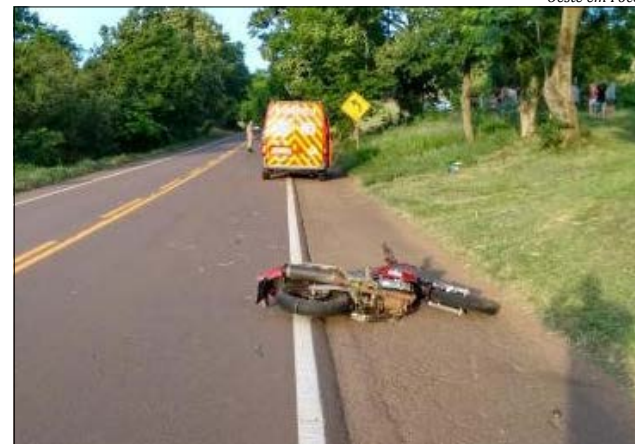
O acidente aconteceu na região de Linha Popi, pouco antes das 19h