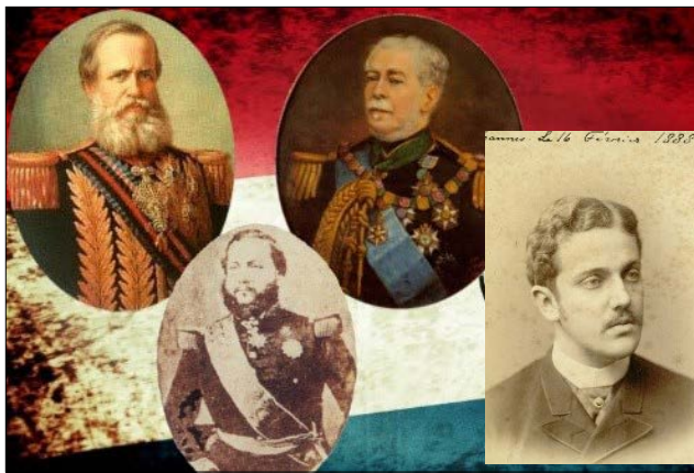
Comandaram o Exército brasileiro na Guerra do Paraguai de Solano Lopes, respectivamente: Manuel Luiz Osório, Francisco de Lima e Silva e o Conde d'EU