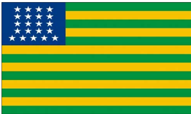
Primeira bandeira republicana

Vale lembrar que, a essa altura, Caxias considerava a continuidade da ofensiva brasileira uma carnificina e demitiu-se do comando do Exército, que passou ao Conde d'Eu, marido da princesa Isabel, aquela que em 1888, libertou os escravos por meio da Lei Aurea. Ao Conde coube conduzir as últimas operações, exterminando boa parte da nação Guarani. Cujo objetivo era receber os louros da guerra e herdar o trono. Porém, os generais Deodoro da Fonseca e Floriano Peixoto frustraram o intento do nobre francês, proclamando a República. Teodoro da Fonseca foi o primeiro e Jair Messias Bolsonaro será o 38º Presidente.