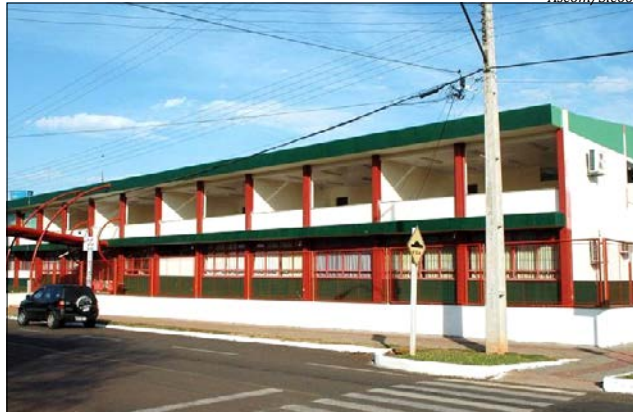
Após milhões em investimentos e muitos anos de espera, alunos poderão usufruir das reformas

Na tarde de quarta-feira, 07, o secretário executivo da Agência de