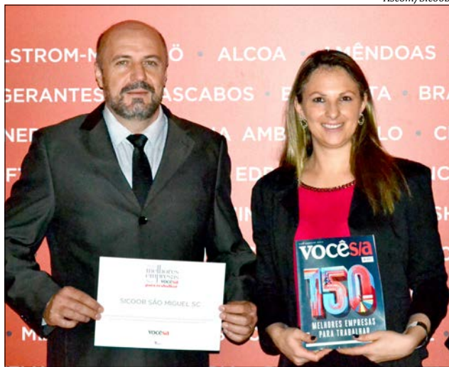
Premiação foi entregue no dia 06 de novembro, em São Paulo