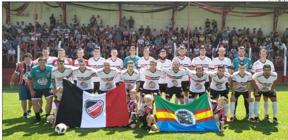
Aliança, de São João do Oeste, enfreta o CRM, de Maravilha, no primeiro jogo da final no próximo domingo

O Guarani precisava vencer por um gol de diferença para levar a decisão para os pênaltis ou por dois gols de diferença para garantir a vaga direta para a final. O duelo foi difícil. O gol do Bugre do Oeste aconteceu somente aos 25 minutos do segundo tempo, com Luizinho. A partida terminou em 1 X 0 para o Guarani e com esse resultado a decisão