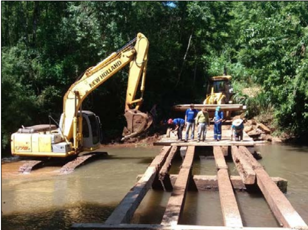
Ponte de madeira sobre o Rio Macaco Branco recebeu reforma completa