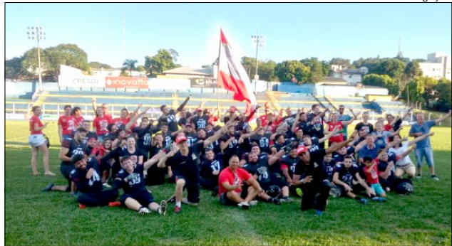
Atletas do São Miguel Indians comemoraram a conquista