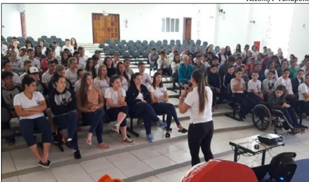
O projeto atende desde as creches até os grupos de idosos do município