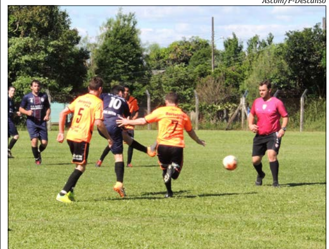
Partidas realizadas se contabilizaram a pontuação por empate ou vitória

Conforme o regulamento, as semifinais e finais não se contabilizam por saldo de gols. Em caso de igualdade na pontuação dos jogos de volta, as equipes disputam vagas através de pênaltis. No domingo, 18, os times inseridos na Série Prata voltam a campo. Em 25 de novembro, será a vez da série Ouro. Os jogos de volta estão programados no distrito de Itajubá.