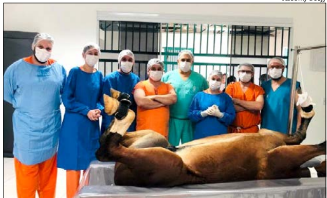
Bloco cirúrgico oferece mais possibilidades de aprendizado prático