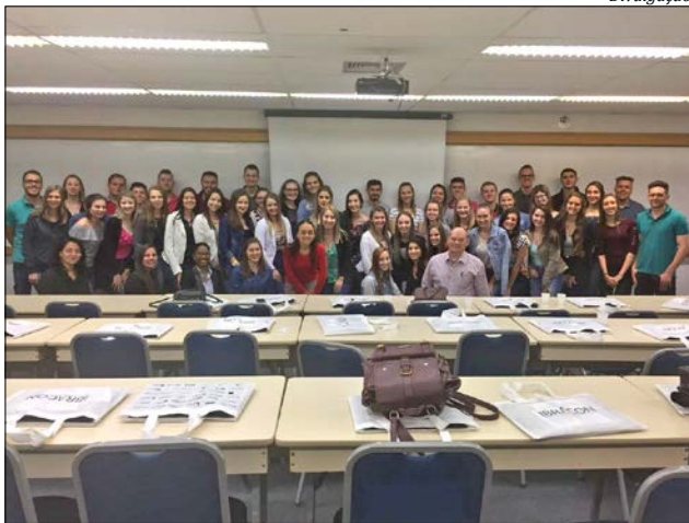
Estudantes conheceram o Ibracon

MADIPEÇAS PEÇAS E ACESSÓRIOS PARA AUTOMÓVEIS E CAMINHÕES