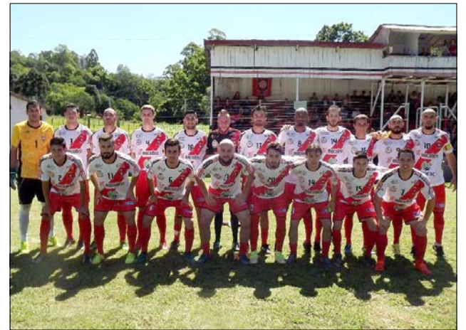
Guarani vai para o tudo ou nada domingo