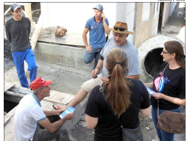
Homens estão sendo alvo de campanha durante todo este mês