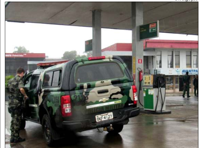
Postos foram fiscalizados em todo o Estado