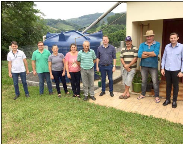
Cisterna foi doada à comunidade dentro do projeto de educação ambiental desenvolvido pela cooperativa