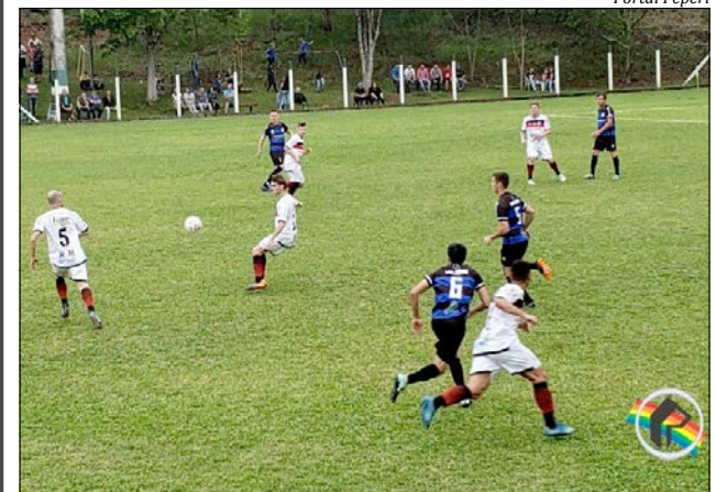
Cometa goleou o Grêmio Tunense por 3 X 0

O Ouro Verde, de Descanso, aguarda o desfecho do processo envolvendo o Ipiranga, de Águas Frias, e São Lourenço, de São Lourenço do Oeste, para saber quem será seu adversário. Os vencedores do mata-mata da segunda fase irão enfrentar, na sequência, Guarani de São Miguel do Oeste, Ginástica de Riqueza, CRM de Maravilha e DNA/DME, de Princesa. Os enfrentamentos serão definidos por índice técnico.