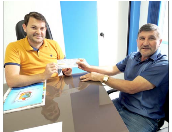
Ato de entrega simbólica do cheque ocorreu na manhã de sexta-feira