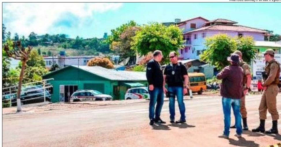
Reconstituição foi feita na rua em frente e também no escritório da vítima

A confirmação da prisão do suspeito de participação no crime foi feita por meio de uma nota oficial à imprensa. De acordo com o documento, assinado pelo delegado regional Adriano Bini, o autor do disparo participou da reconstituição para a busca de ele-