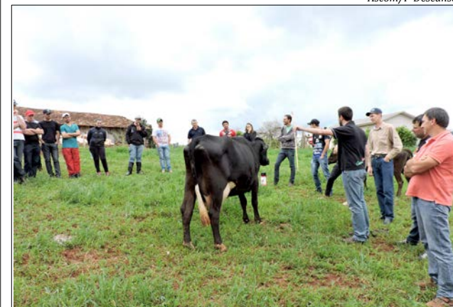
Aproximadamente 60 agricultores e inseminadores participaram da programação