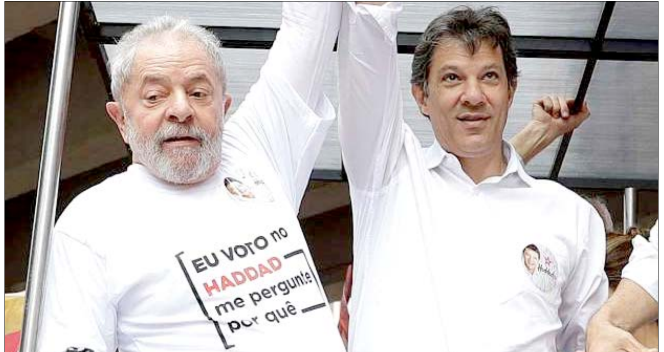
Propaganda enganosa: Lula não pode votar

A menos que haja uma mudança significativa no quadro, assistiremos a um confronto dos "antis" no segundo turno. Ou por outra: pela primeira vez, com efeito, o Brasil elegerá mais o seu "não-presidente" do que o seu "presidente".