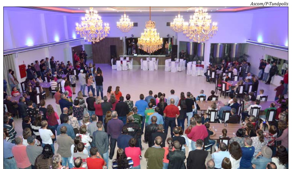
Inauguração contou com a presença de autoridades e população

A estrutura contempla um pavilhão de 1.200 metros quadrados, piscina, um lago de águas dançantes, tirolesa, quadras de areia e a fábrica do Chope Baumgratz, com vista parcial dos tanques de fermentação, oferecendo aos visitantes um local peculiar com atendimento diferenciado.