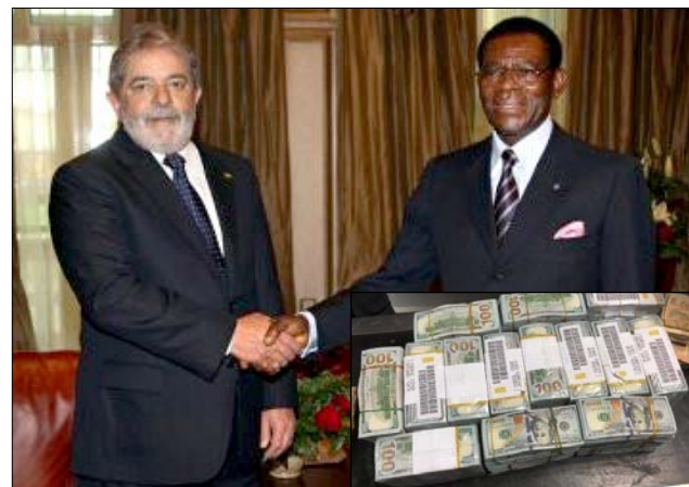
Lula com o ditador da Guiné Equatorial

- Além de Bolsonaro, a Polícia Federal e o judiciário também podem complicar o pleito esquerdista no Brasil.