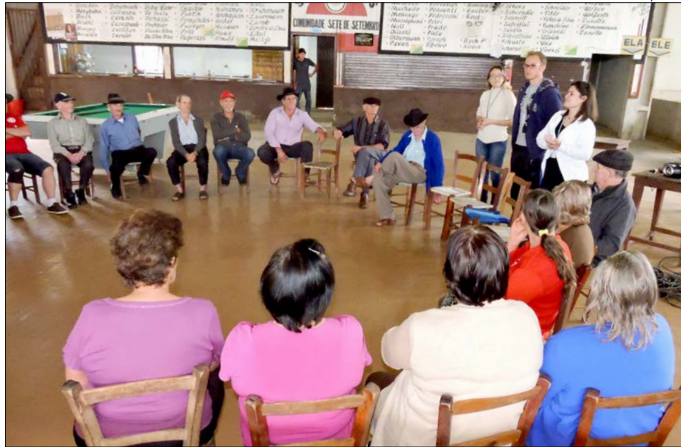
Trabalhos estão sendo feitos junto aos clubes de idosos do município