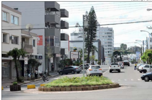
No total, são três equipamentos, nas esquinas com a Avenida Getúlio Vargas, Rua Sete de Setembro e Rua Almirante Tamandaré