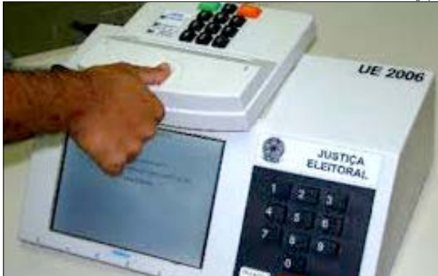
Eleitores poderão acessar a urna eletrônica com biometria ou com título de eleitor

Na última eleição, em 2016, apenas nove municípios tiveram eleições híbridas no Estado. Ao todo, neste ano, são 3.216.364 eleitores que votarão com identificação biométrica nas 295 cidades, o que corresponde a 63,44% do eleitorado catarinense. Nos municípios em que a eleição é híbrida, no total, são 1.056.498 eleitores cadastrados biometricamente. Já nas cidades em que as eleições são 100% por meio de identificação biométrica, os eleitores somam 2.159.866.