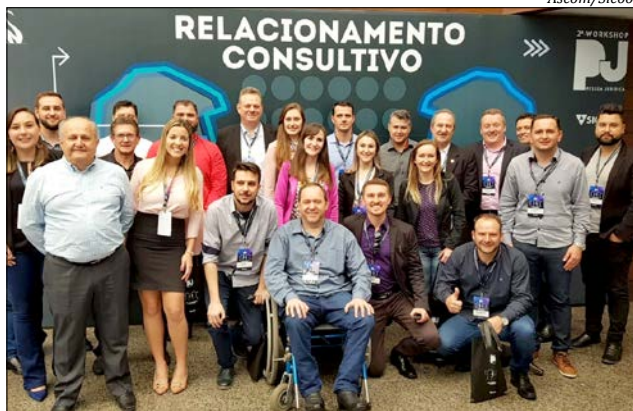
Equipe de 14 colaboradores do Sicoob São Miguel estiveram presentes

Sobre o evento, ele conta que no Workshop foram apresentadas melhorias nas tecnologias de comunicação como celulares e computadores, implantação de novas funcionalidades que irão aproximar mais a cooperativa dos seus associados. “Pode-se notar também que, mesmo em épocas em que o mercado aponta recessão, o Sicoob conseguiu ampliar mais seu relacionamento com as empresas tendo um ótimo crescimento de 2017