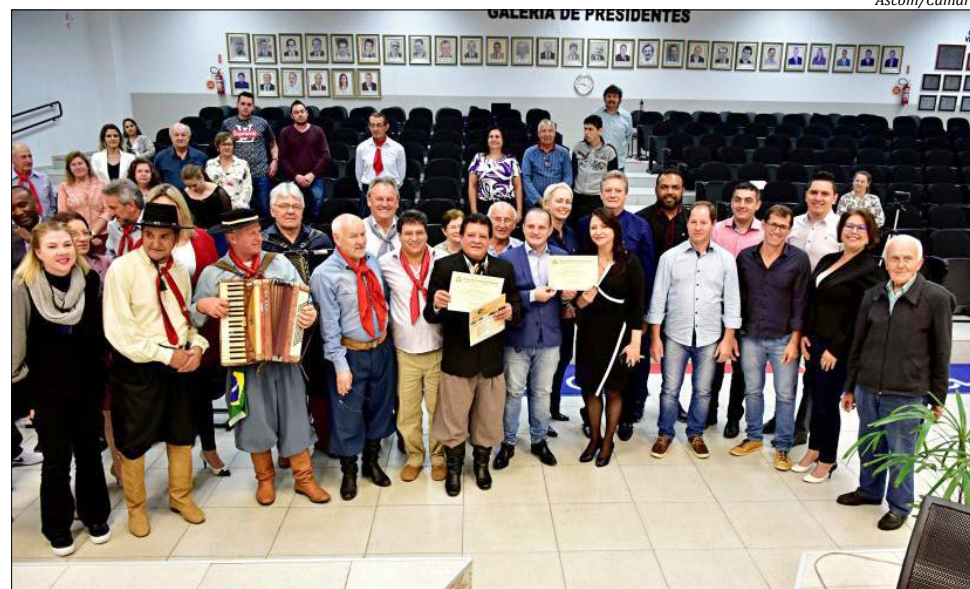
Câmara homenageou os 30 anos do programa Pampa e Querência

O programa Pampa e Querência vai ao ar aos domingos, das 9h45min às 12h. Nesses 30 anos de existência, o programa Pampa e Querência só tem agradado cada dia mais o seu público pelas belas músicas tocadas, sempre atendendo muito bem a todos que solicitam uma música que desejam escutar para matar a saudade. Só temos a agradecer esses profissionais