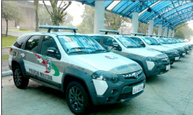
Viaturas foram entregues para São Miguel do Oeste, Maravilha, Itapiranga, Anchieta, Cunha Porã, Campo Erê, São José do Cedro, Dionísio Cerqueira e Romelândia

Serão quatro viaturas para São Miguel do Oeste e uma para Maravilha, Itapiranga, Anchieta, Cunha Porã, Campo Erê, São José do Cedro, Dionísio Cerqueira e Romelândia. Com o reforço dos novos veículos, a Rádio Patrulha de São Miguel do Oeste está praticamente com toda a frota nova.