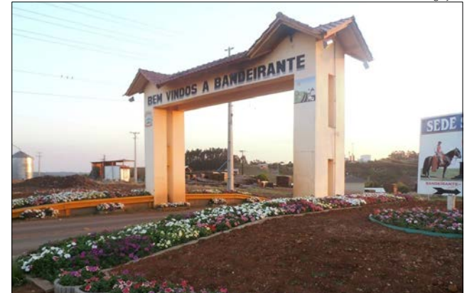
Bandeirante foi desmembrado de São Miguel do Oeste em 29 de Setembro de 1995, tornando-se município