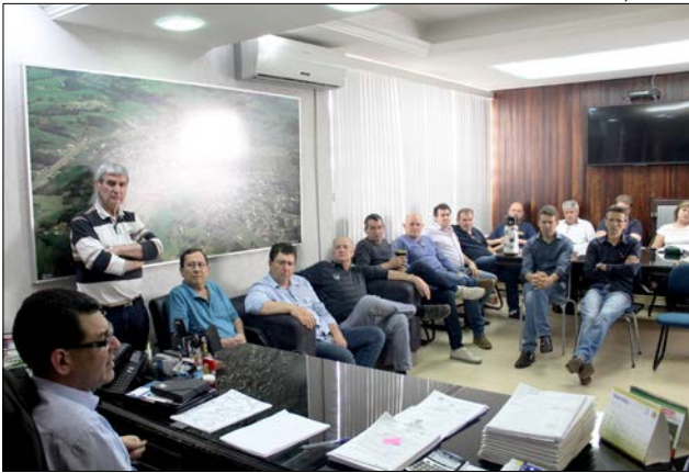
A reunião tem o objetivo de explicar e destacar sobre a necessidade de atualizar a legislação que versa sobre toda arrecadação do município