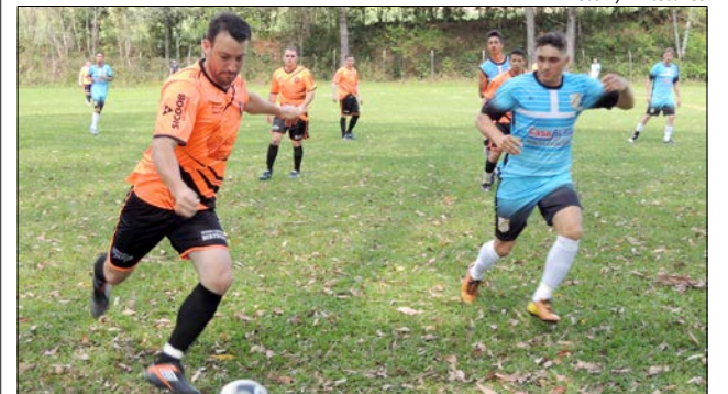
Piratini e Unidos Futebol Clube ficaram no 0 X 0