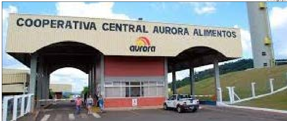
A Aurora Alimentos tornou-se uma comunidade formada por mais de 100 mil famílias espalhadas por 500 municípios brasileiros