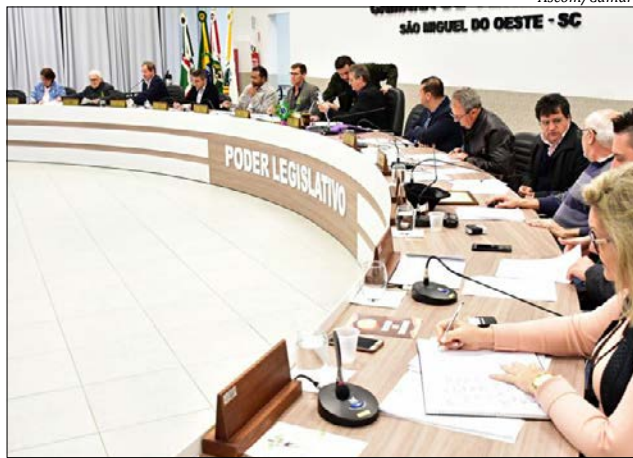
Proposta foi aprovada em segundo turno terça-feira

A matéria estabelece que as programações orçamentárias não serão de execução obrigatória nos casos dos impedimentos de ordem técnica. Nestes casos, o Executivo deverá justificar o impedimento até 120 dias após a publicação da Lei Orçamentária. Até 30 dias após este prazo, o Legislativo indicará ao Executivo o remanejamento dessa programação. O texto prevê ainda que até 30 de setembro o Executivo encaminhará projeto sobre o remanejamento dessa programação. Se até 20 de novembro o Legislativo não deliberar sobre o projeto, o remanejamento será implementado