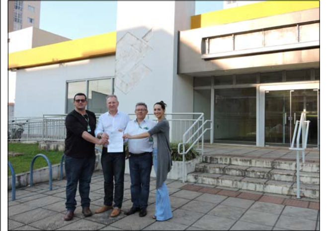
Município tomou posse do imóvel quinta-feira