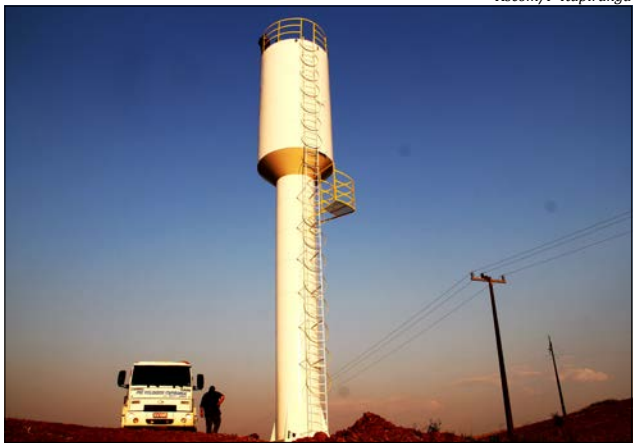
Reservatório metálico de 60 mil litros foi instalado no final da tarde de quinta-feira