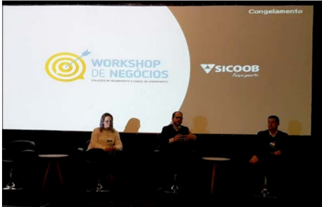
Representantes do Sicoob São Miguel participaram do evento em Florianópolis e Chapecó