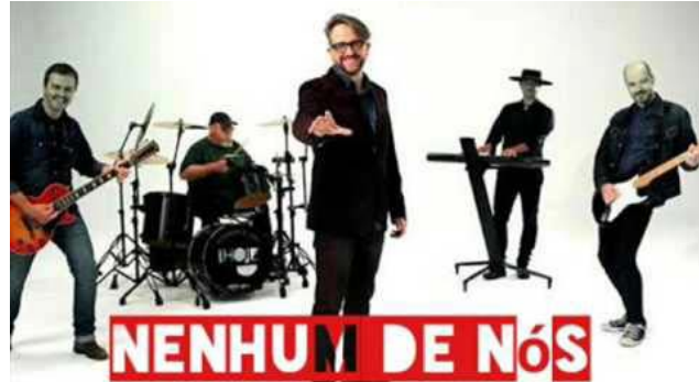
Dia 15 de setembro, sábado, tem Nenhum de Nós em São Miguel

(49) 9 9903 1588; (49) 9 9988 0547 e (49) 3622 0234.