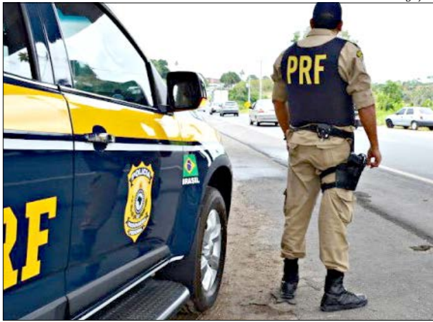
Fiscalizações na região serão intensificadas