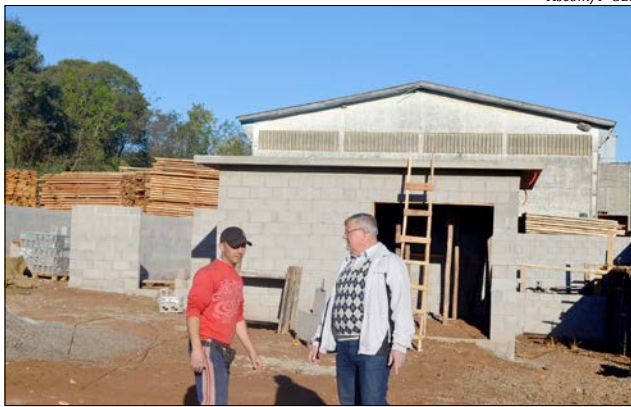
Outras empresas já estão se instalando na área

Já estão instalados nesta área industrial as empresas Revest Estofados, Marmoraria Gua-