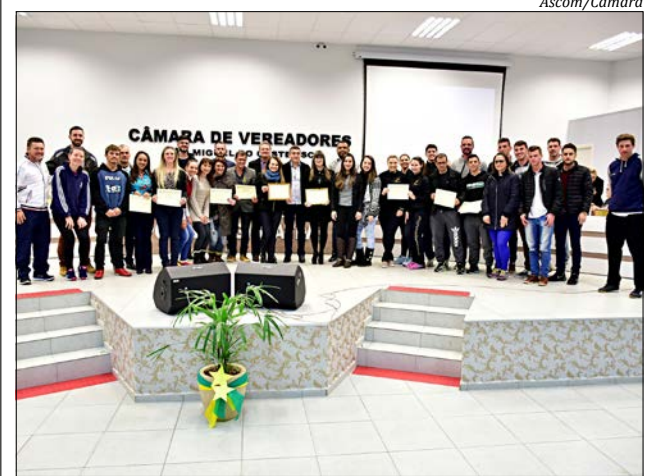
Homenagem foi prestada durante sessão de terça-feira