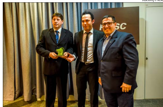
Representante do Instituto Santé recebeu o Prêmio Expressão de Ecologia conquistado pelo Hospital Regional

ESTADO DE SANTA CATARINA / PODER JUDICIÁRIO