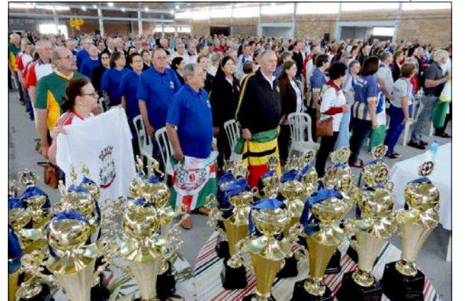
Atletas de 17 municípios disputaram troféus e medalhas de seis modalidades esportivas