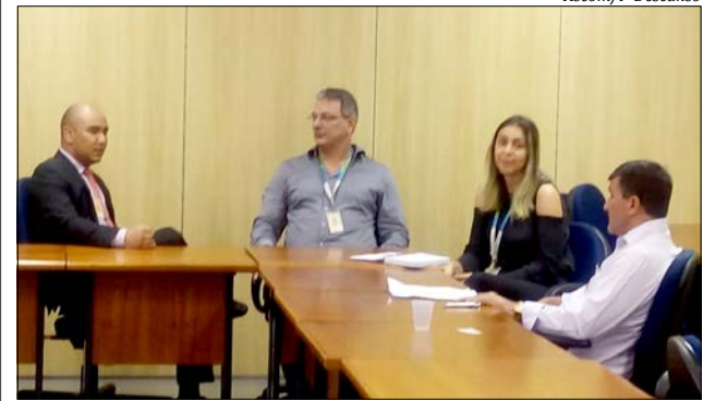
Durante reunião, proprietário do imóvel se comprometeu em fazer as readequações estipuladas pelo cronograma