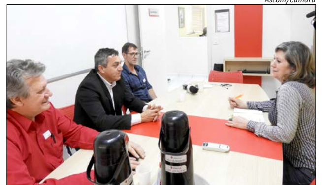
Vereadores conversaram com a direção dos hospitais, que também atendem pacientes da região