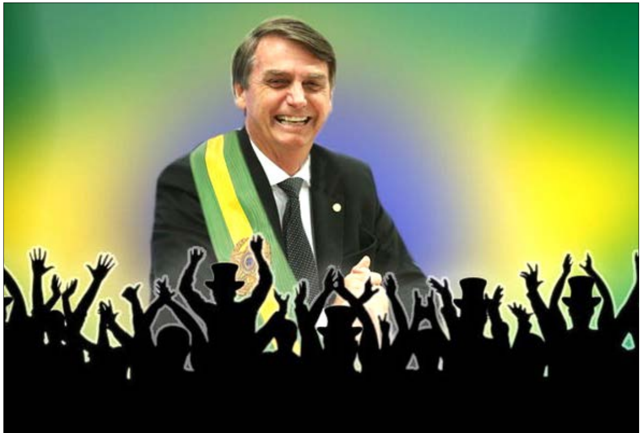
Pela última pesquisa Ibope, Jair Bolsonaro tem chances de vencer já no primeiro turno

A mais recente pesquisa Ibope traz a Bolsonaro alegria, angústia e tensão aos demais. O candidato do PSL recupera-se do ataque sofrido e colhe frutos de sua enorme exposição. Mais ainda: sua condição de vítima lhe amainou a imagem e aumentou sua intenção de votos. Saiu de um candidato agressivo para um agredido, quase assassinado.