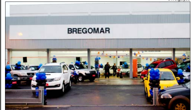
Esta é a quinta edição do feirão realizado na agência em São Miguel do Oeste