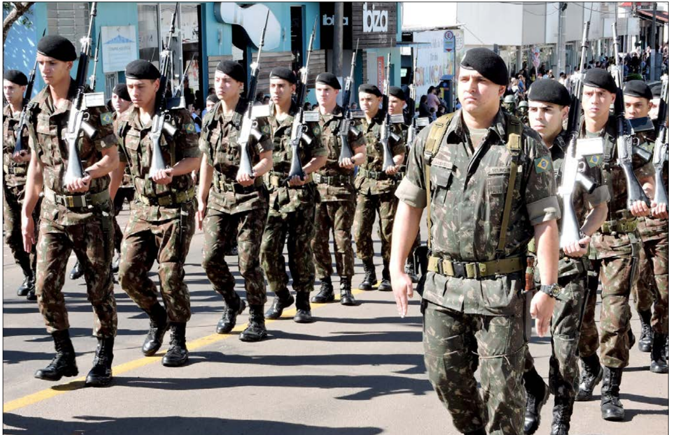
Em São Miguel do Oeste, desfile militar foi a atração para o público