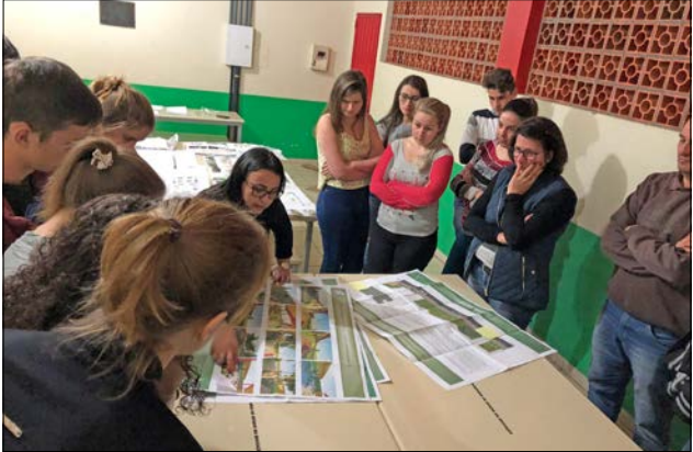
Cinco projetos de paisagismo foram apresentados à Escola Santa Helena