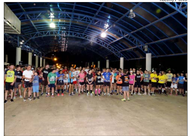
O evento teve a concentração, largada e chegada, na área coberta da praça Walnir Bottaro Daniel e reuniu 138 atletas do município e da região