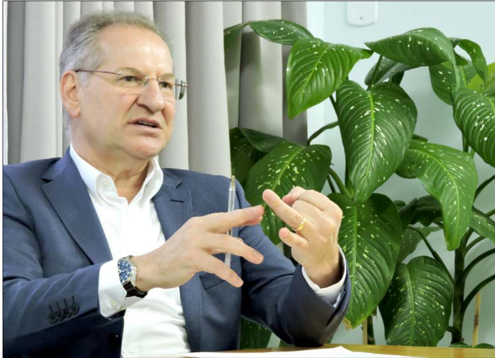
Prefeito Wilson Trevisan

Aqueles que fizeram o pedido de regularização em anos anteriores, ainda terão que aguardar o término dos processos que estão no Ju-