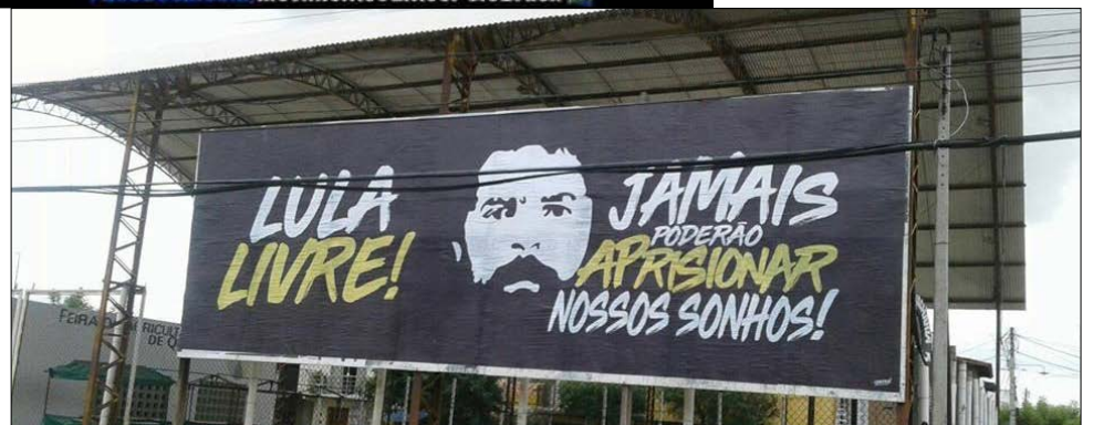
Outdoor pede "Lula livre" no Centro de Quixeramobim - Ceará

A primeira peça publicitária a ser instalada por ali, no dia 7 de julho, foi a de Lula, preso desde abril na Superintendência da Polícia Federal, em Curitiba. Com uma foto do ex-presidente nos anos 1980, o cartaz afirma: "Em defesa da Democracia, dos Direitos e da Soberania. Lula Livre."