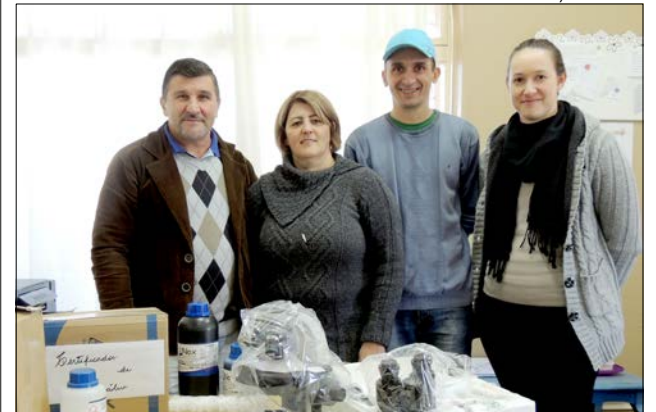
O investimento é de aproximadamente R$ 3,5 mil