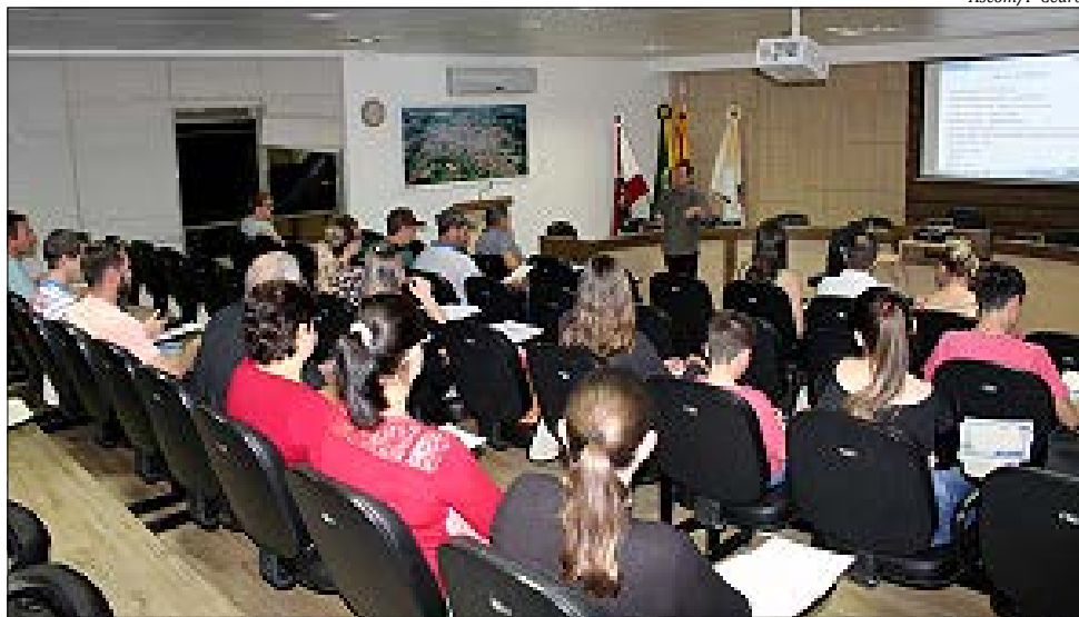
Oficina foi realizada na Câmara de Vereadores, terça-feira