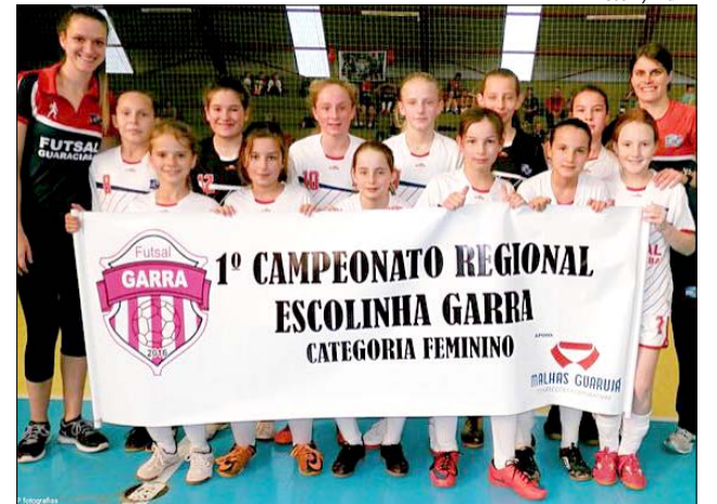
Equipes de Guaraciaba disputam campeonato de futsal feminino