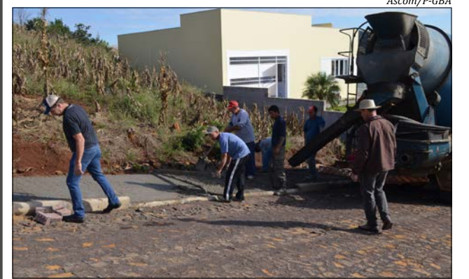
Obras estão em andamento e devem perfazer 4.623 metros quadrados

Conforme Meneghin, uma das prioridades da administração é justamente zerar a falta de calçamento nas ruas do perímetro urbano do município. “Com esses novos calçamentos, queremos trazer mais segurança na trafegabilidade, mais comodidade aos moradores e também padronizar as vias em nosso município”, diz.