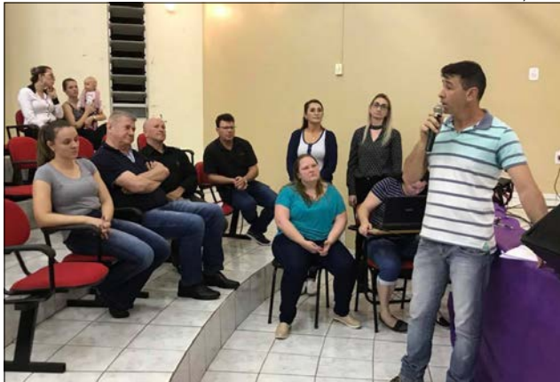
Diretoria da Associação levou a público a situação financeira atual do hospital

Entre as possíveis medidas está a formalização de parceria com os demais municípios da região para a realização de consultas de especialidades e também mutirões de cirurgias eletivas, além dos partos que já acontecem no hos-