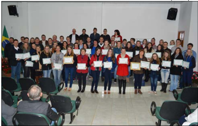
Ao todo, foram homenageados 46 estudantes