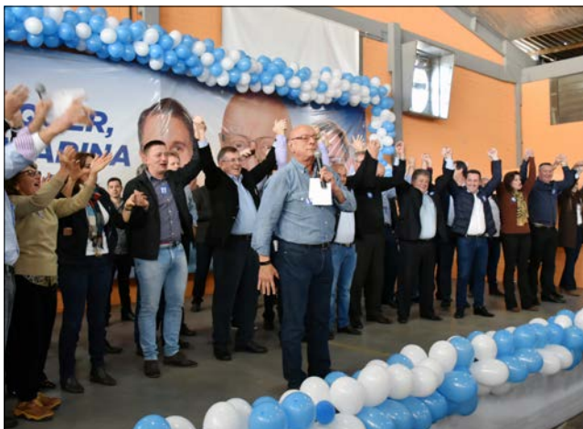
Em Nova Itaberaba, o PP lançou a pré-candidatura de Esperidião Amin

Além de Esperidião Amin e Paulo Bauer, MDB e PSD também já confirmaram candidaturas ao governo. MDB sai com o deputado federal Mauro Mariani e o PSD com o deputado estadual Gelson Merísio. Por fora, outros partidos também ensaiam lançar candidatos, como o PT e o PSL.