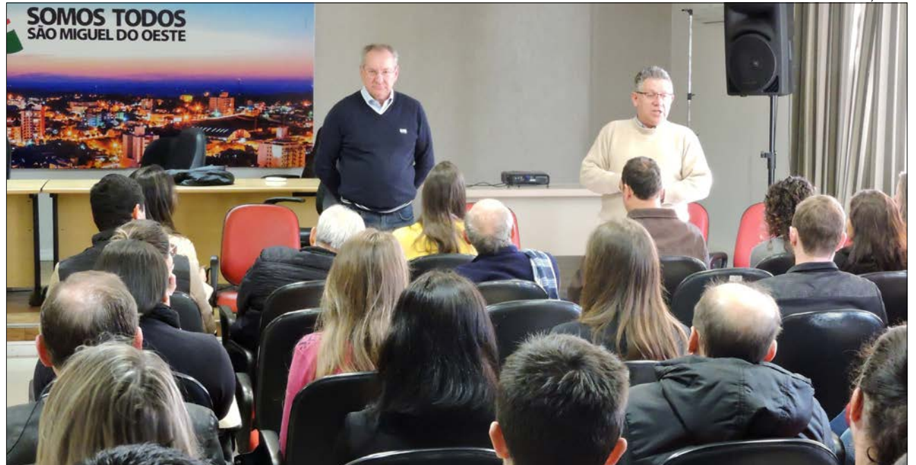
Encontro contou com a presença de profissionais dos escritórios de contabilidade do município