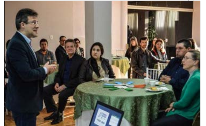
Lançamento do evento aconteceu na manhã de sexta-feira