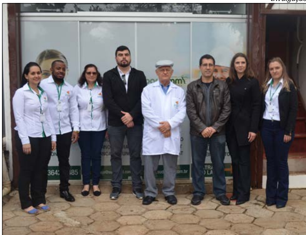
Franquia SudoMed se instalou recentemente em Guarujá do Sul