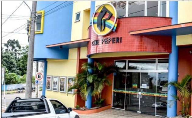
Cine Peperi vai sediar os debates que acontecerão até às vésperas das eleições

Enquanto isso, começa na sexta-feira, 31, a propaganda eleitoral gratuita obrigatória no rádio e na televisão. Os horários políticos nas emissoras de rádio serão de segunda a sábado, às 7h e às 12h, com duração de 25 minutos