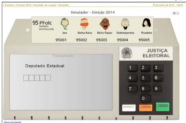
Urna simulada apresenta partidos fictícios para treinar eleitor