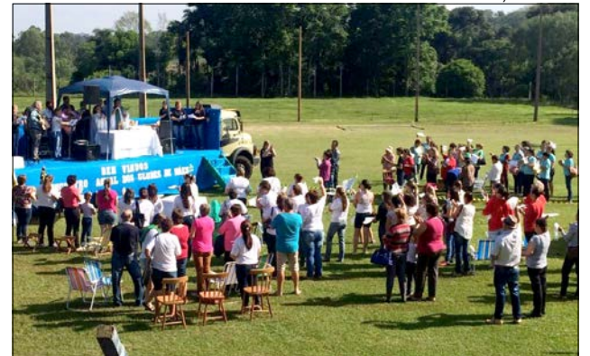
Participantes terão várias atividades, principalmente, a realização da gincana