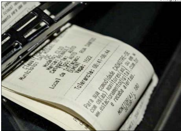
Durante os dois dias o veículo acumulou 13 notificações