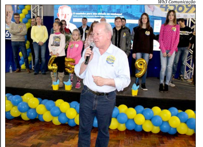
Candidatura foi lançada em Maravilha, na tarde de sábado