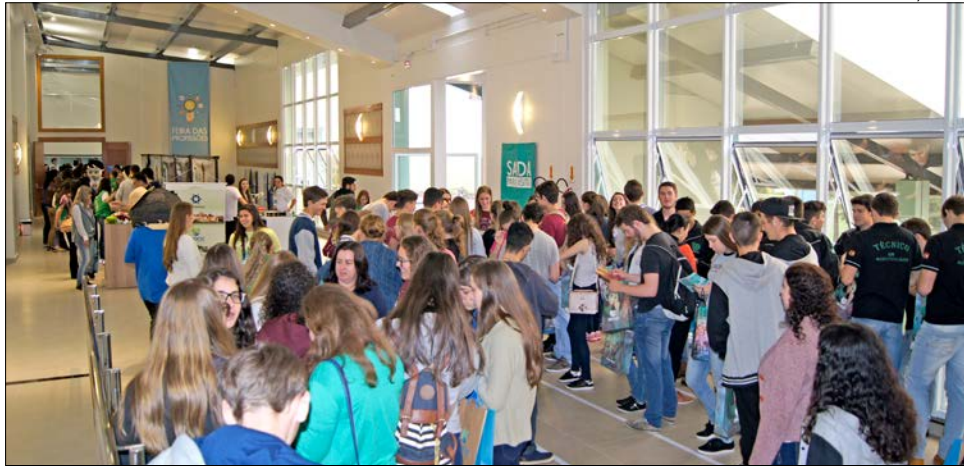
1ª edição da Feira das Profissões foi realizada ano passado

Quando o estudante chegar à Feira, já poderá retirar seu ticket na bilheteria e escolher o roteiro de sua preferência para conhecer a estrutura oferecida pelos cursos. Serão oferecidos quatro roteiros diferentes, com