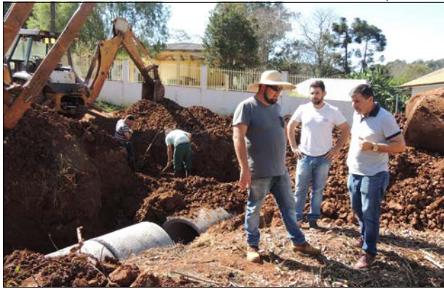
Investimentos com recursos próprios será de quase R$ 42 mil