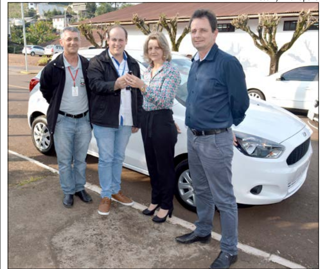
Veículo foi entregue na semana passada à Secretaria