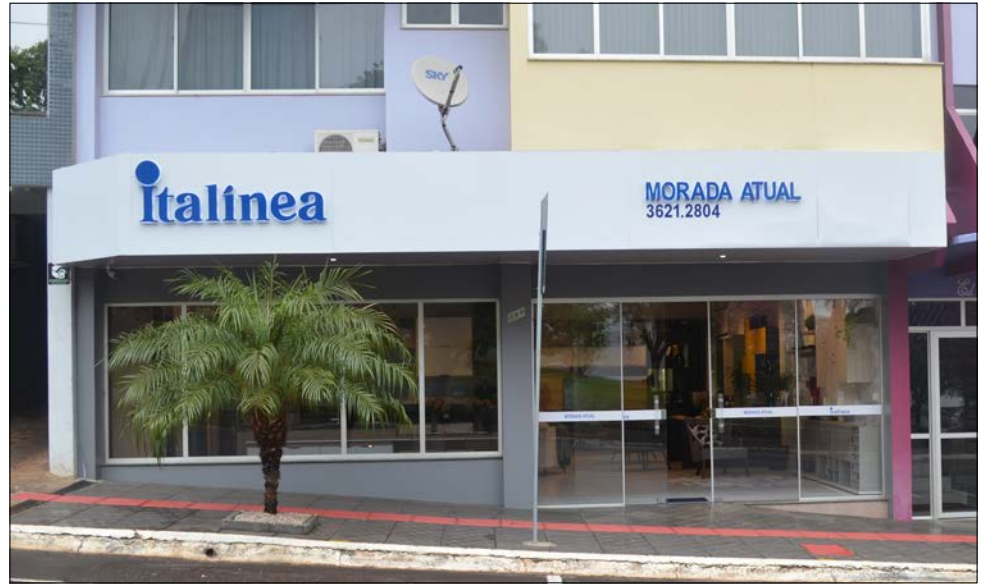
Loja abre as portas sábado, na Rua Almirante Barroso