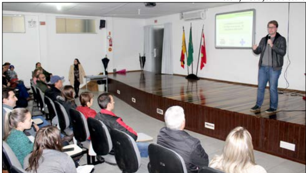
Evento atraiu proprietários e funcionários responsáveis pela fabricação de alimentos de São José do Cedro e Princesa.