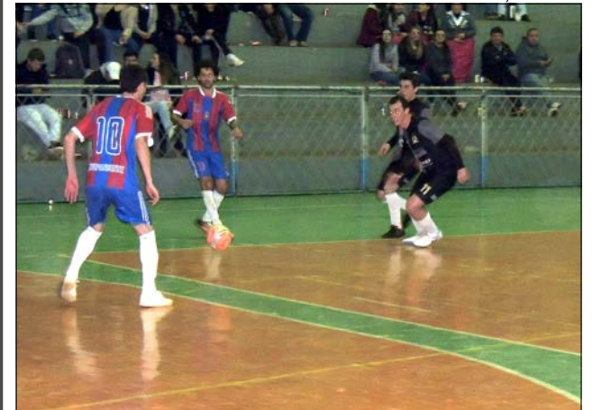
Partidas serão na sede da Afca a partir das 16h30