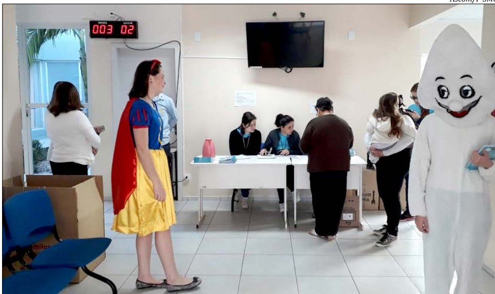
Personagens infantis foram usados para distrair as crianças nos locais de vacinação