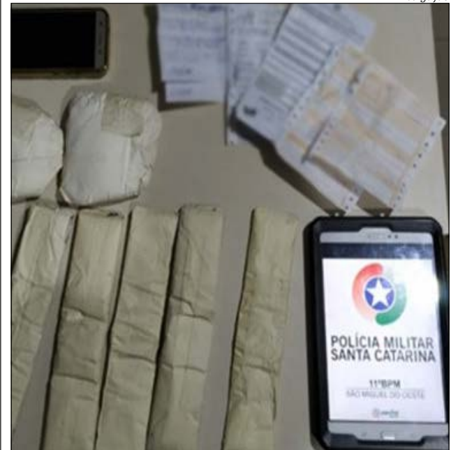
Com a mulher foram encontradas embalagens com cocaína