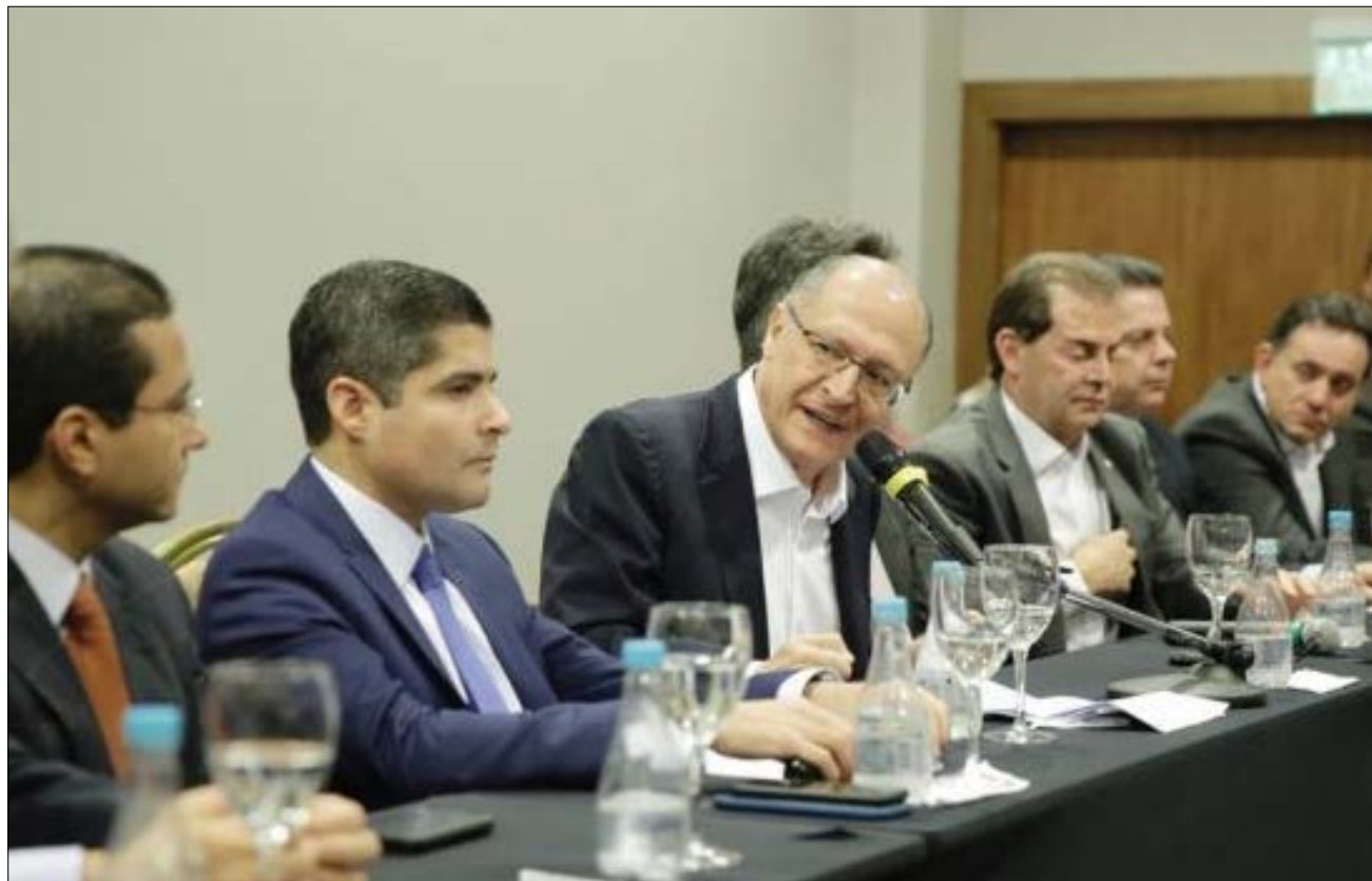
Alckmin e o centrão

Ceia nada santa. É a reunião da maior quadrilha já vista no planeta terra