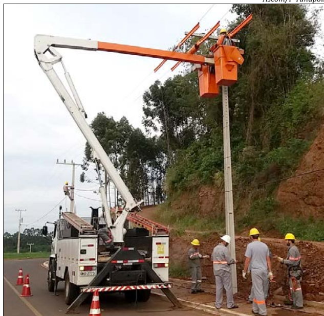
A empresa EB Instalações Elétricas, de Descanso, ampliou a rede de baixa tensão e instalou o poste com as luminárias

A prefeitura também oferece tele atendimento gratuito aos moradores que estiverem com problemas na iluminação pública. Por meio do número 0800 8 870870, o morador consegue abrir a ocorrência e solicitar a manutenção com a empresa Quark Engenharia. Ao abrir o chamado, é necessário que tenha em mãos o número do CPF, endereço, telefone e referências de localização.