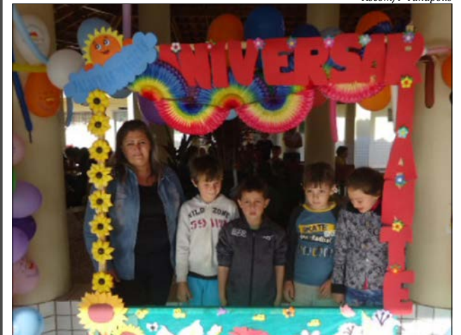
Aniversariantes do semestre foram homenageados