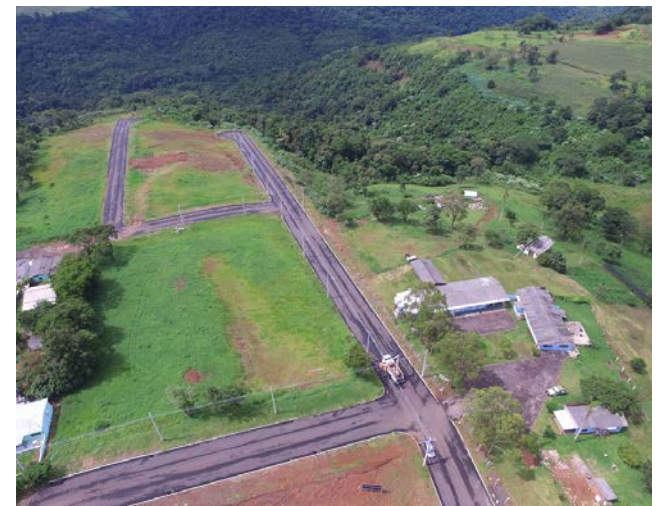
Loteamento Dona Lurdes Priori, ótimo investimento