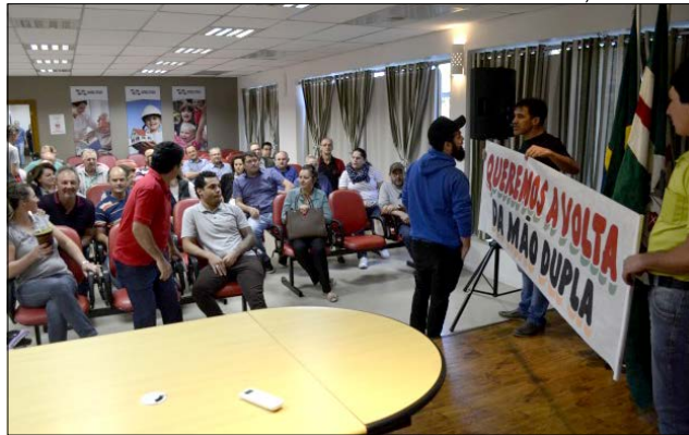
Empresários querem o fim da mão única na Marcílio Dias

Aproximadamente 40 empresários locais, que têm estabelecimento comercial localizado ao longo da Rua Marcílio Dias, reuniram-se no início da manhã de quinta-feira, 19, prefeitura de São Miguel do Oeste para conversar com a administração. A pauta era a