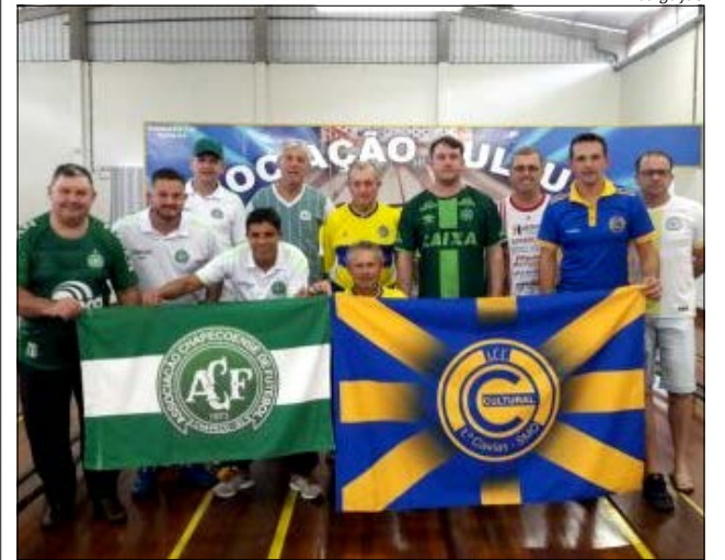
Amistoso foi decidido em encontro entre o Caxiense e o Consulado da Chapecoense