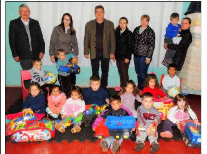
Creche Jeitinho de Ser foi contemplada com brinquedos novos