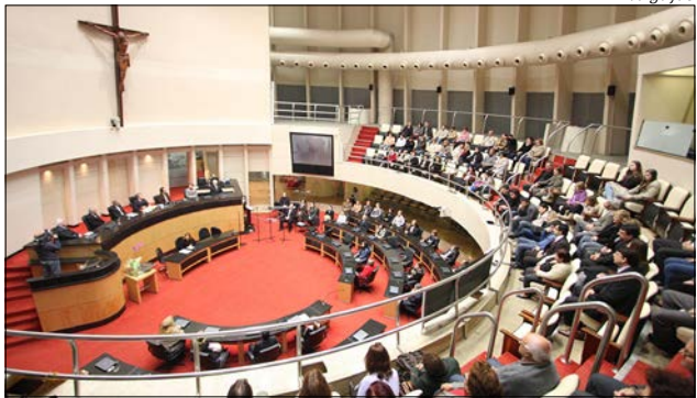
Deputados voltaram ao trabalho na tarde de ontem