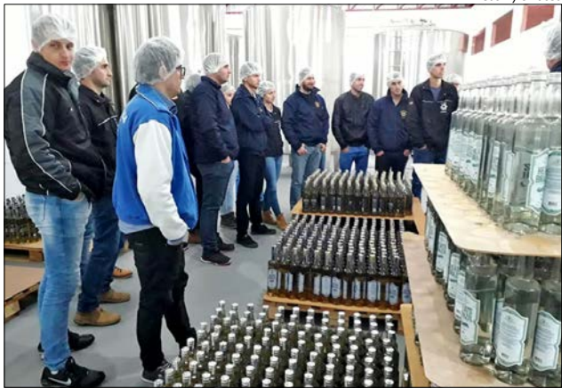
Estudantes visitaram a Cervejaria Big Jhon