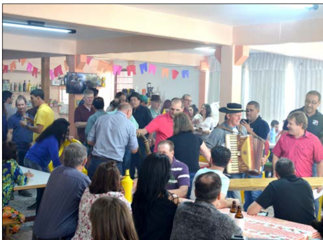
Encontro reuniu 230 lideranças pedetistas da região em São Miguel do Oeste