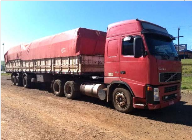
Caminhão estava estacionado no pátio do posto de combustíveis