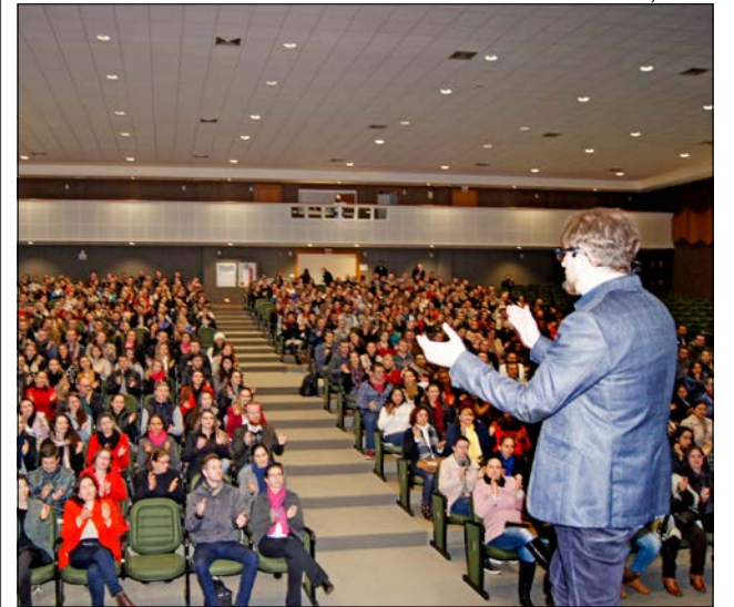
Evento foi realizado no Centro Cultural da Unoesc