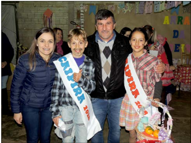
Além da comunidade escolar e pais, evento teve boa presença de público