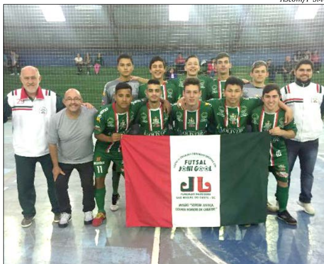
Equipe representa a Escola Estadual São Miguel Sérgio Luiz Marafon, em do Estado de Santa Catarina, por intermédio da promoção do Governo Fesporte.

A cerimônia oficial de abertura dos Jesc, de 15 a 17, acontece dia 26 de junho, às 19h30, no Complexo Esportivo