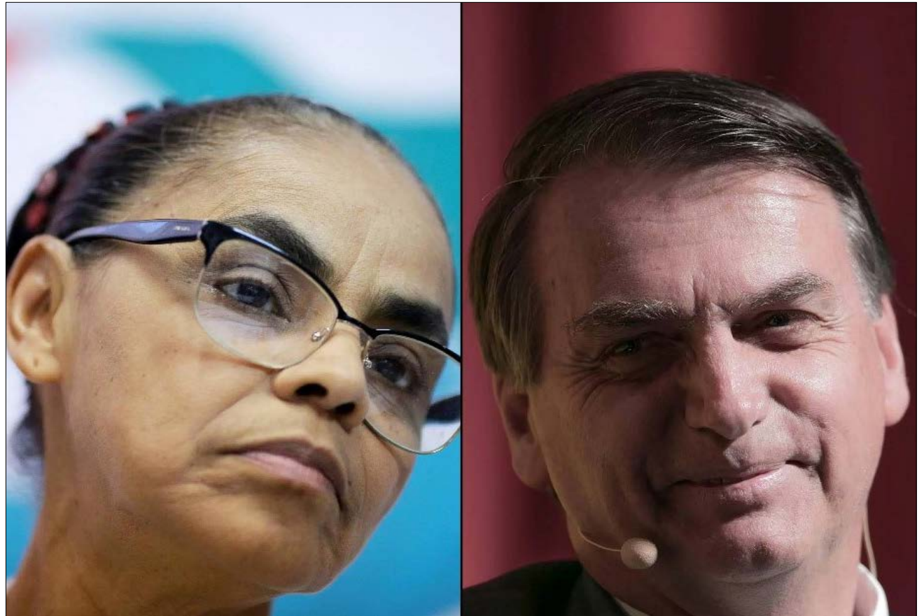
Marina e Bolsonaro

Sem tempo de propaganda eleitoral no rádio e na televisão, sem partidos – fora o seu – que queiram apoiá-la, e com pouco dinheiro para pagar despesas de campanha, a ex-ministra Marina Silva só tem como se eleger presidente da República em outubro próximo se a sua candidatura, apesar de todas as desvantagens, for capaz de unir a maioria da esquerda herbívora.