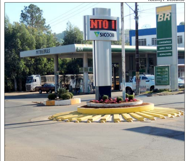
Nova rótula foi utilizada também para o plantio de flores