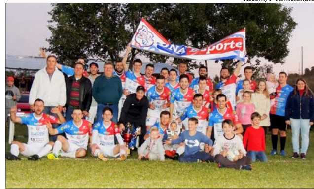
Nos pênaltis, DNA Esporte Independente garantiu o primeiro lugar