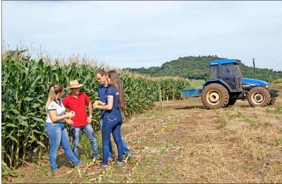
Estudantes desenvolvem atividades práticas e pesquisas na Fazenda Escola

A Unoesc São José do Cedro e a Fazenda Escola estão localizadas na