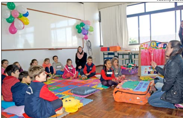
Alunos participaram de contação de histórias

de desenvolver práticas pedagógicas lúdicas, no espaço da brinquedoteca, visando vivências significativas para a construção de saberes,