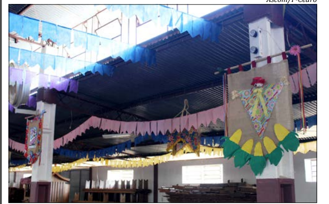
Em São José do Cedro, equipes trabalham na ornamentação da Gruta para o Arraiá

Já em São José do Cedro, uma grande equipe está empenhada na ornamentação da Gruta São Cristóvão, local em que será realizada mais uma edição do Arraiá Cedrense no fim de semana. A programação da festa inicia no sábado, 23, às 13h30, com o Arraiá dos Idosos, às 20h acontecerá a abertura oficial do evento e em seguida o início do Festival da Canção e do Canto Livre Adulto 2018. Às 23h30 terá baile. No domingo, 24, a programação inicia às 13h30, com apresentações artísticas-culturais. Em seguida, acontecerá o Festival da Canção e do Canto Livre Infantojuvenil e após mate-baile.