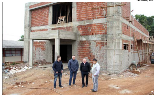
Visitas tiveram o objetivo de acompanhar o andamento das obras

ADR, no Cedup Getúlio Vargas os laboratórios de marcenaria e carpintaria, e de panificação e confeitaria terão área de 150 metros quadrados cada. Já o almoxarifado e lavanderia, uma área de 117 metros quadrados e