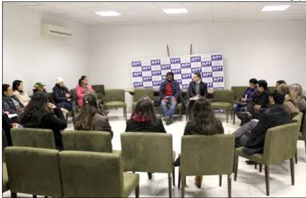
Encontro reuniu Executivo, Legislativo, conselheiros tutelares, integrantes da Pastoral da Criança e representante dos povos indígenas