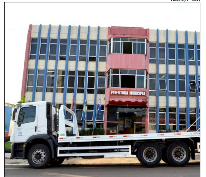
Equipamento vai ajudar no transporte de máquinas de uma comunidade para outra

Ele explica ainda que a iniciativa de adquirir a prancha foi de que o transporte das máquinas se tornasse mais rápido, uma vez que algumas máquinas para sair de comunidades e ir até outras comunidades mais distantes precisam ser transportadas com um veículo adequado.