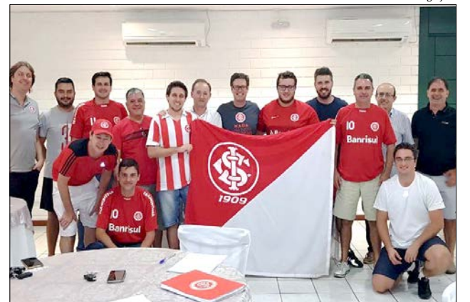
Posse aconteceu em cerimônia no Restaurante Casarão