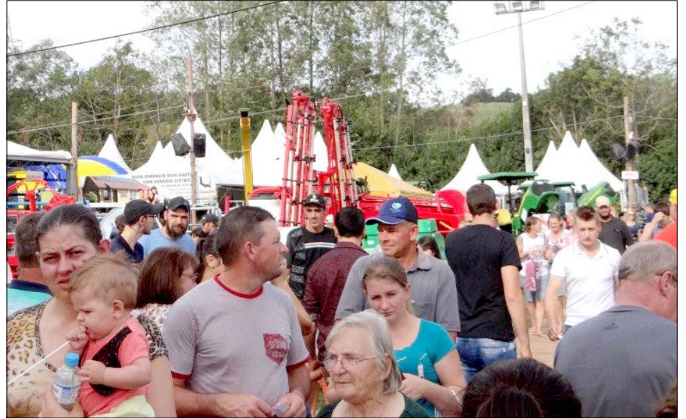
Exposição permaneceu lotado pelo público durante os três dias de evento

A programação iniciou às 19h30 de sexta-feira, 27, no espaço em frente ao ginásio municipal. Muitas autoridades, entre deputados, vereadores, prefeitos da região e secretários de Estado estiveram presente. Às 17 horas aconteceu a reunião dos prefeitos da Ameosc,