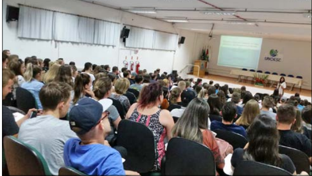
Palestra foi ministrada no auditório da Unoesc São Miguel do Oeste