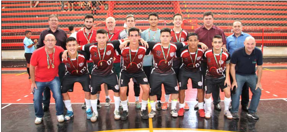
Futsal do Colégio São Miguel foi uma das equipes classificadas

A seletiva/regional, reunindo as regiões de São Miguel do Oeste, Itapiranga e Dionísio Cerqueira, está marcada para os dias 29 e 30 de maio, em Iporã do Oeste.