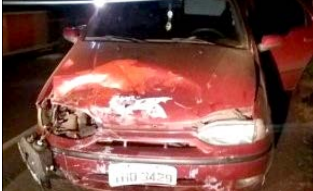
Siena ficou bastante danificado no acidente