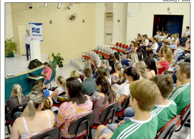
A Conferência tem o objetivo de proceder as atualizações necessárias para a elaboração da política nacional de educação