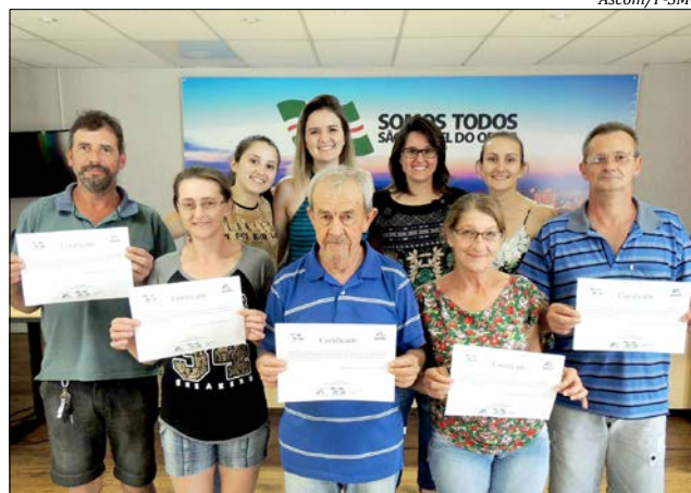
Nos encontros, são repassadas orientações e realizadas atividades pelos profissionais

Nos encontros, são repassadas orientações e realizadas atividades pelos profissionais conforme a área que atuam. Há ainda, um acompanhamento na evolução dos pacientes que, em sua maioria, são fumantes há muitos anos, a exemplo de um paciente que iniciou aos 9 anos e, hoje, com toda força de vontade, parou aos 72 anos. O envolvimento da família tem sido muito importante, pois segundo a nutricionista Sofie Bohrz, os familiares também participam através de mensa-