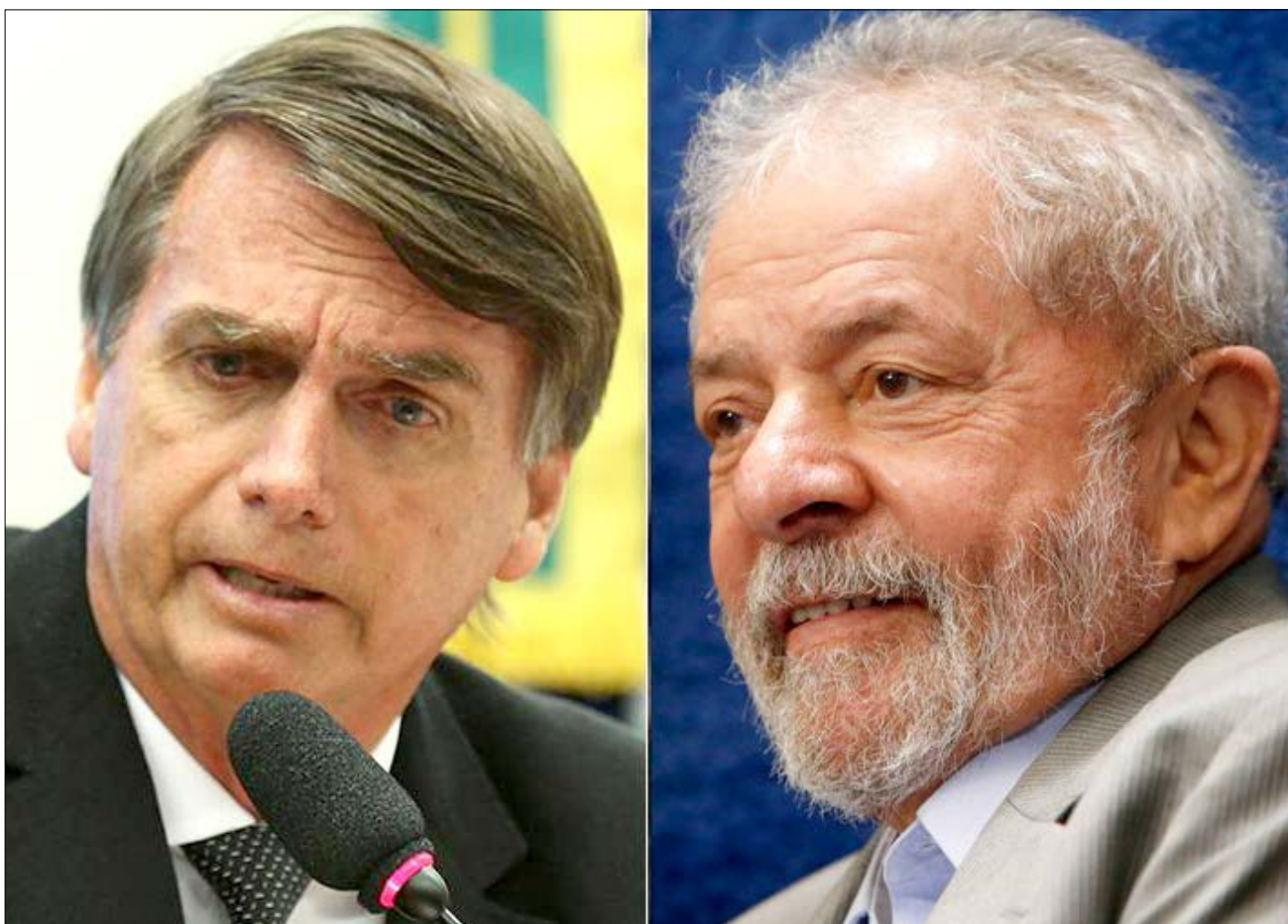
Jair Bolsonaro (PSC-RJ) e Luiz Inácio Lula da Silva (PT)

Chama-se “Jair Bolsonaro” a nova carta na manga do PT para convencer o Supremo Tribunal Federal a soltar o ex-presidente Lula da Silva. Pela lógica do partido, a impossibilidade de Lula disputar a eleição ou de, livremente, fazer campanha para algum outro petista pode abrir caminho para a vitória de Bolsonaro, que aparece em segundo lugar nas pesquisas de intenção de voto para presidente. Assim, o Supremo prestaria um serviço ao País se levasse esse cenário em conta nas próximas oportunidades em que for analisar casos que podem, direta ou indiretamente, beneficiar o ex-presidente.