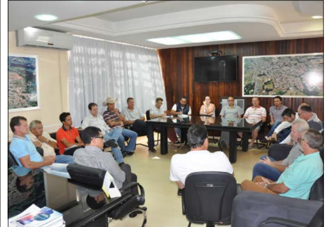
Prefeitos e secretários tomaram conhecimento sobre trabalho executado e decidiram firmar um acordo entre os municípios