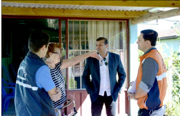
Vereador esteve em visita à residência que corre perigo de desmoronamento