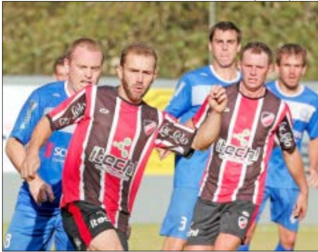
Jornal Força d'Oeste

A grande final será em Linha Pitangueira. O jogo não pode ser realizado no Centro Esportivo, que está recebendo montagem da estrutura para a realização da Efacitus.