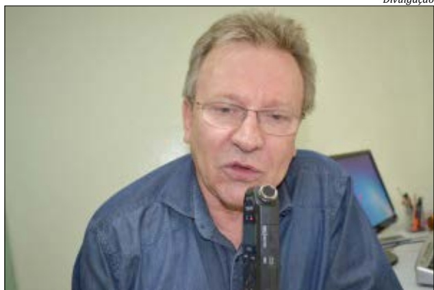
Deputado federal Celso Maldaner