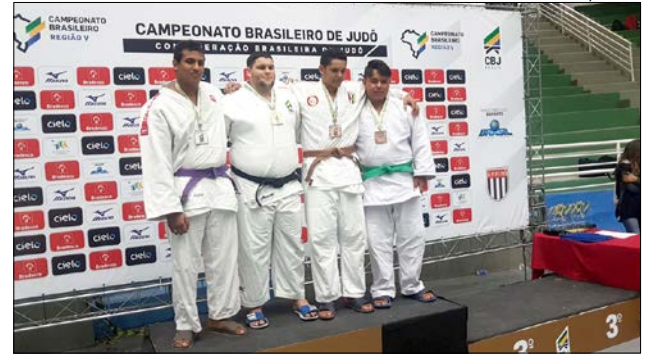
Atletas trouxeram bons resultados na categoria para o município