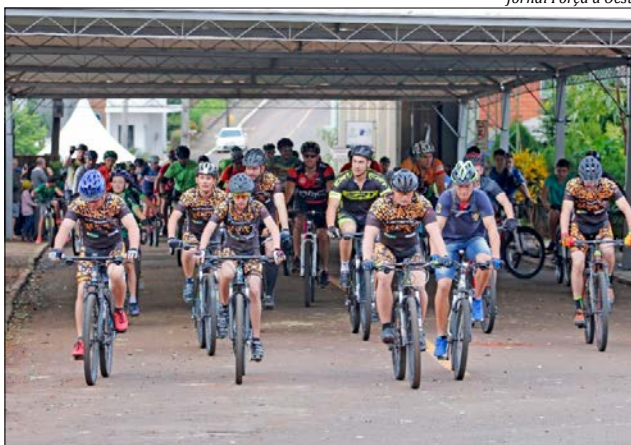
Jornal Força d'Oeste

Após a realização do evento, ciclistas usaram as redes sociais para dividir com amigos e familiares as aventuras e as belas paisagens de Tunápolis. Alguns pegaram chuva, mas trilharam o caminho até o fim. A organização sorteou mais de 20 brindes durante o almoço. Uma medalha de participação foi oferecida para cada participante.