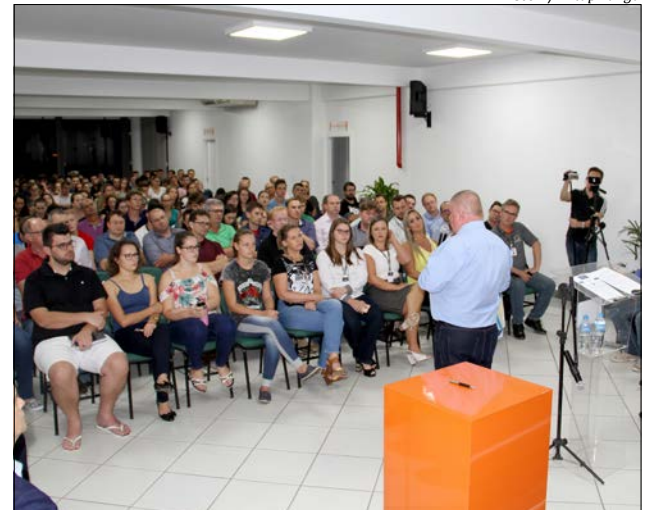
A solenidade foi acompanhada por expressivo número de autoridades, lideranças e acadêmicos