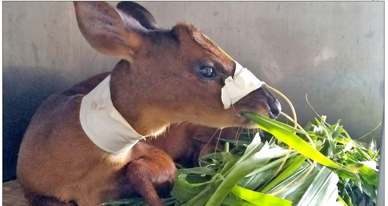
Veado-bororó-do-sul estava desidratado e com dificuldades para locomover-se, devido a uma lesão no membro torácico esquerdo