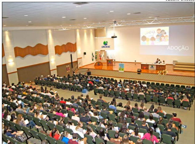
Participaram da palestra acadêmicos de Direito, Psicologia e Pedagogia