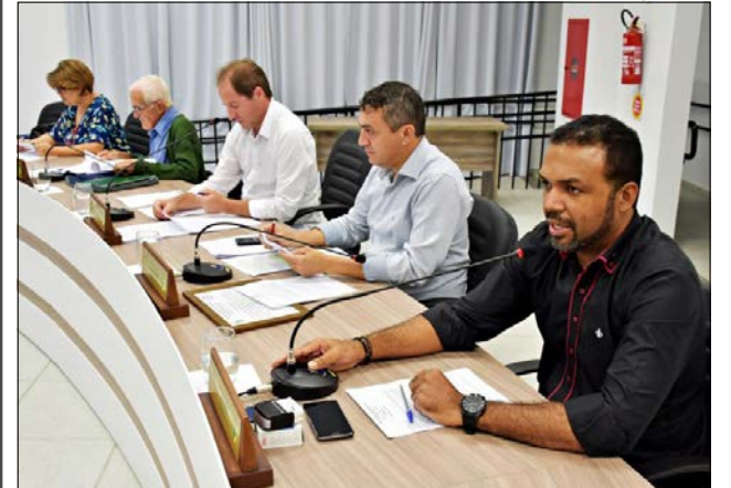
Lei foi aprovada em primeiro turno