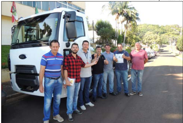
O Ford Cargo foi comprado por R$ 179,5 mil