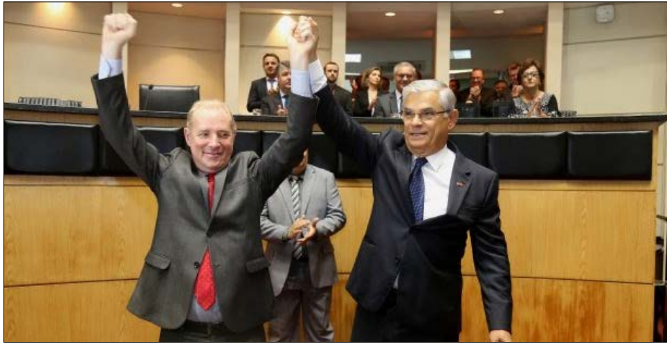
Posse foi realizada em sessão especial da Assembleia Legislativa