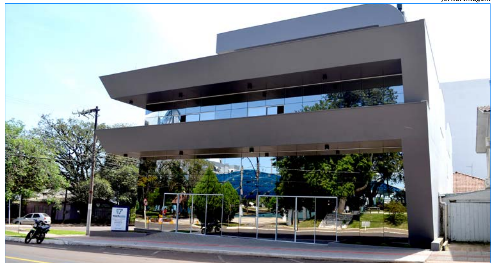
Modernas instalações estão na Rua La Salle, em frente à Praça Walnir Bottaro Daniel