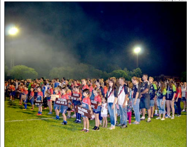
Mais de 1.600 atletas disputam os Jogos Abertos este ano