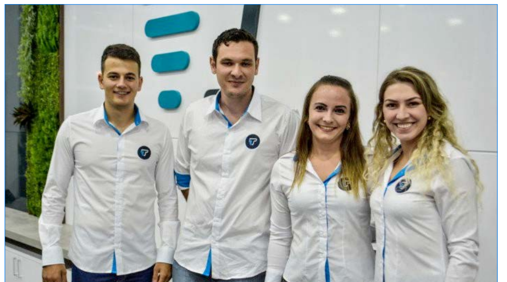
Equipe de atendimento na sede em São Miguel do Oeste

Desde pequeno a gente aprende a palavra compartilhar, aí vem o Sicoob e mostra para nós o que é cooperar.