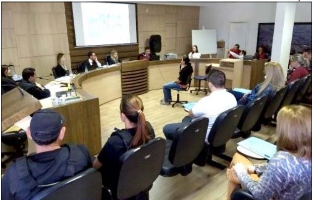
Júri foi realizado durante o dia de sexta-feira, na Câmara de Vereadores