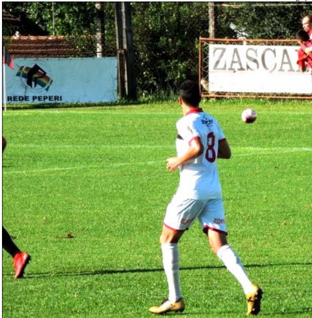
Guarani enfrentou o Aliança em São João do Oeste

Na Categoria sub-18, os finalistas são Aliança e Cometa. O Aliança confirmou a classificação ao golear o Grêmio União de Iporã do Oeste por 4 X 1. Já o Cometa eliminou o Harmonia de Guaraciaba também com uma goleada de 5 X 1. A decisão começa em São João do Oeste e termina em Itapiranga.