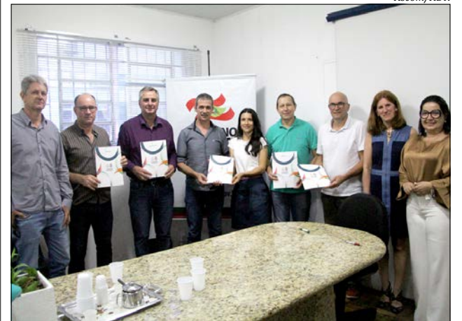
Prefeitos receberam as ordens de serviços em Florianópolis

Os Cras são responsáveis pela organização e pela oferta de serviços da proteção social básica do Sistema Único de Assistência Social (SUAS), nas áreas de vulnerabilidade e risco social dos municípios. O prédio é construído no padrão de 171 metros quadrados e contempla toda a mobília. Todos os equipamentos estão dentro dos padrões exigidos de acessibilidade e espaço físico compatível com o trabalho realizado.