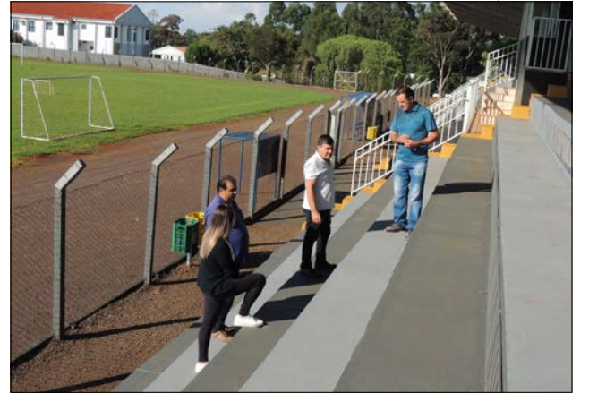
Espaço tem capacidade para receber 2 mil torcedores