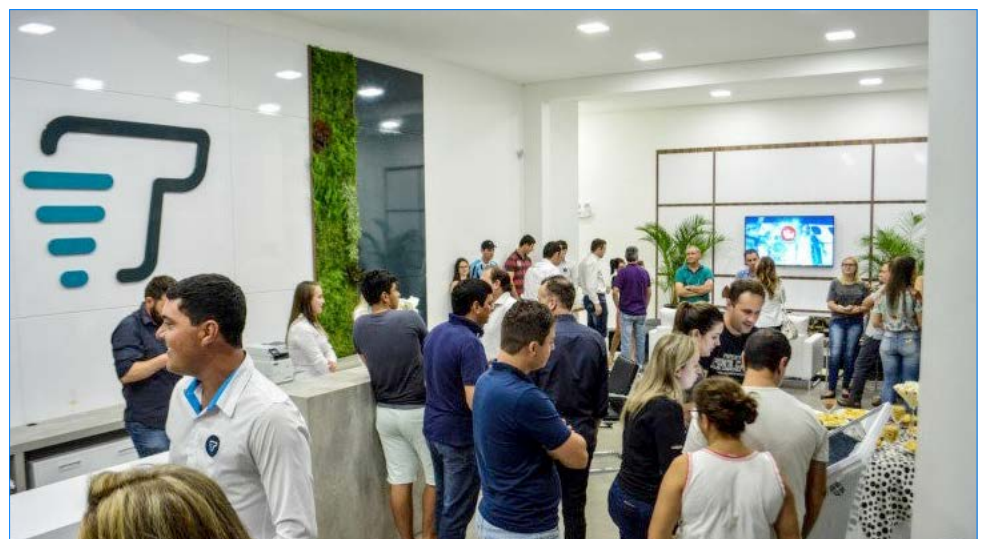
Inauguração contou com a presença de autoridades e convidados