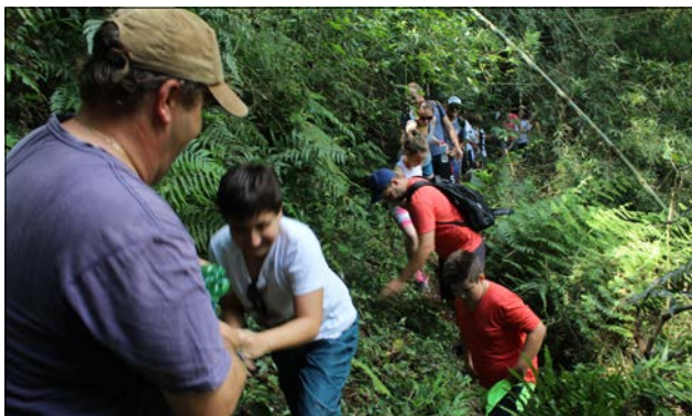
O trajeto envolveu descidas íngremes e obstáculos até a chegada na Cachoeira do Trentin

O trajeto foi um pouco mais difícil para o público no sábado, com descidas íngremes e obstáculos até a chegada na Cachoeira do Trentin, local que impressionou a todos os par-