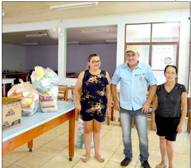
Ao todo 23 grupos que receberam as cestas