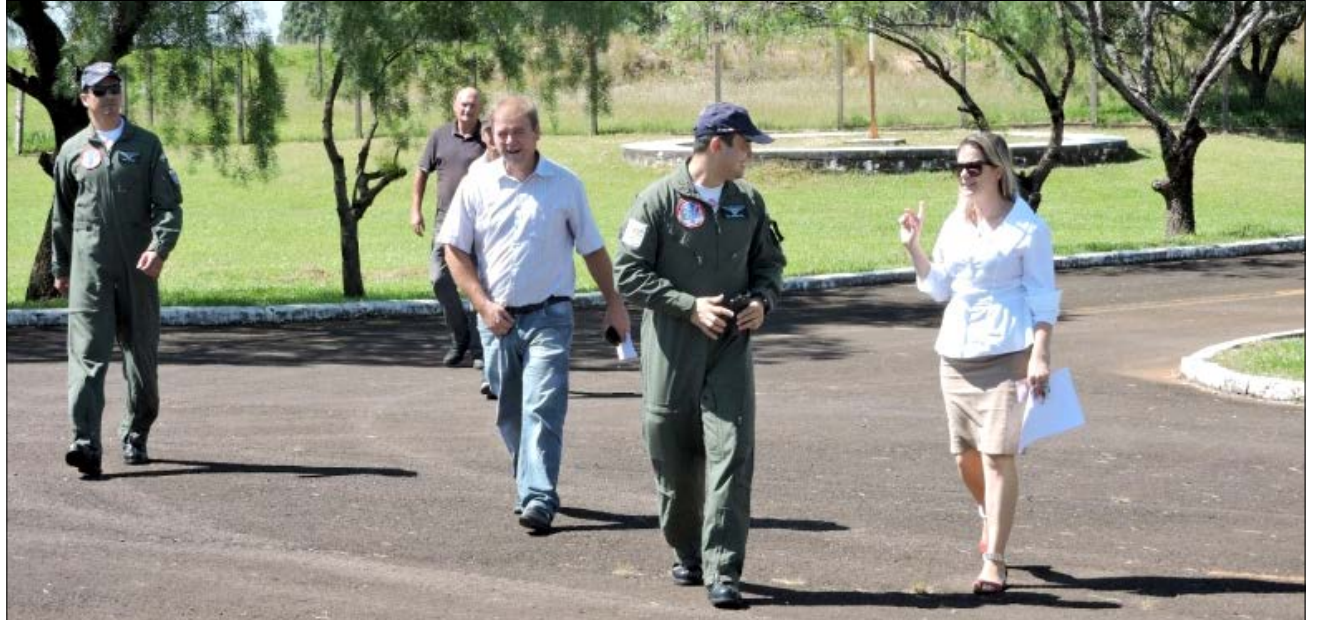
Integrantes da Esquadilha fizeram vistorias em locais da cidade para definir de onde o público vai assistir