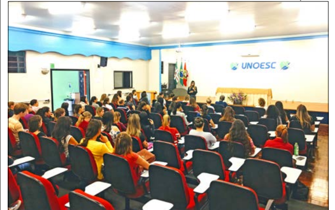
Atividade reuniu estudantes e profissionais no auditório da Unoesc