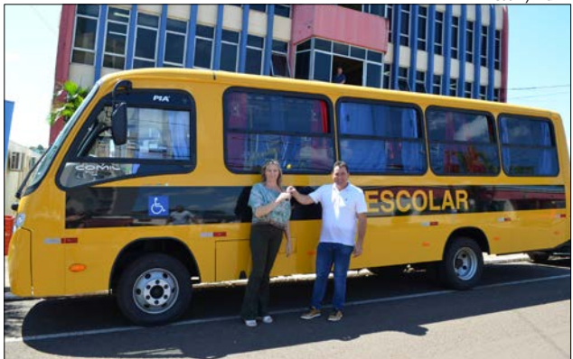
Ônibus será utilizado para o transporte escolar