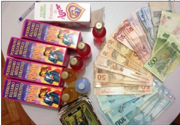
Quando foram presos, eles portavam dinheiro e supostos medicamentos