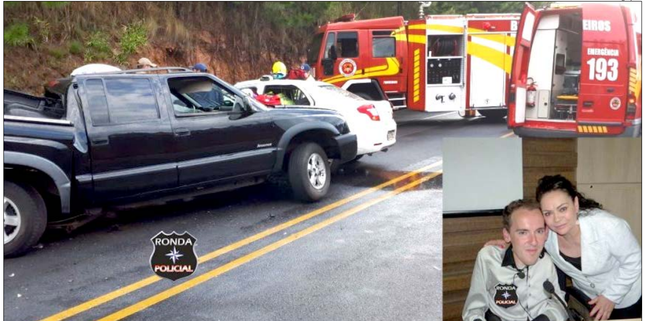
Acidente aconteceu entre os municípios de Faxinal dos Guedes e Vargeão e matou mãe e filho (no detalhe)