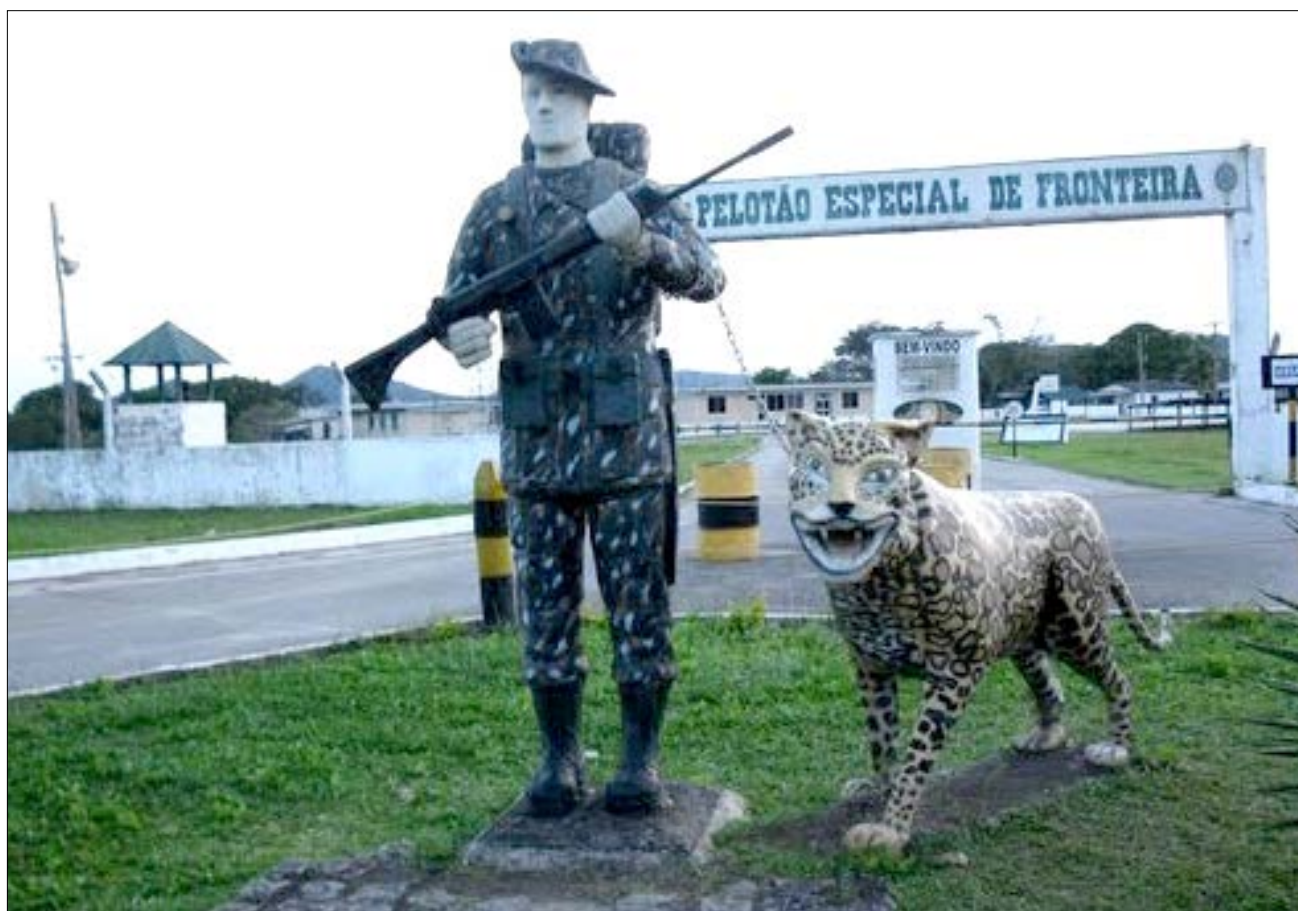
Pacaraima (RR), Portão de entrada dos venezuelanos

Enquanto os militares, que os esquerdistas insistem em chamar de ditadores, viabilizaram o ouro de Serra Pelada, o ferro de Carajás, o manganês da Serra do Navio, a bauxita do Rio Trombetas, o estanho de Rondônia, o petróleo de Manaus, o Porto de Santana, as estradas de ferro do Amapá e de Carajás, rodovias, hidrovias, hidrelétricas, reforma agrária, entre outros, já os "lesa-Pátria", em 36 anos, construíram a hidrelétrica de Belo Monte, não para gerar energia, mas, sim, para roubar.