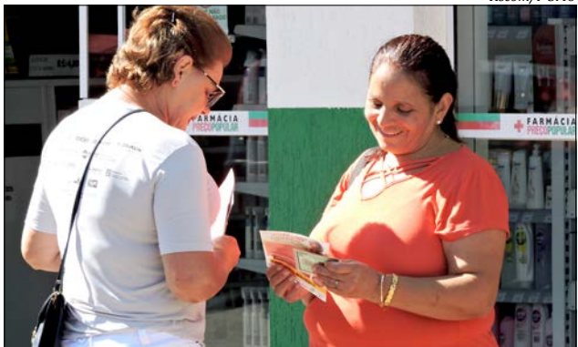
Equipe entregou folder's e adesivos para conscientização do público feminino