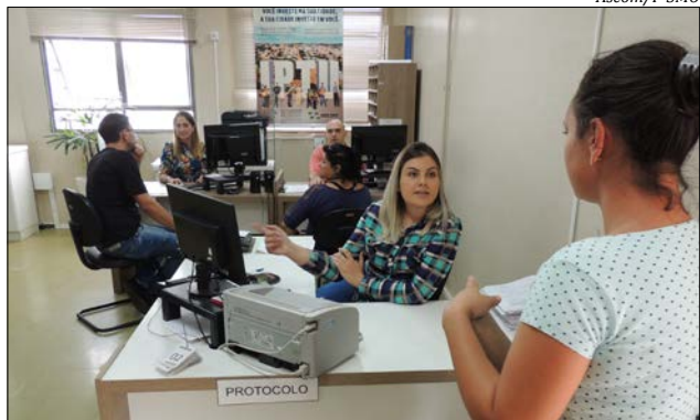
Recepção também estará atendendo o público nas manhãs de sábado