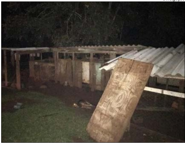
A residência teve mais de 90% destruída pelas chamas