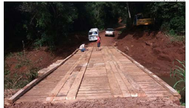
Ponte alta, entre as comunidades de Linha São Jorge e Linha Canaleta, passou por melhorias