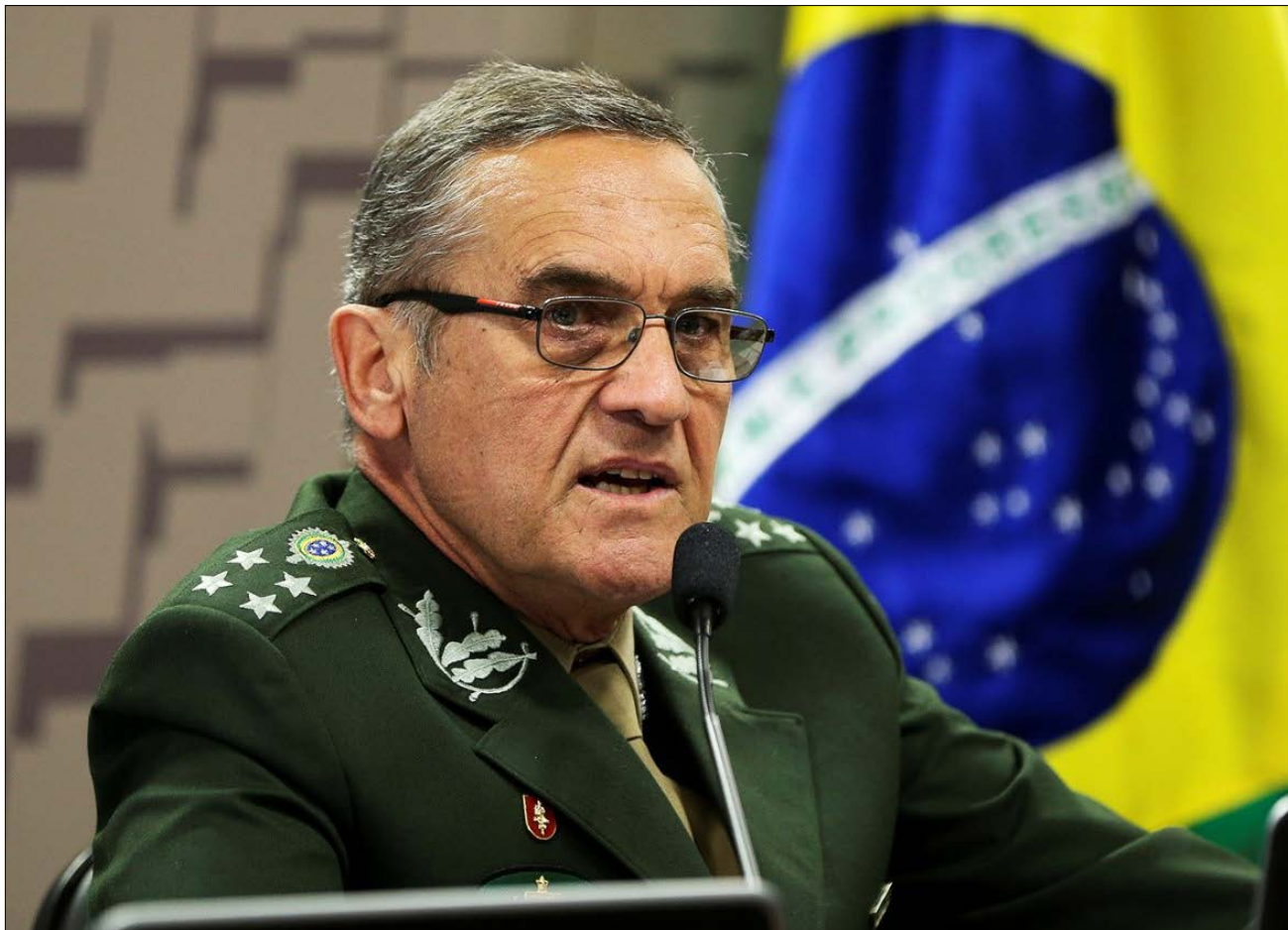
Comandante do Exército, general Eduardo Villas Boas, (Marcelo Camargo/Agência Brasil)

O general escreveu os seguintes comentários: "Na situação em que vive o Brasil, resta perguntar às instituições e ao povo, quem realmente está pensando no bem do país e das gerações futuras e quem está preocupado apenas com interesses pessoais". Continua o general: "Asseguro à Nação que o Exército brasileiro julga compartilhar o anseio de todos os cidadãos de bem em repúdio à impunidade e desrespeito à Constituição, à paz social e à democracia, bem como se mantém atento às missões institucionais".