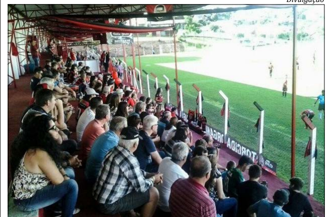
Cerca de 600 pessoas prestigiaram a partida em São Miguel do Oeste

No jogo entre Cometa e Grêmio Tunense, disputado no Estádio da Montanha, em Itapiranga, deu empate em 1 X 1. Geovan marcou para os donos da casa. O gol do Grêmio Tunense foi assinalado por Pipoca.