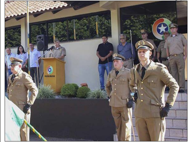
Solenidade aconteceu na manhã de terça-feira