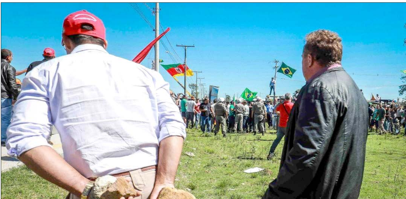
No Rio Grande do Sul, presença de Lula gerou confrontos

Quem pode ofuscar a salutar disputa entre Lula e Bolsonaro, é o TRF 4 de Porto Alegre - RS. Pelo que tudo indica, na próxima semana, o ex-presidente, enquadrado nos rigores da Lei, irá cumprir pena juntamente com seus lacaios. Frustrando milhões de brasileiros e brasileiras. Portanto, a vinda do messias é iminente.