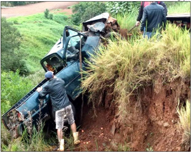
Carro foi abandonado em uma vala à margem da rodovia