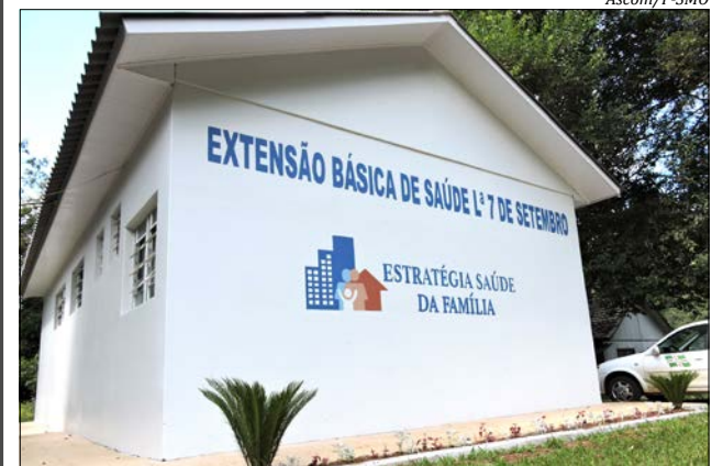
Obras de revitalização iniciaram no ano passado