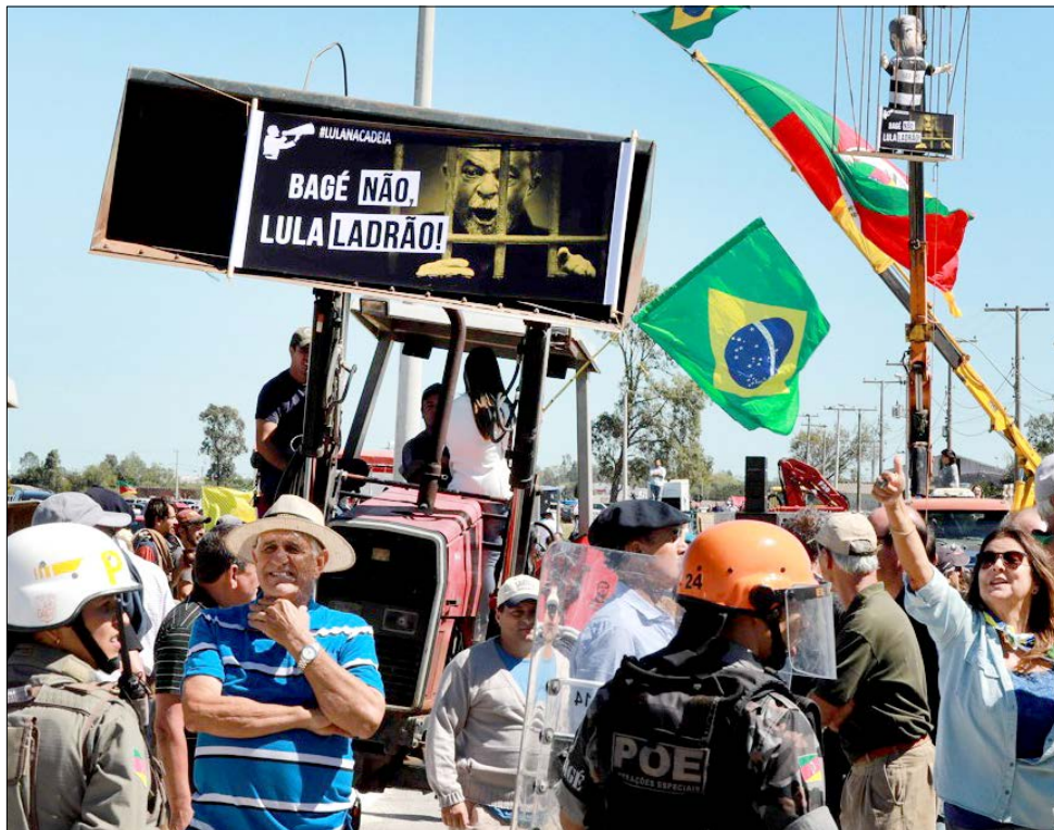
No Rio Grande do Sul, caravana foi marcada por protestos

Além de Luiz Inácio Lula da Silva, é quase certa também a presença da ex-presidente Dilma Rousseff. Grupos contrários à visita organizam manifestações