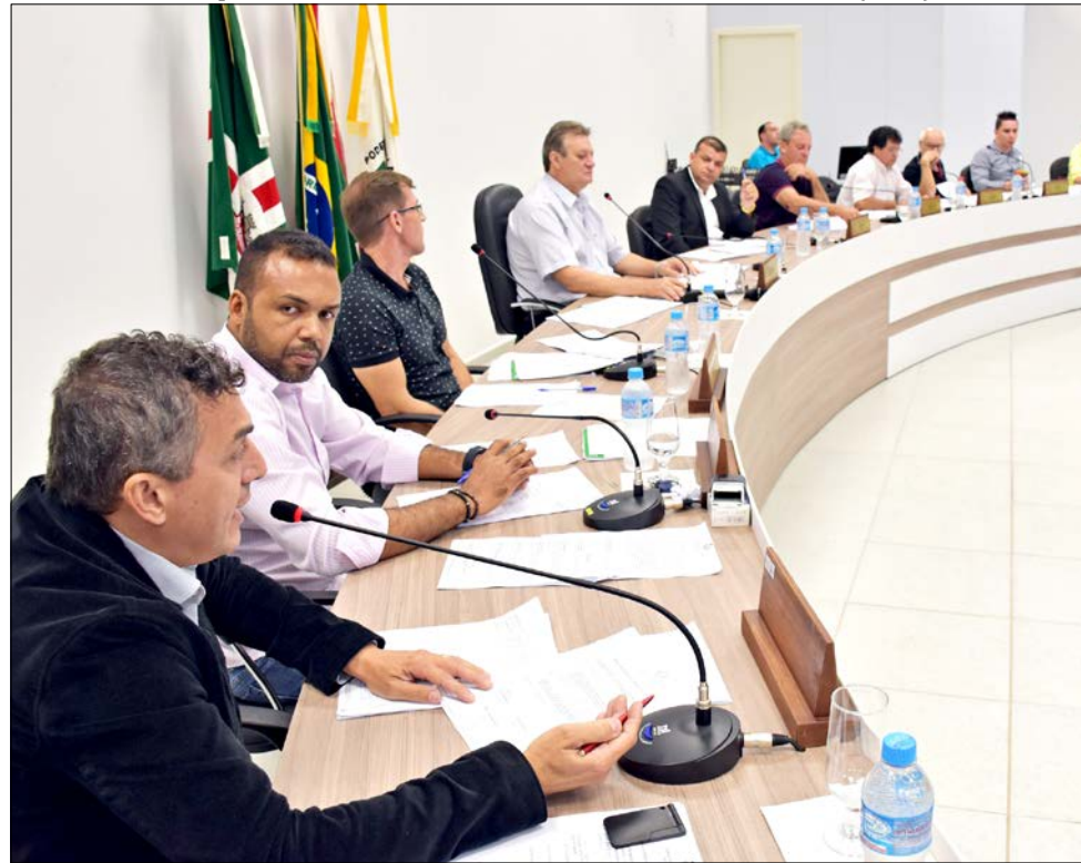
Por um placar apertado, Câmara rejeitou moção de repúdio à visita de Lula