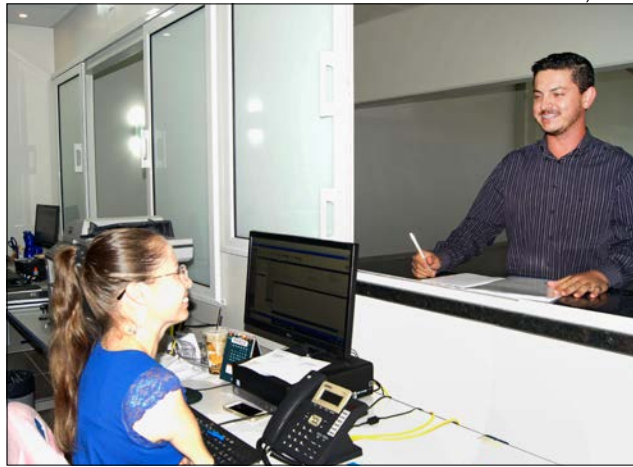
Atendimentos iniciaram nesta semana na Unoesc

Na área do Direito Civil, também atua com direito do consumidor, relações de compra e venda,