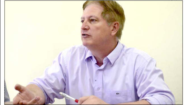
Para Grandó, falta de unidade política enfraquece a região na hora de buscar soluções