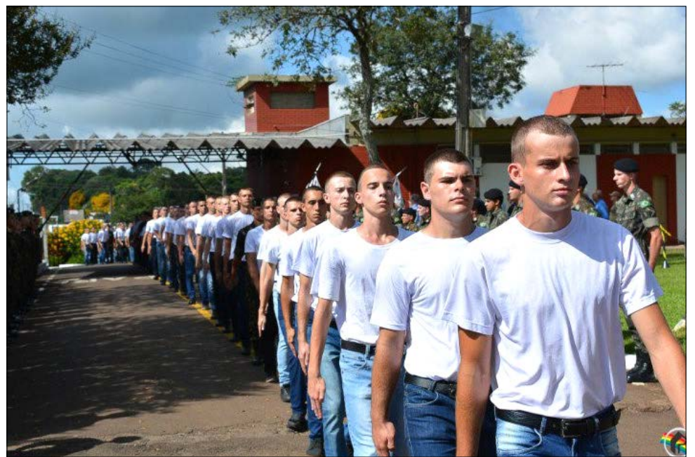
231 novos recrutas foram incorporados ao 14º RCMec