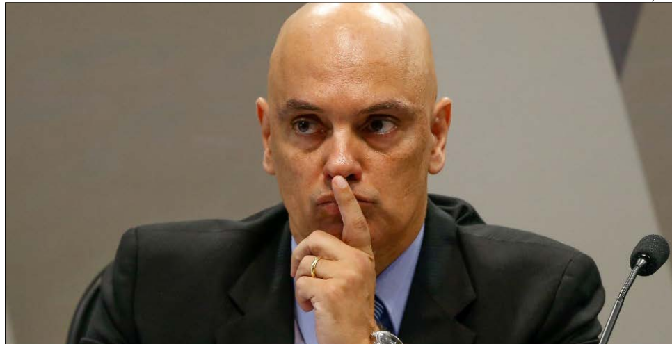
Ministro do STF Alexandre de Moraes

A Lei Estadual Nº 17.115/2017, além de reconhecer a profissão, estabelece condições específicas para seu exercício, como a proibição do transporte de pacientes sem a presença de um médico, de um assistente de enfermagem ou de um enfermeiro. O texto foi integralmente