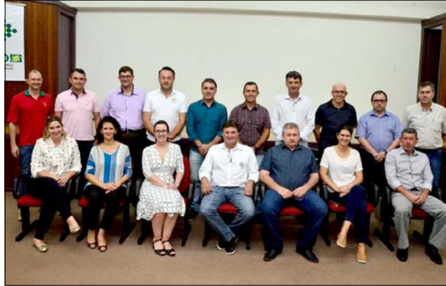
Nova diretoria tomou posse na noite de sexta-feira