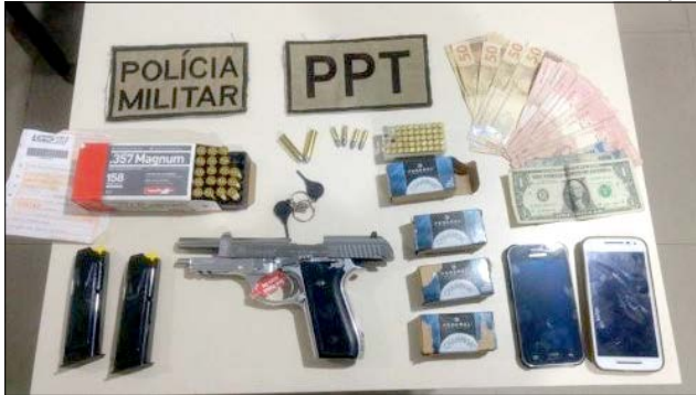
Arma e munições foram apreendidas e, junto com o casal, levadas à Polícia Federal