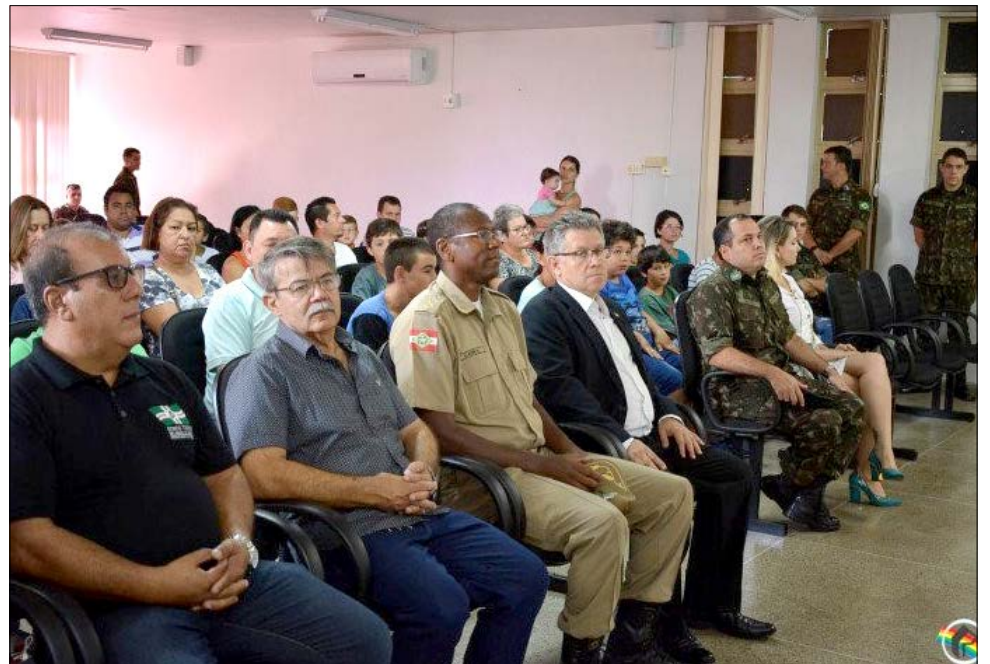
Solenidade contou com a presença de autoridades civis e militares

Nesse período, o jovem inicia a prática controlada de atividades físicas; adquire noções de hierarquia, disciplina e civismo; habitua-se aos horários rígidos e, sobretudo, começa a desenvolver um sadio espírito de camaradagem, essencial ao trabalho em equipe, típico da vida nos quartéis. Ao longo do ano, prosseguem as atividades inerentes a cada Força Singular na prestação do Serviço Militar.