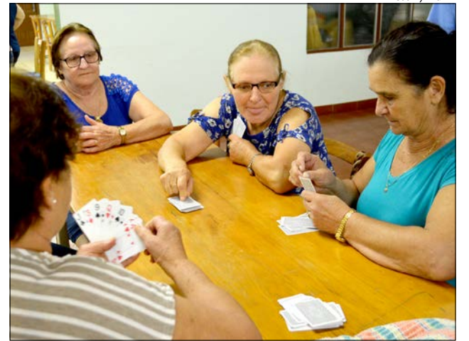
Aproximadamente 150 idosos participaram das atividades