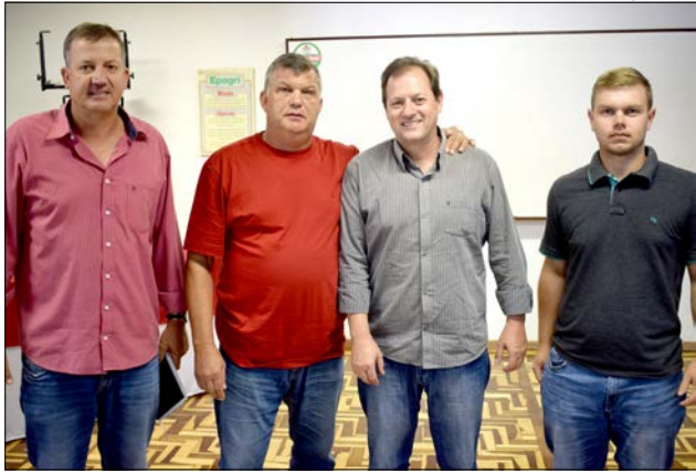
Nova diretoria foi eleita terça-feira