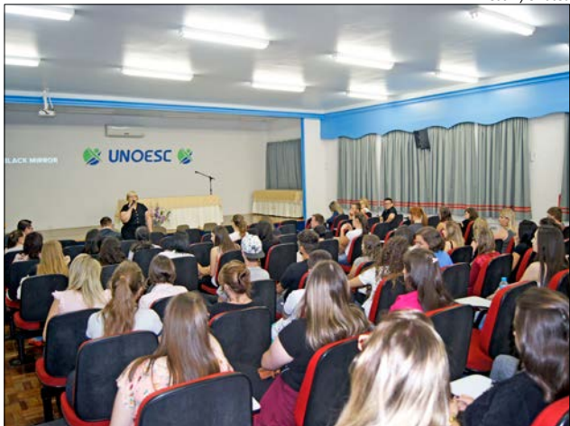
Atividade reuniu professores, acadêmicos e pais no auditório da Unoesc