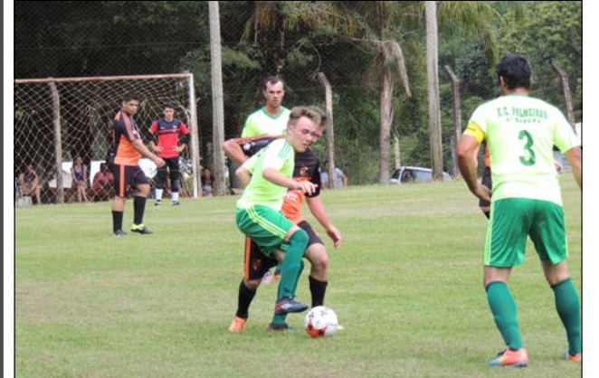
No próximo domingo, jogos acontecem nos campos de Bom Sucesso, Afca e Cachoeirinha