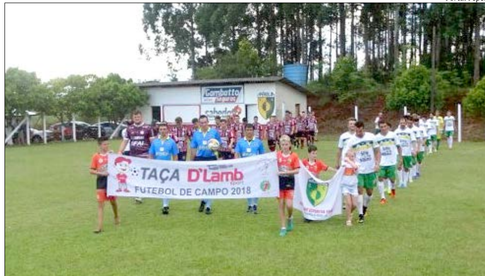
Jogo foi realizado em Linha Pérola, domingo