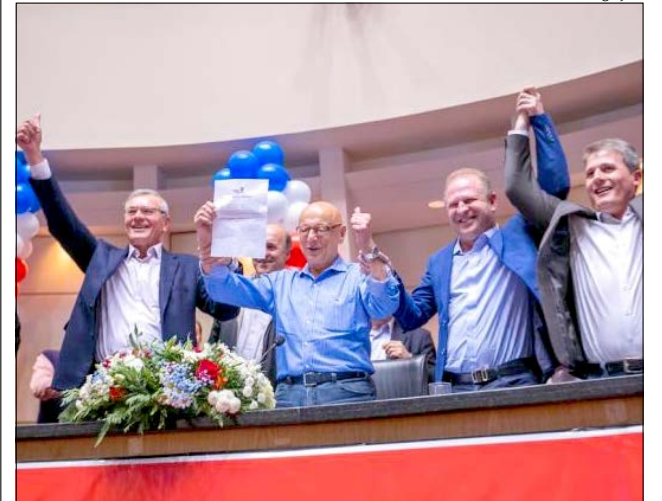
Lançamento aconteceu na sede do PP, em Florianópolis