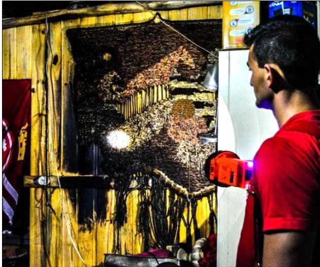
Incêndio começou pela cozinha após válvula do gás apresentar problemas