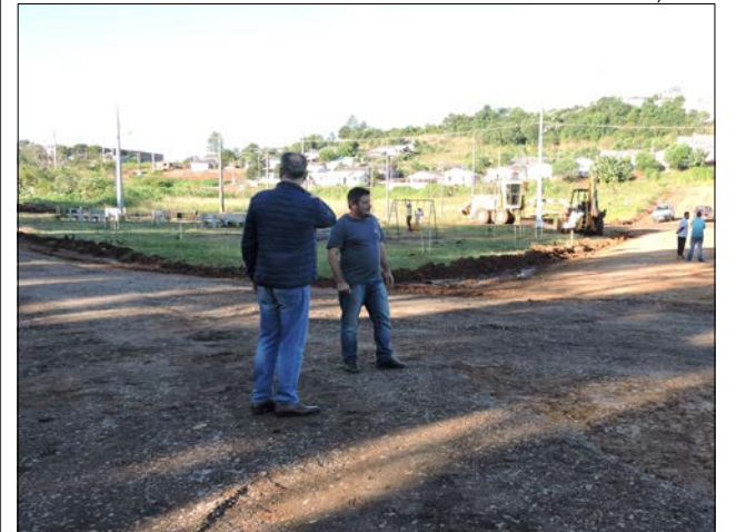
Vila Nova II será um dos núcleos urbanos a receber melhorias