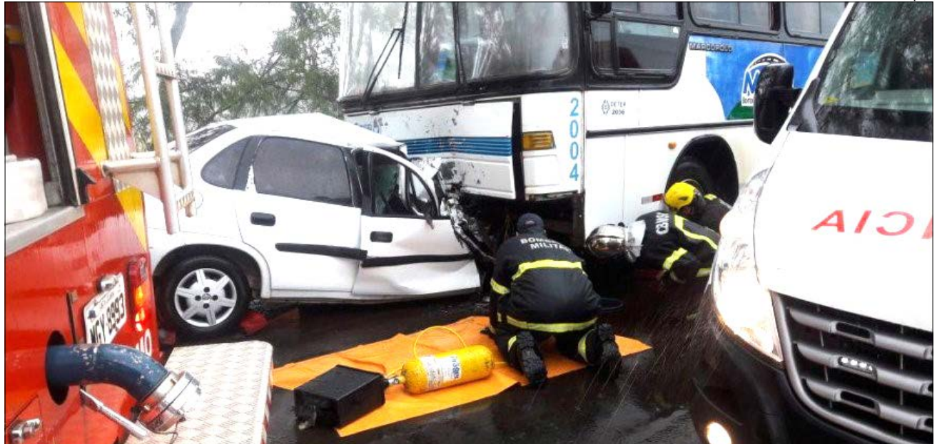
Parte frontal do automóvel praticamente entrou embaixo do ônibus