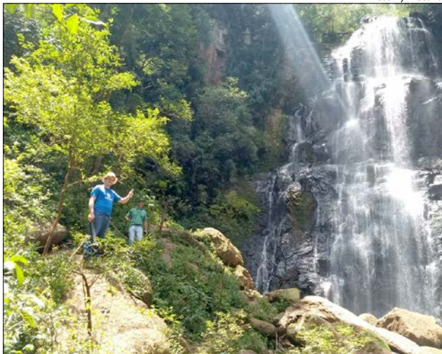
A Caminhada começará na Cachoeira do Trentin e continuará na Sanga do Tatu até o encontro com o Rio das Flores