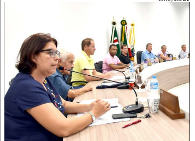
Autores da moção alertam para mudança que prevê necessidade de contribuição dos agricultores com a Previdência