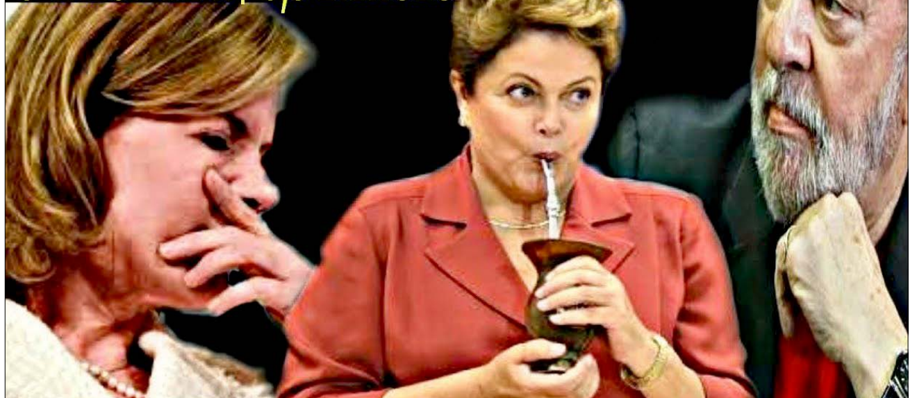
MPF pede perda de bens de Gleisi, Dilma, Lula e resto de quadrilha petista no valor de R$ 6,8 bilhões

Os dois são acusados de receber R$ 1 milhão desviado de contratos da Petrobras para pagar despesas da campanha de Gleisi em 2010. O parecer da Procuradoria Geral da República foi favorável à condenação do casal, e também ao pagamento de multa de R$ 4 milhões. Será o primeiro processo da Lava Jato a ser julgado pelo STF.