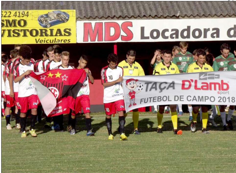
Guarani estreou com vitória na Taça D’Lamb Sport