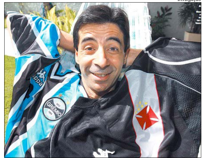
O ex-jogador Mauro Galvão é uma das presenças confirmadas

O valor do ingresso ainda não foi definido. Cogita-se o preço de R$ 20,00 mais um quilo de alimento não perecível. Pontos de venda para ingressos serão divulgados nos próximos dias pela empresa promotora.