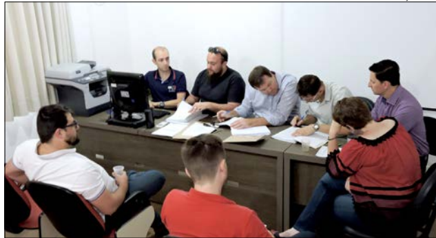
Apenas uma empresa se inscreveu e a abertura da proposta ocorreu quinta-feira