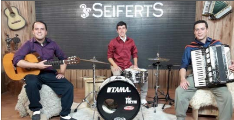
Grupo musical "Seiferts" se apresenta na área coberta da praça na noite desta quinta-feira

Entre os atrativos deste ano estão a realização de passeio ciclístico, festival de vôlei de areia e apresentações das oficinas musicais