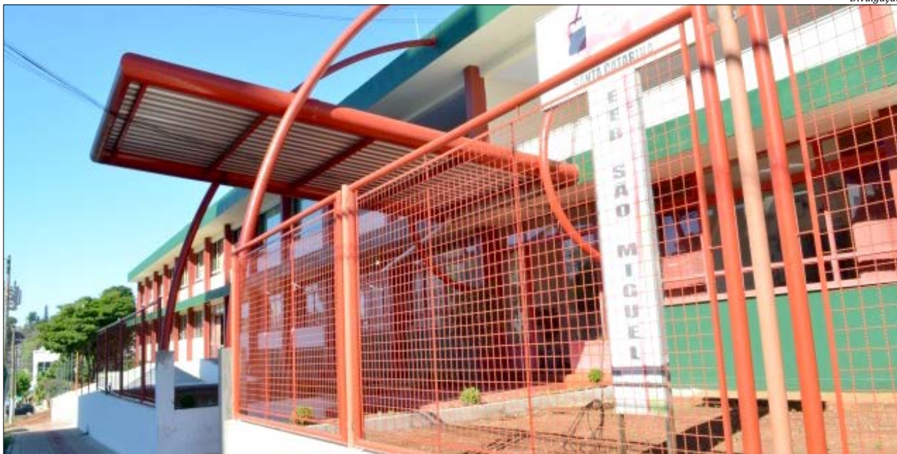
O prazo final da reforma e ampliação é em maio