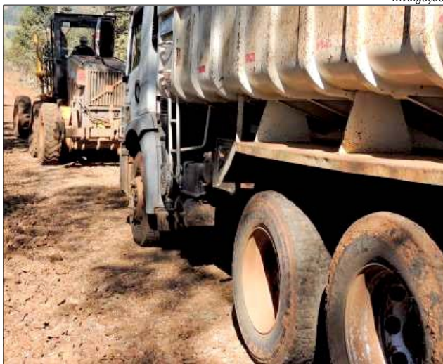
Os estragos foram de grande monta durante os períodos de chuvas