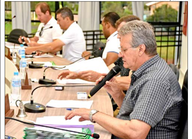
Vereadores aprovaram projeto do Executivo