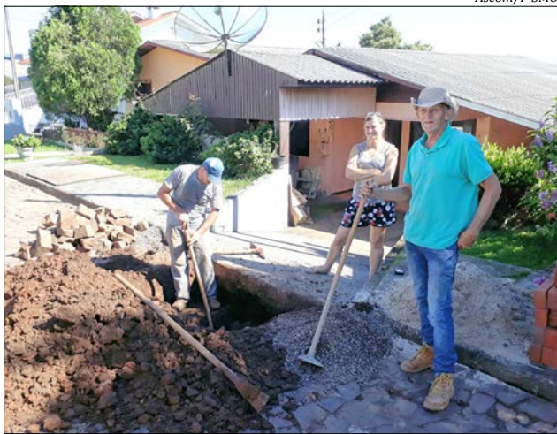
A manutenção dos locais tem sido constante, a fim de evitar alagamentos em dias de chuva