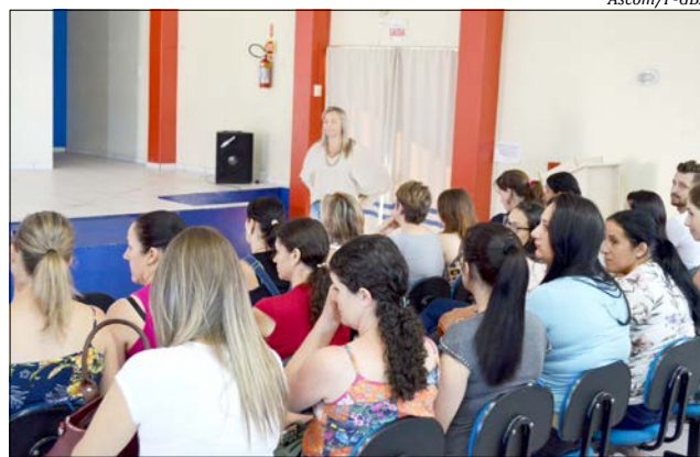
Secretaria da Educação iniciou o planejamento do ano letivo segunda-feira

Durante a semana, os professores continuam as atividades diretamente nas escolas onde irão atuar. As aulas iniciam hoje, quinta-feira, 15, onde cada aluno deverá comparecer no turno matriculado. Para a Creche Professor Aldino Fetter e também a Creche da Escola Municipal Pedro Theobaldo Ritter, ocorre-