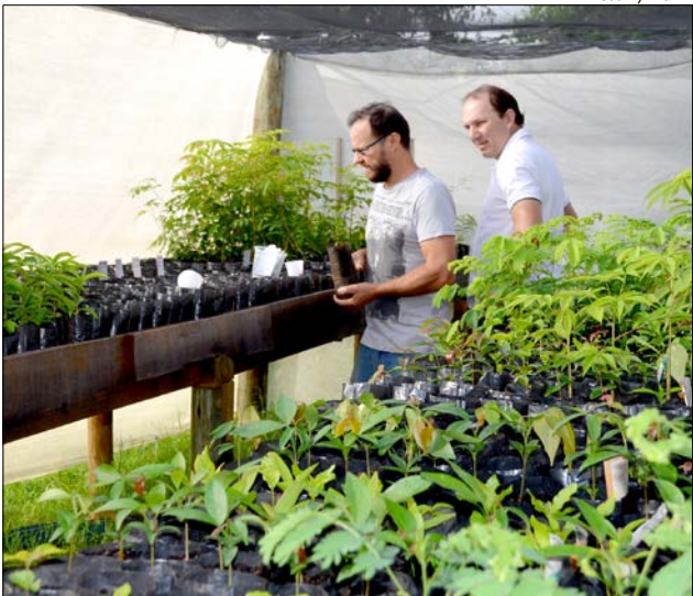
Viveiro Municipal está localizado no Bairro Santa Terezinha