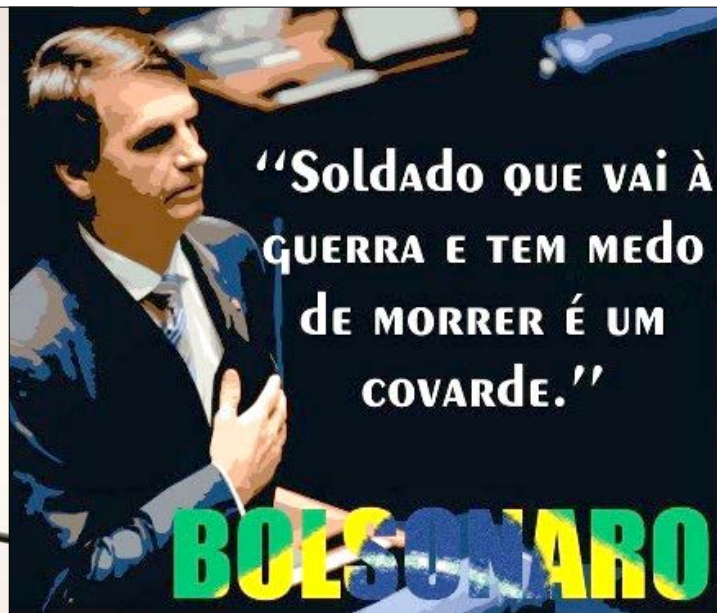
Ministro Marco Aurélio Mello: Prender Lula pode incendiar o Brasil, já o deputado Jair Bolsonaro.....

O bom funcionamento da Justiça não produz mártires. Quando o Poder Judiciário atua de forma isenta, aplicando a lei equanimemente, não há alvoroços políticos e sociais. O resultado, na verdade, é um ambiente de mais segurança, mais serenidade, mais racionalidade; enfim, mais paz. Foi o que se viu após o julgamento da 8.ª Turma do TRF-4.