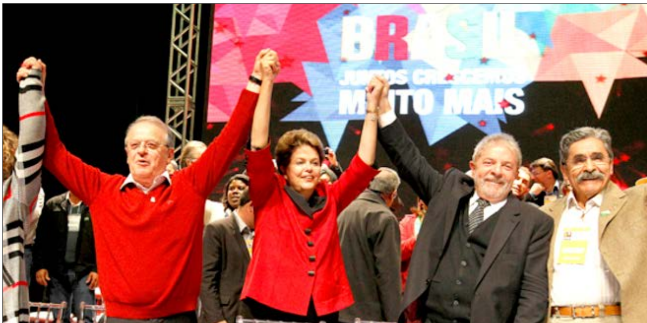
Para os dirigentes cinco estrelas

Enquanto discursa contra a sociedade dividida em classes, o PT confirmou em Porto Alegre que é dividido em duas castas. Uma agrupa os Altos Companheiros, que dirigem o partido e veem Lula de perto. Os dirigidos se acotovelam na Militância e só enxergam o Mestre pendurado em palanques.