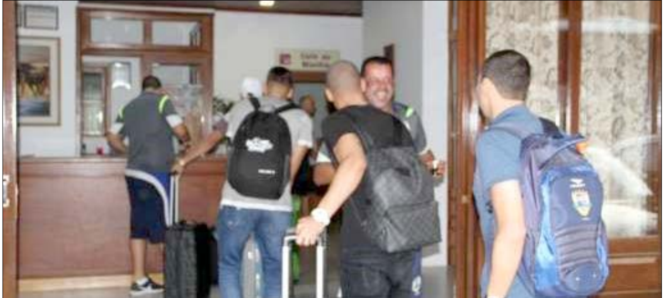
Seleção brasileira chegou à cidade segunda-feira