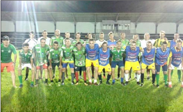
Sociedade Esportiva Pérola enfrenta o Guarani na abertura da primeira fase