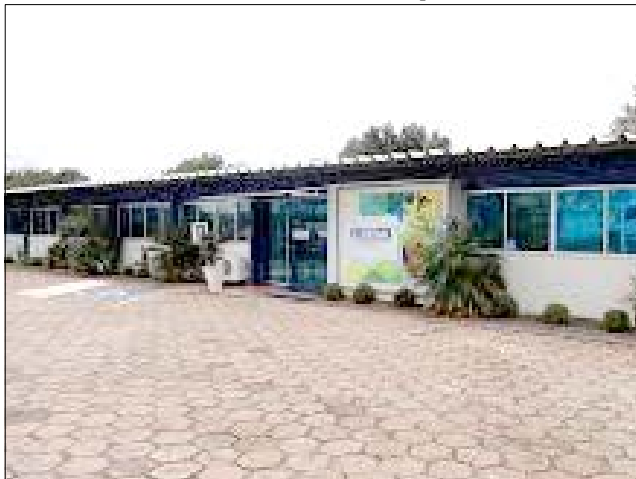
Unidade do Senai em São Miguel do Oeste completa 40 anos

já estava claro que, sem educação profissional de qualidade, o Brasil não teria uma indústria forte e nem alcançaria o desenvolvimento sustentado. O decreto estabelecia que a nova instituição de educação profissional seria mantida com recursos dos empresários e administrada pela Confederação Nacional da Indústria (CNI).