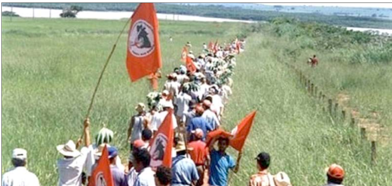
Para os dirigidos, a capoeira

Os que mandam chegaram à capital gaúcha de avião e se hospedaram num hotel cinco estrelas. Os que obedecem viajaram de ônibus, e a maioria passou algumas noites em pensões ou barracas da grife MST.