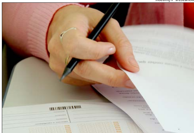
Provas prática e objetiva acontecerão em 17 de março