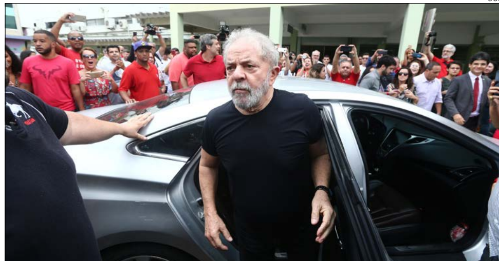
Lula esteve em Porto Alegre na terça-feira durante manifestações, mas retornou a São Paulo antes do julgamento

O ex-presidente é acusado de ter recebido propina da empreiteira OAS