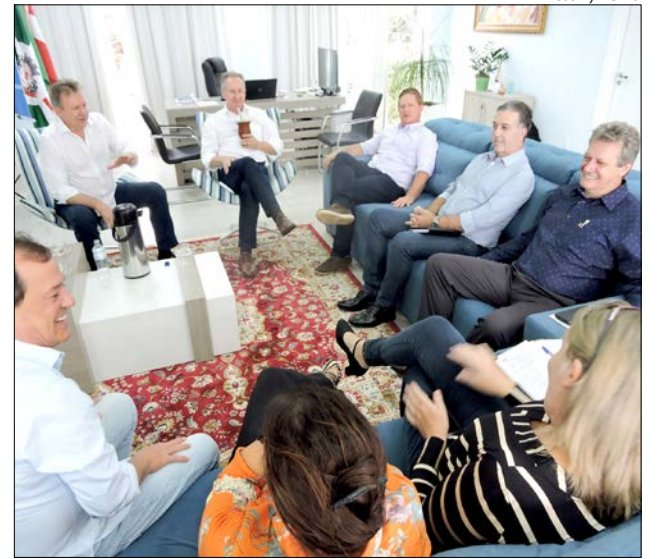
Deputado esteve acompanhado por uma comitiva de emedebistas na visita ao gabinete do prefeito