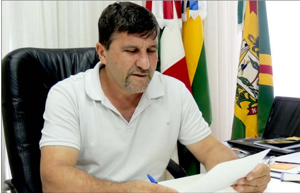
Conforme Bonamigo, aumento fica acima da média feita por municípios da região