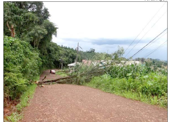
Bombeiros foram acionados para a remoção de árvores derrubadas pelo vento