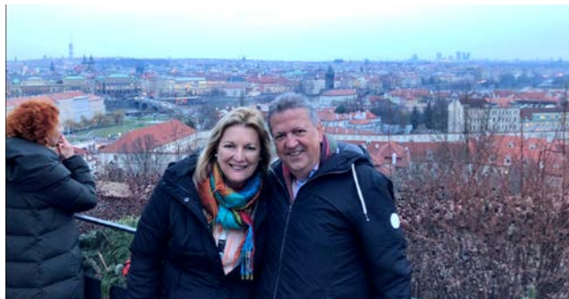
O casal em Budapeste (esta parte da cidade é chamada Buda; a parte baixa é denominada de Peste)

Encerram a viagem em Viena, na Áustria, assistindo a um concerto de ópera.