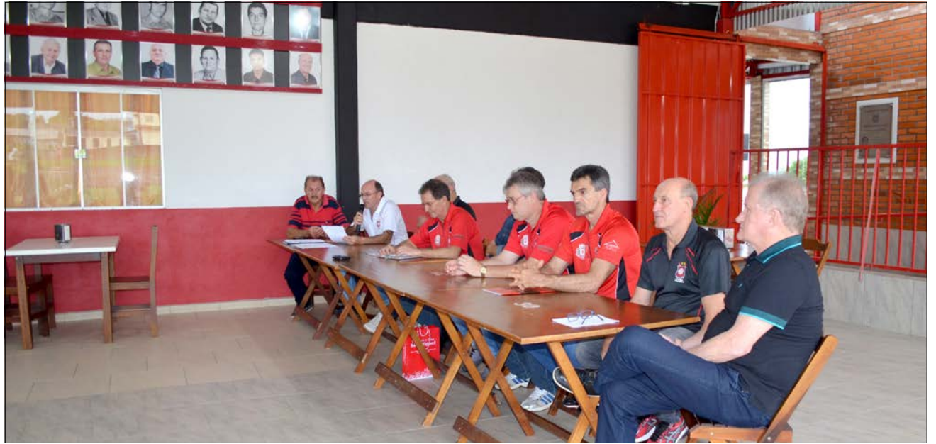
Posse aconteceu na noite de sexta-feira, na sede do clube