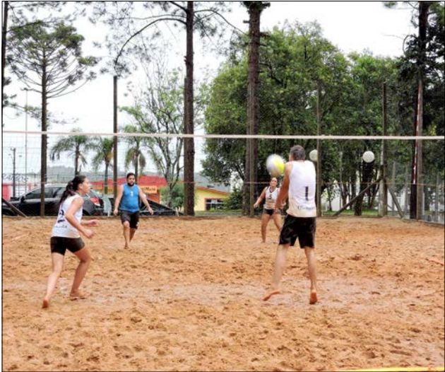
No total, 25 duplas, nos naipes feminino e masculino disputam a competição