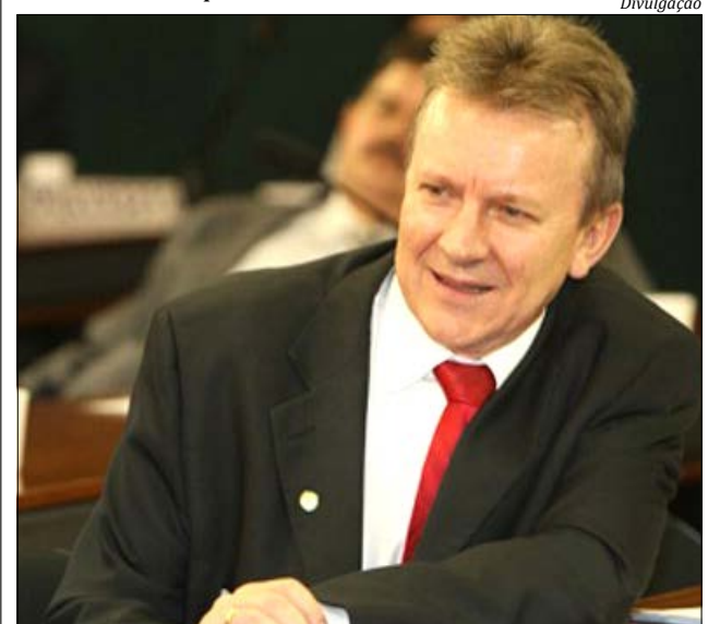
Deputado federal Celso Maldaner

Maldaner também destaca a importância da Reforma Tributária como uma prioridade do governo para 2018. O deputado explica que são em média 153 dias que o brasileiro tem que trabalhar no ano somente para pagar tributos. "Precisamos de uma boa reforma tributária. São 30 anos sem reforma, aonde quem mais paga imposto é o consumidor principalmente o mais pobre, então nós temos que mexer nesta legislação, para fazer mais justiça e cobrar imposto sobre a renda e não sobre o consumo", defendeu o deputado.