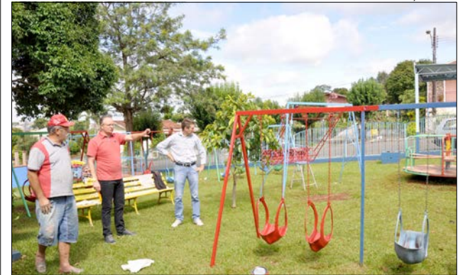
Prefeito em exercício e secretário vistoriaram os estabelecimentos que receberão reformas