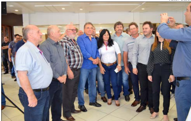
Senador (C) posou para fotos junto a políticos e empresários

R$ 4 mil a quem tem direito em Brasília. Álvaro Dias se posiciona como um político diferente e garante que, se eleito, vai "refundar a República" sem ceder ao "balcão de negócios" entre o Executivo e Legislativo.