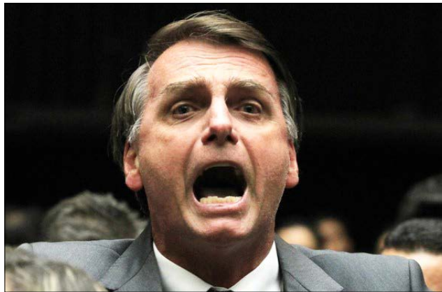
Bolsonaro teve a vida devassada em matérias do Jornal Folha de São Paulo

Na semana passada, a vítima foi o presidenciável e deputado Jair Bolsonaro com uma série de matérias pejorativas no Jornal Folha de São Paulo. Ele divulgou um vídeo quarta-feira, dia 10, com mais de 11 minutos. Somente em sua página no Facebook, alcançou mais de 1,4 milhão de visualizações e 37 mil compartilhamentos.