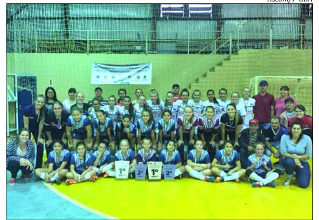
Equipes participam das finais do campeonato regional em São José do Cedro