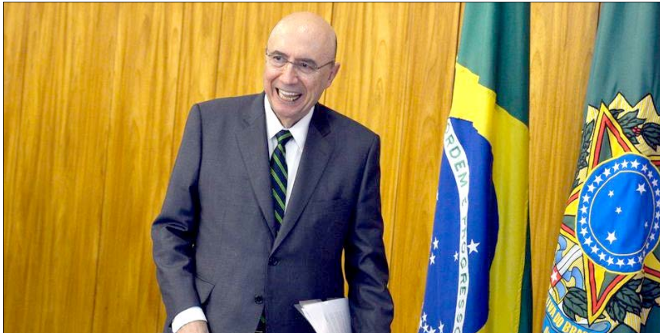
Ministro Henrique Meirelles

O corrente ano ainda não acabou, faltam a reforma da Previdência e a prisão dos corruptos que tomaram de assalto os cofres públicos. Porém, mudanças importantes estão sendo esperadas até o término do conturbado 2017.