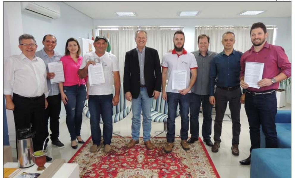
Contratos foram assinados sexta-feira com as empresas que irão se instalar

De acordo com o procurador geral, Nédio de Lima, a área é composta por seis lotes, sendo que os dois restantes também serão licitados, no