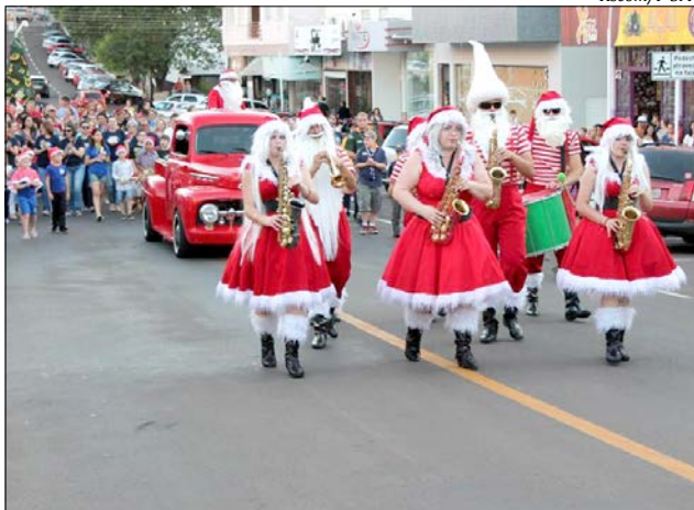
Programação iniciou por volta das 19h30, com o desfile da Charanga do Papai Noel