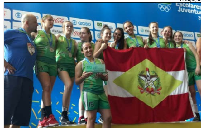
Equipe de São Miguel do Oeste disputou a final com equipe paulista

Após um primeiro quarto ruim, onde o time de São Paulo abriu 10 pontos de vantagem, o Colégio La Salle Peperi equilibrou as forças nos quartos seguintes, porém, insuficientes para reverter a vantagem. O resultado final da decisão foi