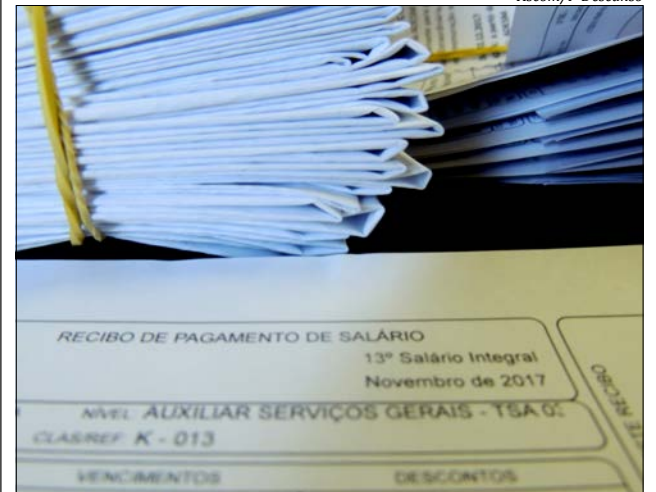
Valores serão depositados na conta bancária de cada funcionário junto com o vencimento deste mês

A Santapedra convida você para conhecer o carro mais surpreendente da categoria.