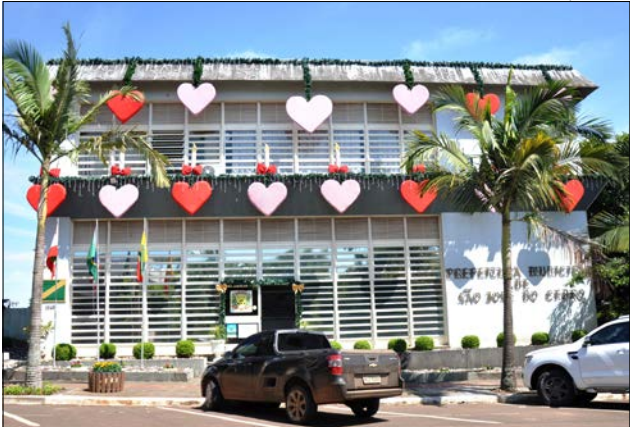
Trabalhos foram intensificados nos últimos dias