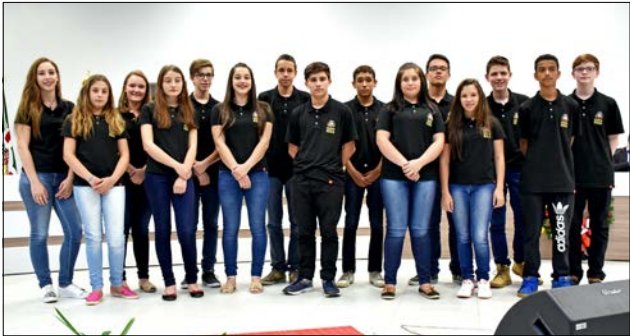
Vereadores mirins foram diplomados segunda-feira

Vendo apartamento pela metade do preço. Fone: (49) 9 8427-4926