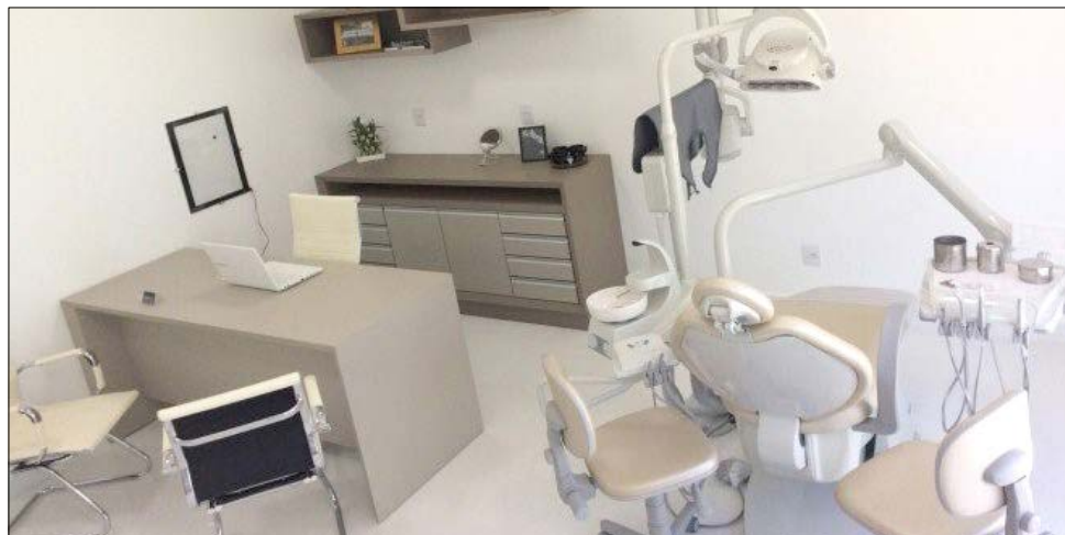
Os tratamentos oferecidos pelo consultório contam com avançadas tecnologias na área odontológica

cidos pelo consultório contam com avançadas tecnologias da área e oferece variados procedimentos, como laminados cerâmicos, restaurações, facetas em resina composta, endodontia, prótese, clareamentos, implantes, exodontia, toxina botulínica, preenchimento com ácido hialurônico, bichectomia e lipopapada.