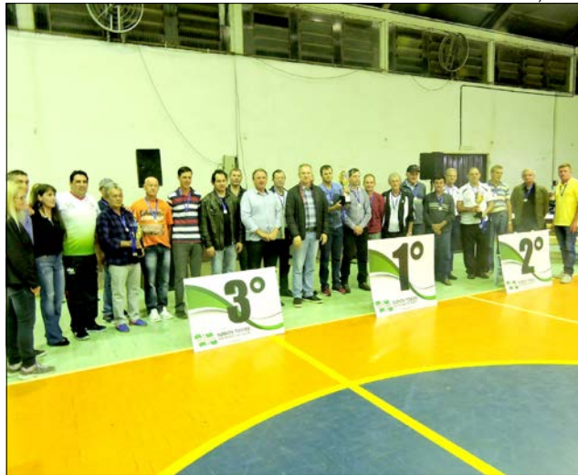
Premiações foram entregues sábado, no Bairro São Gotardo

Barra do Guamerim 2º Lugar: Adefismo 3º Lugar: Santa Rita