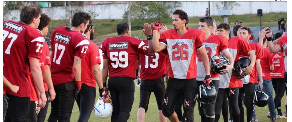
Mesmo faltando um jogo, a equipe de São Miguel do Oeste já está na final