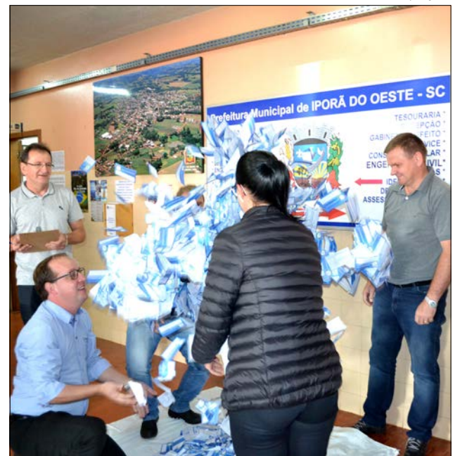
Primeiro sorteio foi realizado segunda-feira