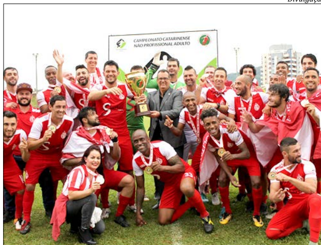
Metropolitano levantou a taça ao vencer o Clube Atlético Carlos Renaux

A final foi no Estádio Olímpico, do América FC, em Joinville. Os três gols da partida foram marcados no 1º tempo. Este foi o bi-campeonato do Metropolitano. O Oeste foi representado na competição pelo Esporte Clube Cometa, de Itapiranga, que na semifinal foi eliminada pelo Metropolitano, nos pênaltis, por 3 X 2, após empate em 0 X 0 no tempo regulamentar.