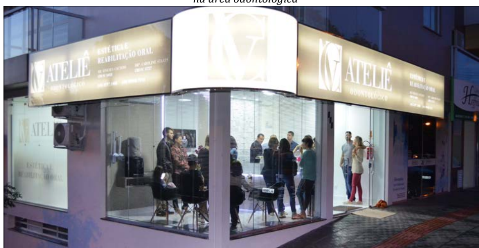
O Ateliê Odontológico está localizado na rua Marquês do Herval, 834, no centro da cidade