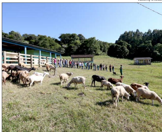
Projeto será desenvolvido em propriedades da região