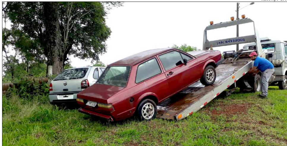
Pelo menos dois veículos já foram removidos na semana passada

“Após a constatação de abandono feita pelos fiscais, esgotamos todas as possibilidades para que os proprietários removesses estes