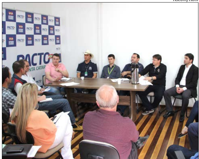
Na oportunidade, inúmeros assuntos, dados e informações acerca de ações e demandas regionais foram discutidas