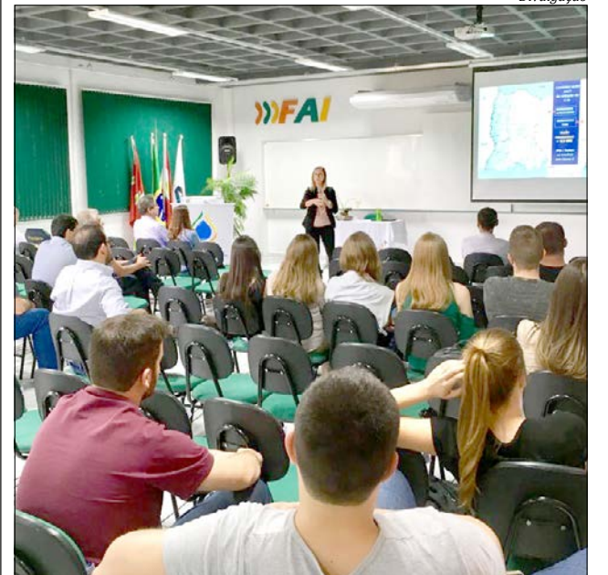
Audiências foram realizadas nas cidades de São Miguel do Oeste, Itapiranga Palma Sola e Maravilha