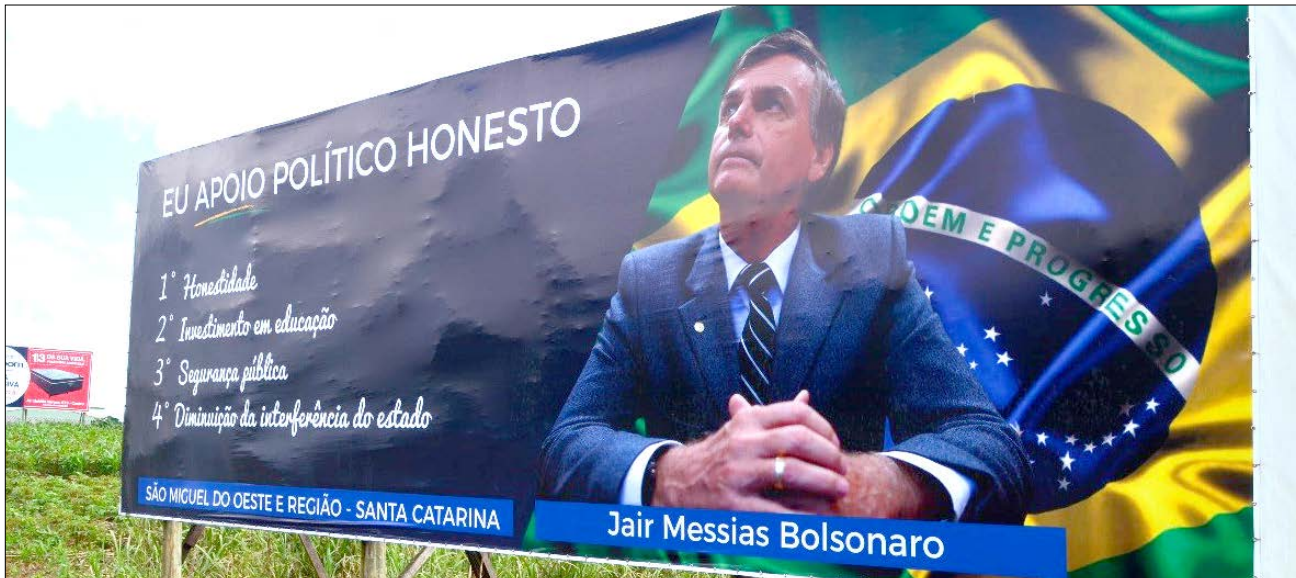
Por iniciativa própria, o eleitorado jovem de São Miguel do Oeste, colocou uma placa às margens da BR 163, ressaltando a honestidade do pré-candidato.

Os jovens da classe média e os veteranos conservadores também, já optaram e não "optaram", pelo nome do novo presidente da República a ser escolhido no ano vindouro.