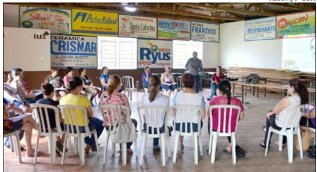
O objetivo é auxiliar as pessoas na mudança de hábitos inadequados