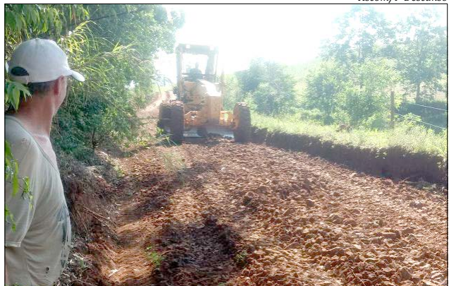
Preocupação é com o escoamento da produtividade que inicia em janeiro próximo