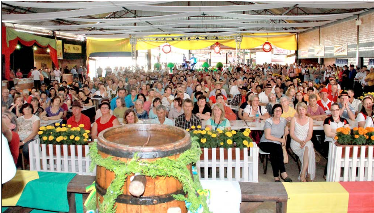
Público compareceu em massa à abertura oficial da festa