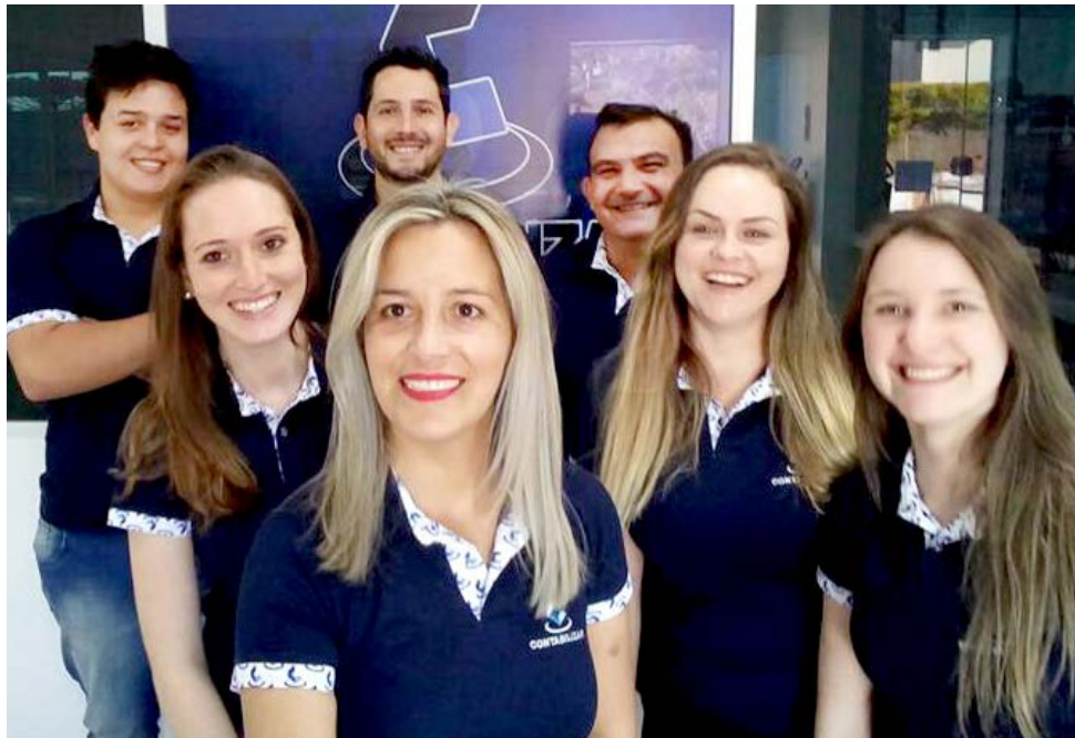
Equipe especializada pronta para bem atender

A CONTABILIZAR - Assessoria e Consultoria Empresarial Ltda ME , desde 2014 atuando no mercado contábil em São Miguel do Oeste, inaugurou no dia 15 de setembro a sua nova sede, em um espaço amplo e confortável, visando bem atender sua vasta clientela. A inauguração aconteceu com a presença de clientes, amigos e colaboradores.