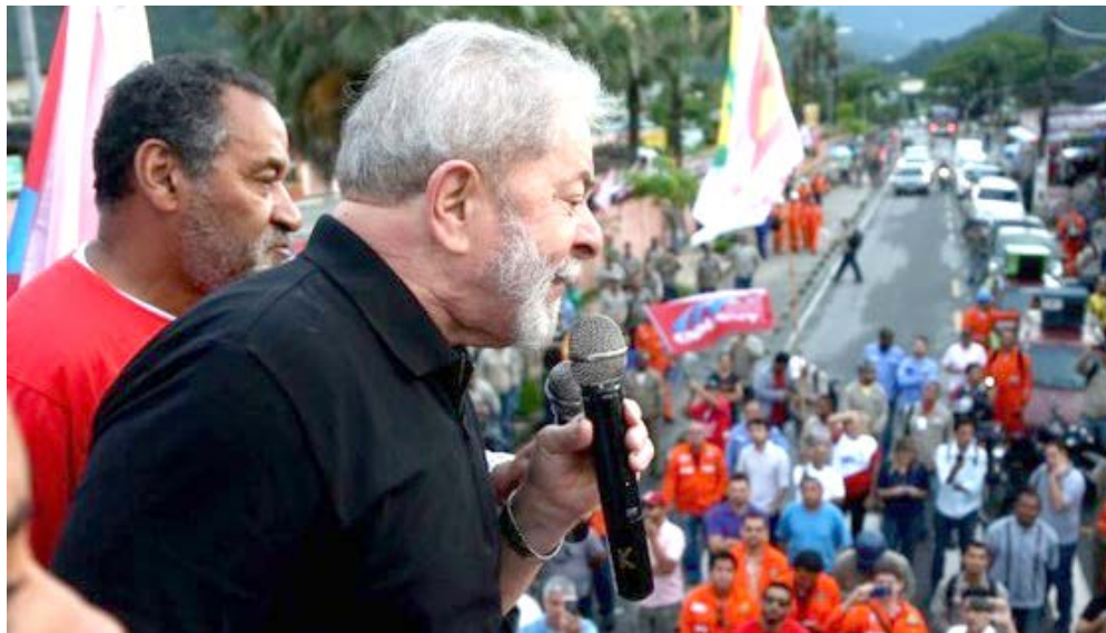
Lula no ato em defesa da indústria naval em Angra dos Reis, no Rio de Janeiro. O local estava vazio.

Considerando que o seu principal adversário está em queda livre, tanto nos tribunais quanto nos movimentos das ruas, a vinda do Messias, é iminente.