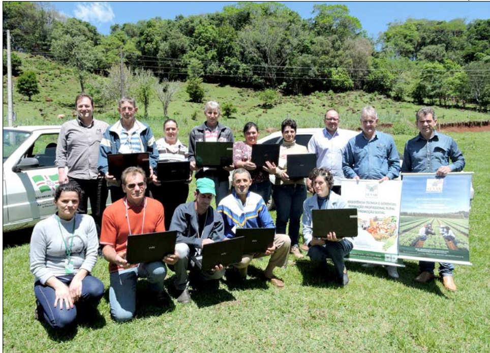
Propriedades estão se transformando em empresas rurais, aproveitando as facilidades da tecnologia