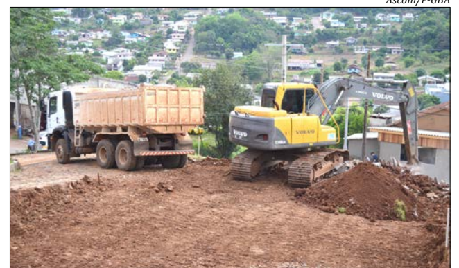
A Secretaria de Transportes, Obras e Serviços Urbanos trabalhou segunda-feira nas obras

Conforme a administração municipal, o auxílio acontece através de Lei autorizativa número 3031/2017, nos termos da Lei número 13.019/2014, que firma a colaboração entre a Associação de Pais e Amigos dos Excepcionais de Guaraciaba e visa a execução do projeto de aterro.