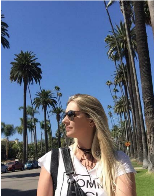
Em Beverly Hills

Também esteve em Los Angeles, San Diego, Las Vegas e outras cidades.