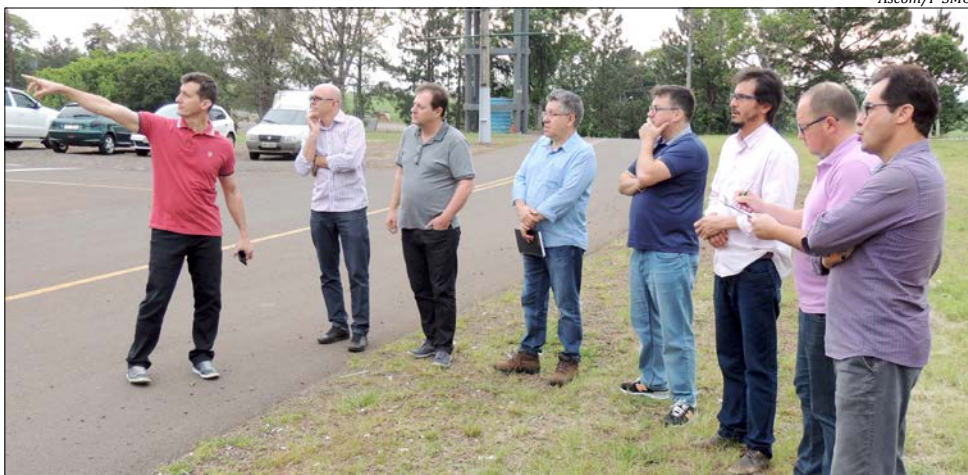
Comitiva averiguou as condições do Parque para receber o evento deste ano