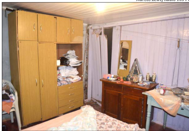
Carro parou a apenas um metro da cama onde idosa dormia no momento do acidente. Os danos na residência são considerados de grande monta, tendo em vista que toda a estrutura acabou sendo afetada com o impacto

Dentro da residência estava uma idosa de 72 anos, que dormia em um dos quartos atingidos no momento do acidente. Segundo ela, quando acordou viu o carro dentro do seu quarto e levou um grande susto, pois o veículo parou apenas um metro da cama onde a idosa dormia