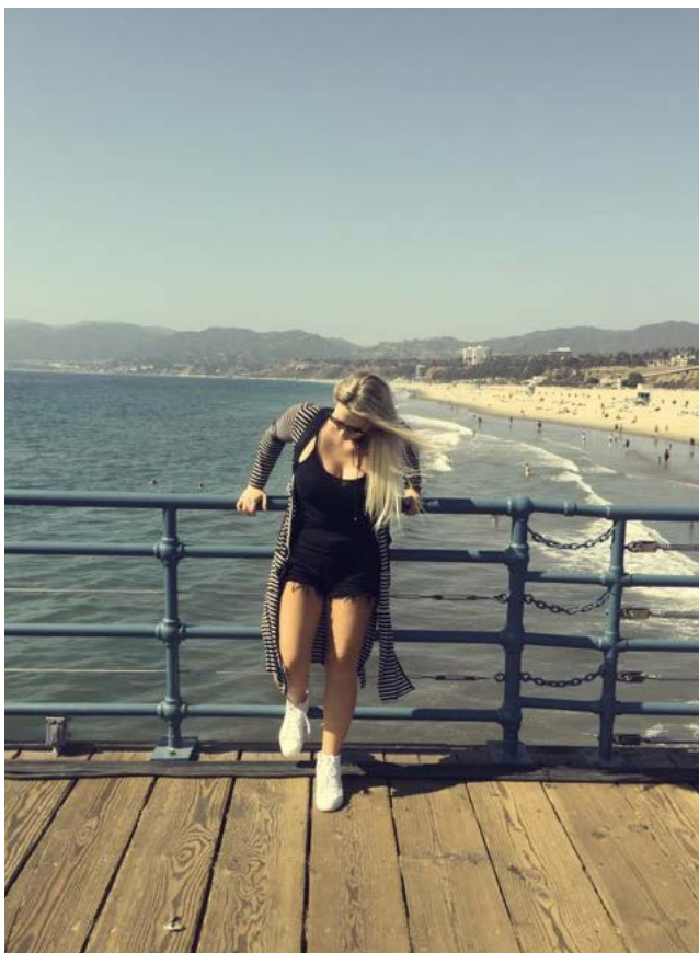
Em Píer de Santa Mônica, Califórnia