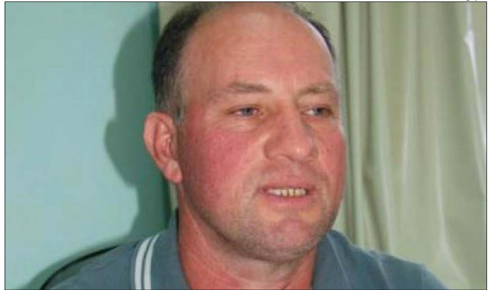
Prefeito Moacir Piroca