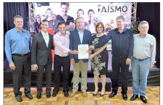
Secretaria de Estado da Agricultura assinou convênio para o repasse de R$ 100 mil a serem investidos na Feira da Agricultura Familiar