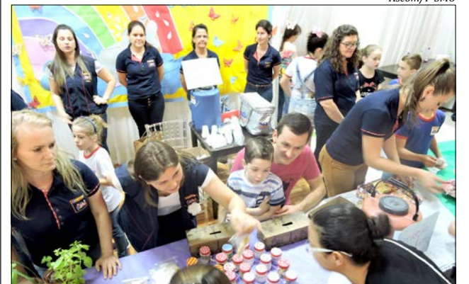
O programa Jeep contemplou alunos do 1º ao 9º ano e tem por objetivo desenvolver a cultura empreendedora em sala de aula