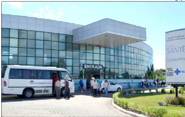
Hospital Regional Terezinha Gaio Basso recebe o prêmio por gestão ambiental

A entrega do certificado é uma novidade deste ano e serve para valorizar projetos de destaque que estão na mesma categoria das vencedoras. O Prêmio