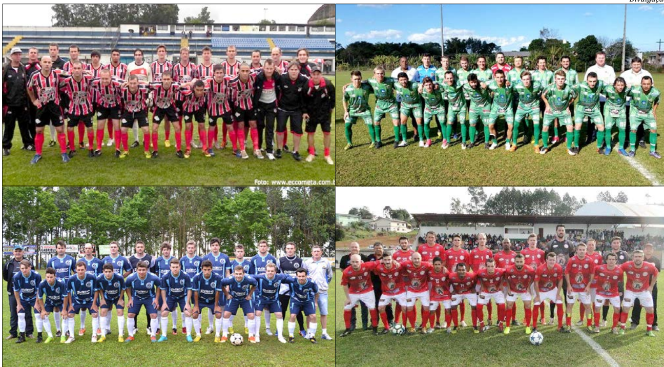
Cometa, Ouro Verde, Grêmio União e Harmonia estão no páreo