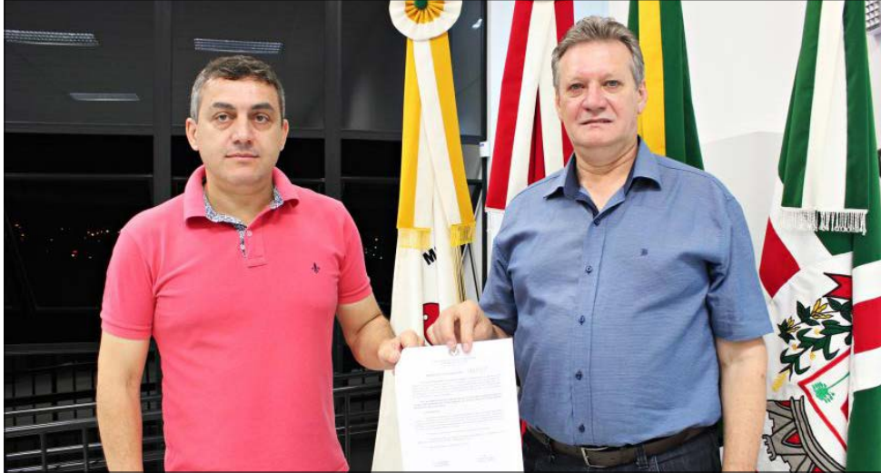
Di Berti e Barp sugeriram revisão do Plano Diretor a cada dois anos