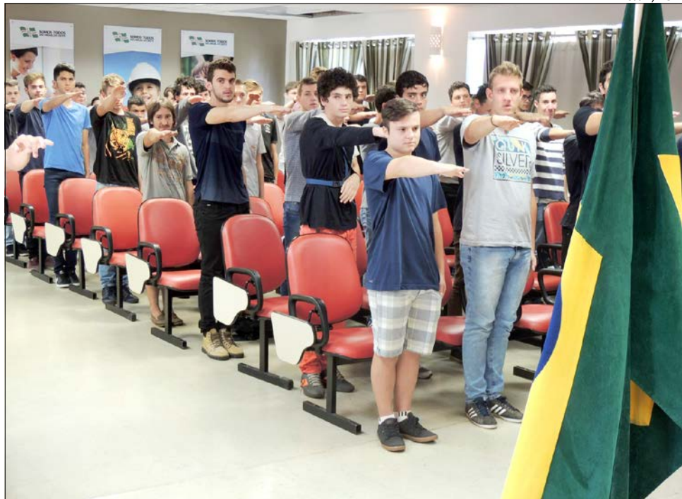
Cerimonial foi realizado na manhã de terça-feira

De acordo com Andrade, os 125 jovens foram dispensados de vestir a farda e servir ao Exército Brasileiro, mas em qualquer situação que houver necessidade serão convocados