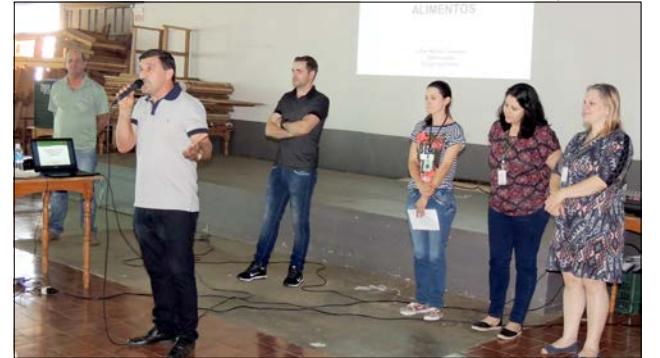
Contaminação está relacionada com procedência, estrutura física e higiene