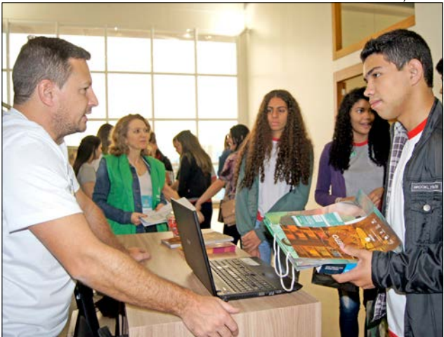
Alunos puderam conhecer os cursos de graduação oferecidos pela Universidade