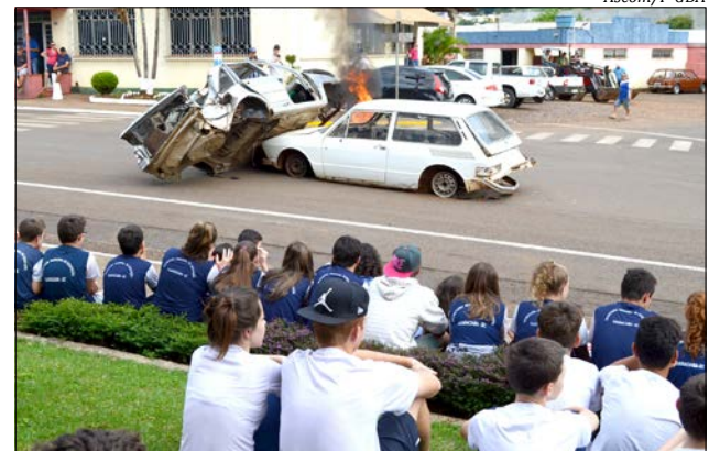
Simulação chamou a atenção da população no centro da cidade

No sábado 23, aconteceu uma blitz informativa com distribuição de adesivos educativos e também orientações aos motoristas no portal de acesso à cidade. Conforme Marciel, o principal objetivo das ações no é a participação de todos para o alcance da segurança entre condutores e pedestres, garantido um trânsito mais seguro.