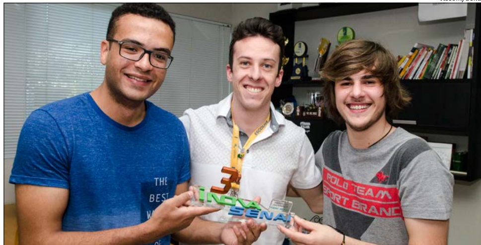
Alunos e professor retornaram de São José com a premiação de nível estadual