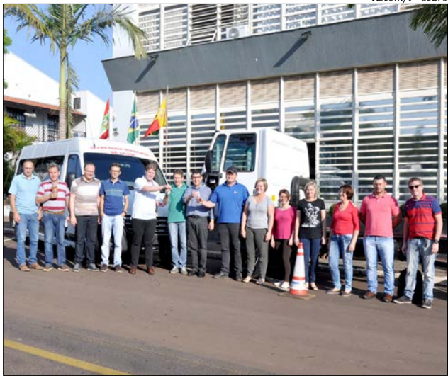
Veículos foram entregues na manhã de terça-feira