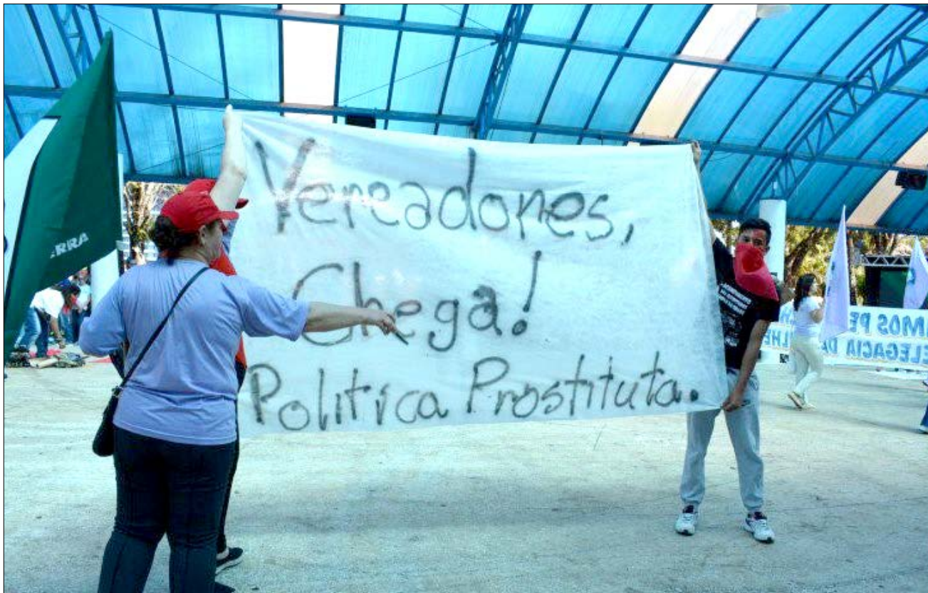
O desfile dos mascarados não agradou ao grande público. Há quem diga que foram recrutados em outras cidades.

Salvo melhor juízo, o projeto não foi aprovado por questões ideológicas. As orquestradas manifestações na Câmara e na rua também são atribuídas à autora do importante projeto. Hoje, com a esquerda em queda livre, o grande público desaprova as vaia para autoridades e convidados na Câmara. O desfile dos mascarados, viúvas de Dilma e Lula, foram a gota d'água.