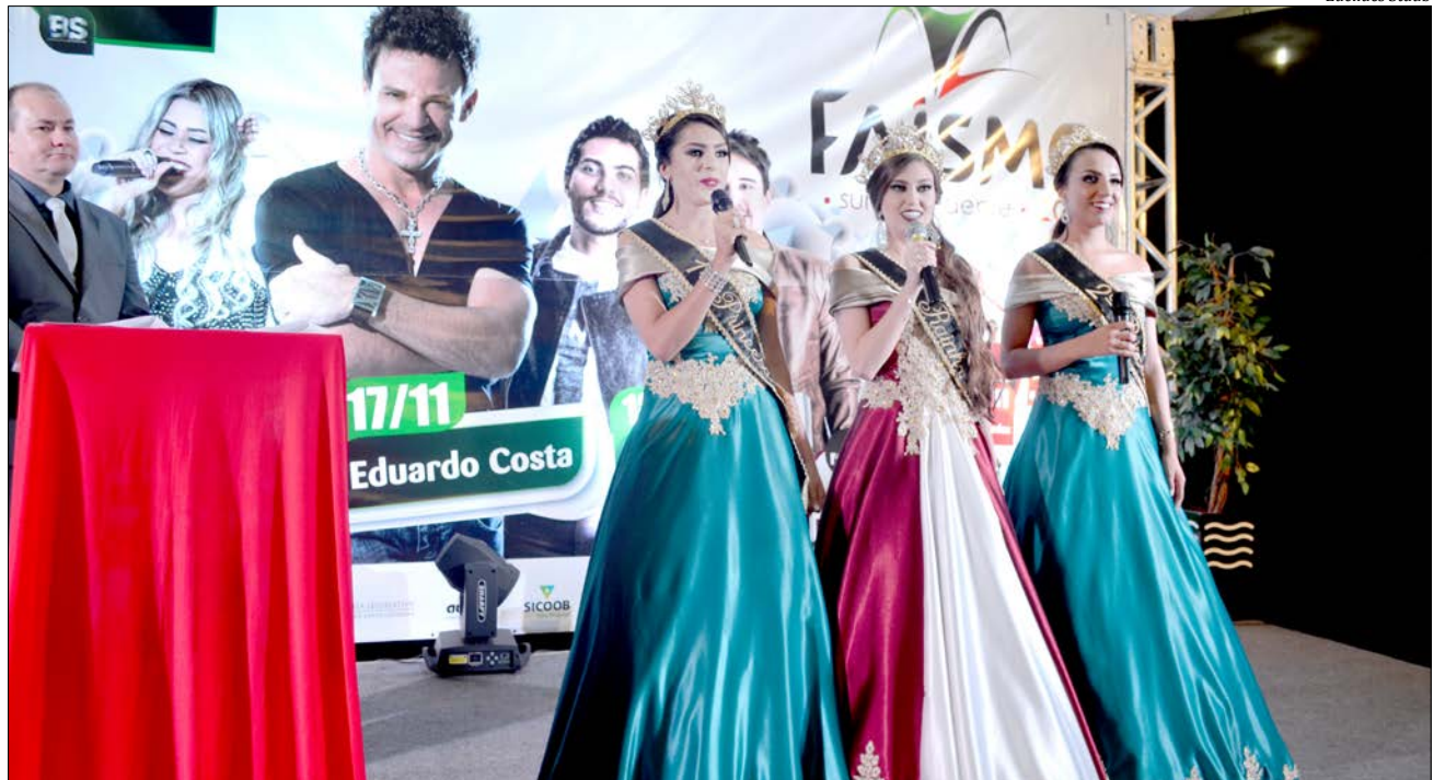
Rainha e princesas abrillantaram o evento