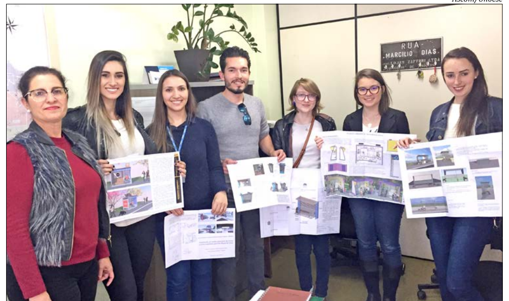
Propostas foram entregues à Secretaria de Planejamento de São Miguel do Oeste

Durante a elaboração das propostas, os estudantes tiveram que colocar em prática conhecimentos técnicos em relação aos materiais empregados e estruturas, além de noções