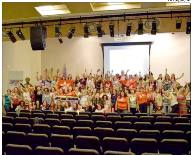
Em torno de 300 mulheres estiveram reunidas em Florianópolis

Vendo apartamento pela metade do preço. Fone: (49) 9 8427-4926