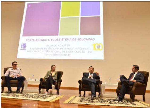
Jovens participaram de palestras referentes às competências necessárias para o profissional do Século 21