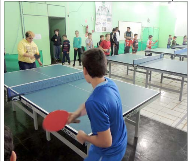
Tênis de Mesa é uma das modalidades oferecidas aos alunos