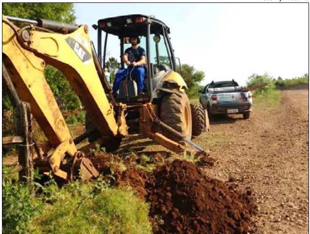
Está sendo finalizado os serviços de conserto da rede principal que sai dos reservatórios instalados na Linha Imperatriz