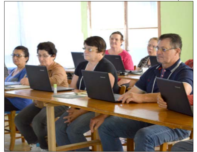
Os encontros foram realizados no Centro de Convivência dos Idosos