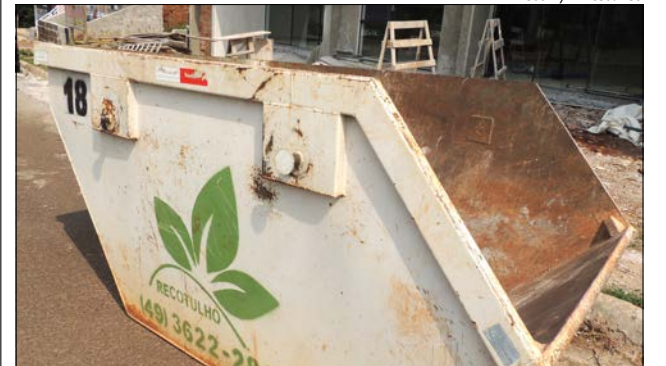
Serão permitidos entulhos de construção como concreto, telhas, tijolos, blocos e outros