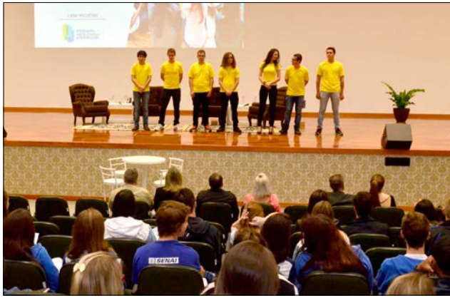
Evento foi realizado no Centro Cultural da Unoesc