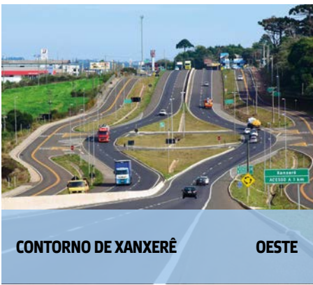
CONTORNO DE XANXERÊ

Acompanhe todas as obras em: 178obras.com.br