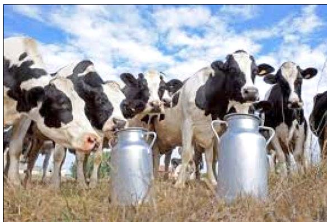
Produção de leite é um dos segmentos mais atingidos

Impactos menores são observados nas lavouras de trigo e na fruticultura. Devido ao calor fora de época, muitas cultivares de pêssego já iniciaram a floração e as perdas na produção são estimadas em 3%.