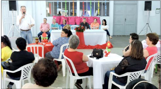
O evento ocorreu na tarde de segunda-feira, no Bairro Agostini