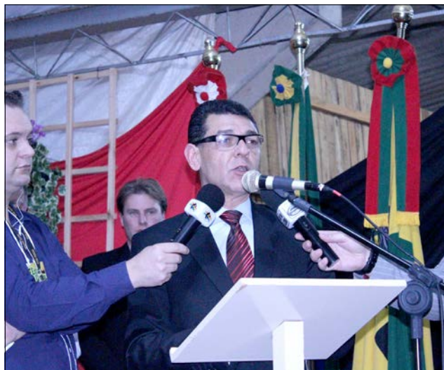
Prefeito Plínio de Castro destacou o sucesso da feira, resultado da união de todos os segmentos do município