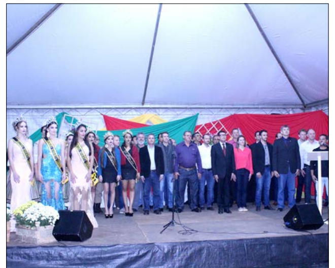
Autoridades estaduais, regionais e municipais participaram da solenidade de abertura