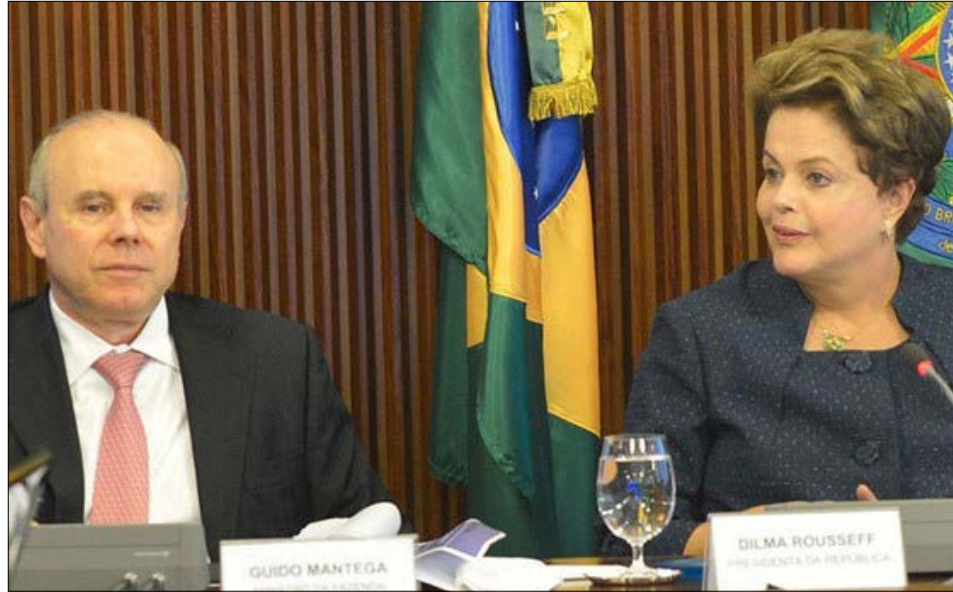
Guido Mantega e Dilma Rousseff, em 2014

Mantega decide partir para delação e entregar Dilma para não mofar na cadeia nos moldes de Marcos Valério. Valério preferiu ver o sol nascer quadrado a entregar os mensaleiros tucanalhas e petralhas. Também, está na fila para chutar o pau da barraca, o também ex-ministro Antônio Palocci