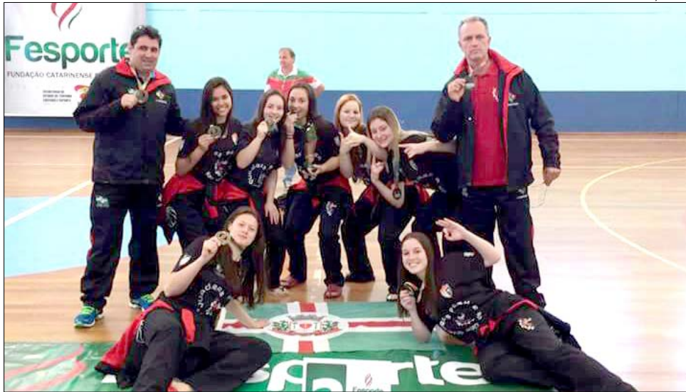
Equipe comemorou a conquista da medalha de bronze