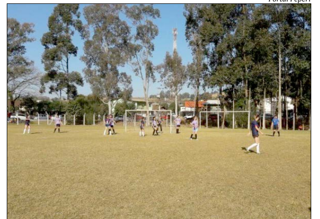
As finais aconteceram no Clube Cruzeiro, com um bom público

Na disputa pelo terceiro lugar no naipe masculino, quem levou a melhor foi a equipe Prestes, a qual conseguiu vencer o Mercado Schmidt por 3 X 0. Pelo feminino, disputando o primeiro lugar, a equipe Três Passos venceu a equipe Aliança por 1 X 0. Pelo masculino, o Três Passos jogou melhor, venceu o Cruzeiro pelo placar de 2 X 1 e conseguiu levantar a taça de campeão do municipal de Paraíso.