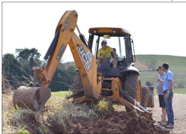
Trabalhos iniciaram segunda-feira na comunidade