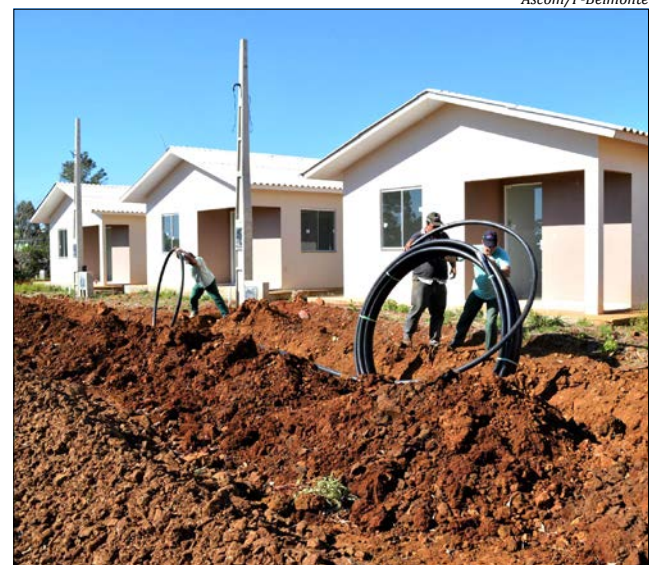
Nos próximos dias também deve acontecer a ligação da rede de energia elétrica