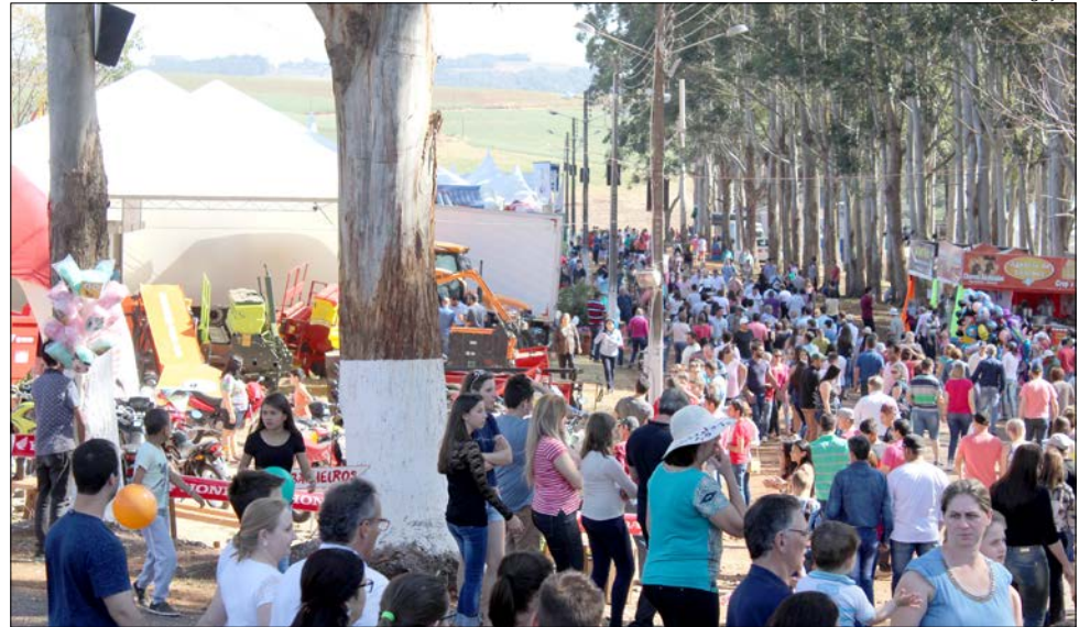
Durante os três dias de feira, o Parque Balduino Schneider esteve movimentado com grande público