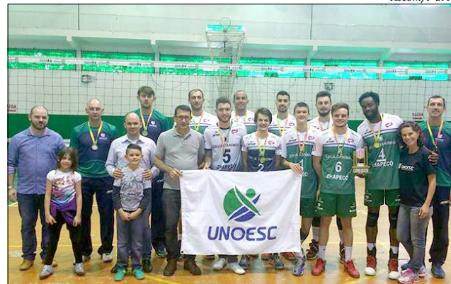
Equipe de Voleibol masculino sagrou-se campeão

Com a conquista do primeiro lugar das equipes de