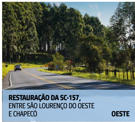
RESTAURAÇÃO DA SC-157, ENTRE SÃO LOURENÇO DO OESTE E CHAPECÓ