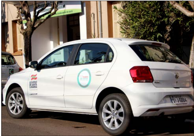
O veículo vai servir para a continuidade do suporte aos municípios