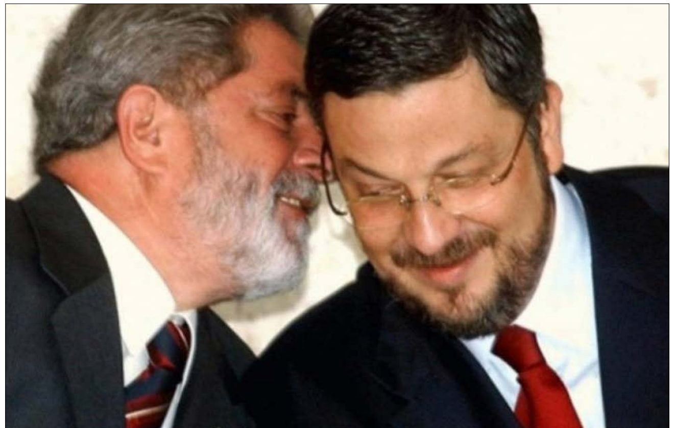
Luiz Inácio Lula da Silva, ex-presidente, com Antonio Palocci

Mantega já mandou sua oferta inicial aos procuradores. Ainda está fechando com qual advogado tocará a delação. Por isso, as negociações estão no início. Os procuradores ainda não definiram se é o momento de aceitar a delação. Seja como for, esperam muito mais provas do que as já oferecidas por Mantega. Estão interessados em casos novos, especialmente envolvendo crimes no sistema financeiro – objeto da delação de Palocci – com uso de informações privilegiadas da equipe econômica petista.