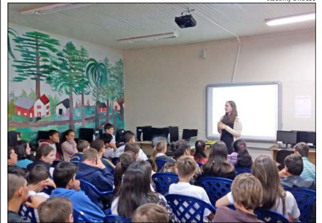
Palestra foi ministrada a estudantes da Escola de Educação Básica São José