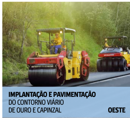
IMPLANTAÇÃO E PAVIMENTAÇÃO DO CONTORNO VIÁRIO DE OURO E CAPINZAL