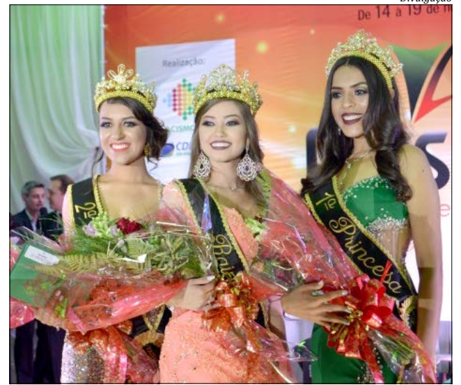
Soberanas da Faismo estarão presentes ao evento