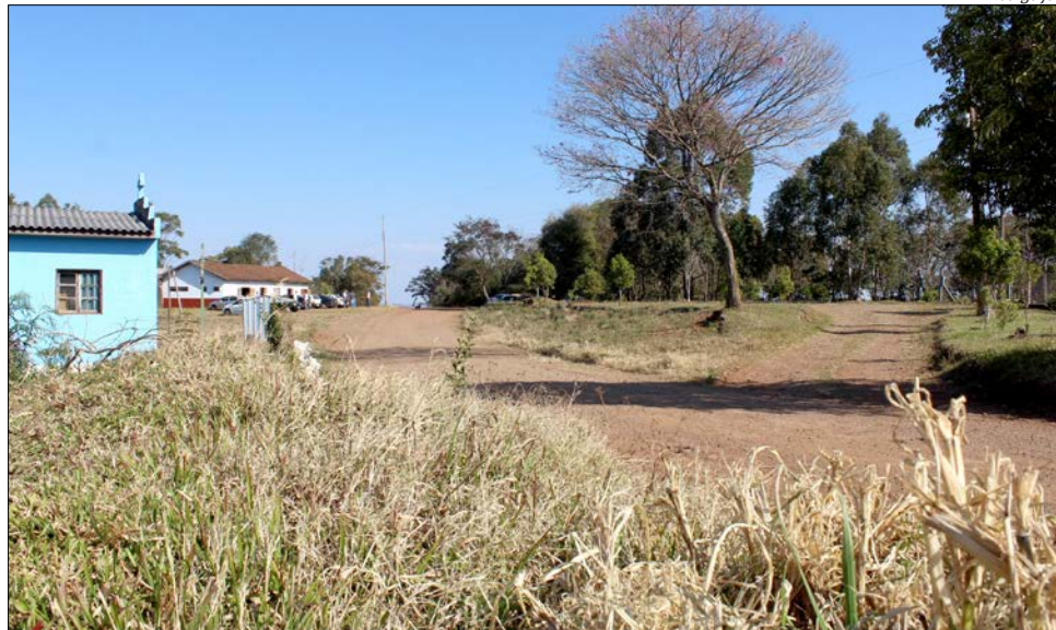
Paisagem em São José do Cedro já é de seca quase total

Em 2017, a produção catarinense de leite vinha superando os números de 2016. Os levantamentos do Centro de Socioeconomia e Planejamento Agrícola (Epagri/Cepa) apontam que, no primei-