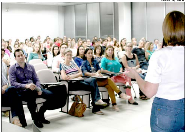
O evento que era gratuito aos associados contou com a presença de aproximadamente 200 lojistas