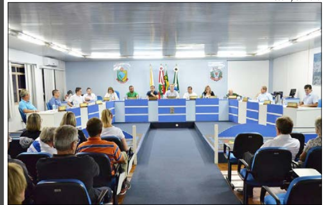
O mesmo reajuste foi concedido também aos servidores e agentes políticos do Poder Legislativo