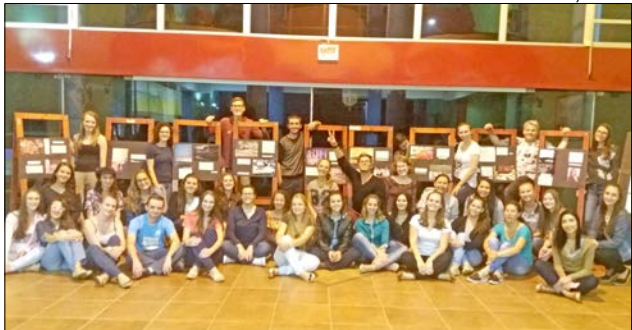
A mostra foi desenvolvida por acadêmicos da 5ª fase do curso de Psicologia de São Miguel do Oeste