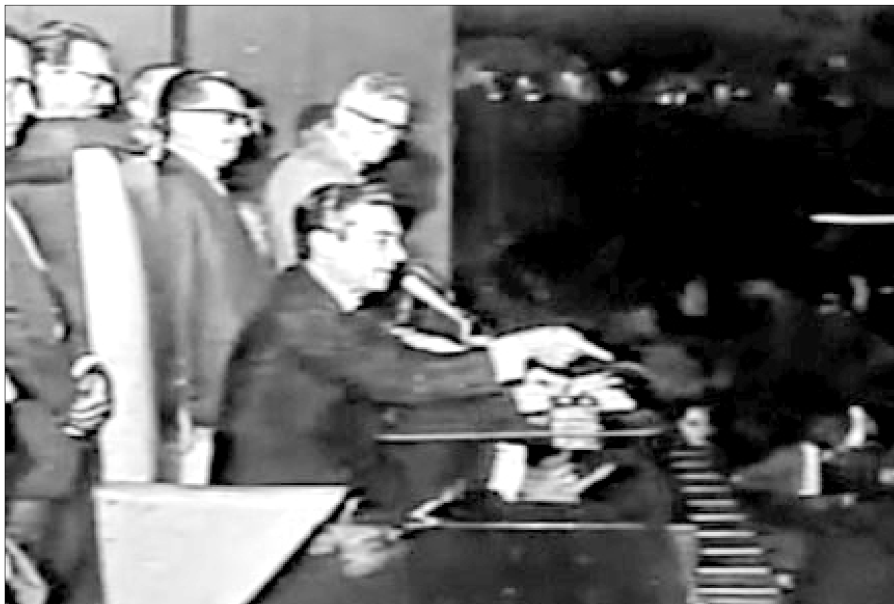
Senador Auro de Moura Andrade, do PSD (no destaque) declara vaga a Presidência em sessão conjunta do Congresso Nacional, em 1964

Sobre a revolução Democrática de 31 de março de 1964, alegam golpe militar, mesmo sabendo que os militares não chegaram ao poder pelo fuzil, metralhadora ou canhão. Não dispararam nenhum tiro de festim, mas chegaram ao poder pela aclamação nas ruas e pelo Congresso Nacional.