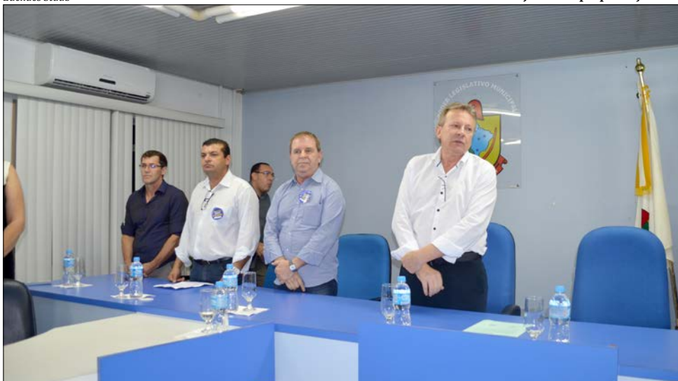
Deputado Celso Maldaner foi alvo de vaias e teve discurso interrompido