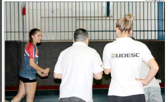
Atletas foram avaliadas por profissionais da Universidade em quadra