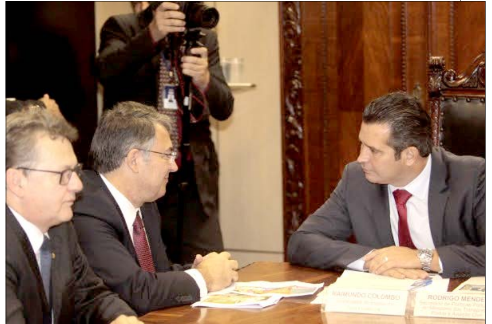
Governador colocou às autoridades a importância da ponte em Paraíso para as exportações catarinenses