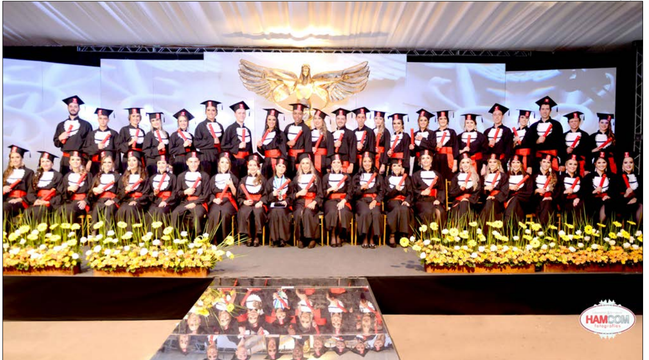
A formatura dos 44 novos contadores foi realizada no Parque de Exposições Rineu Gransotto