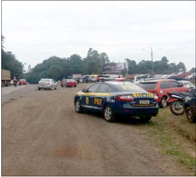
Fiscalizações foram feitas em Xanxerê, Maravilha e Guaraciaba