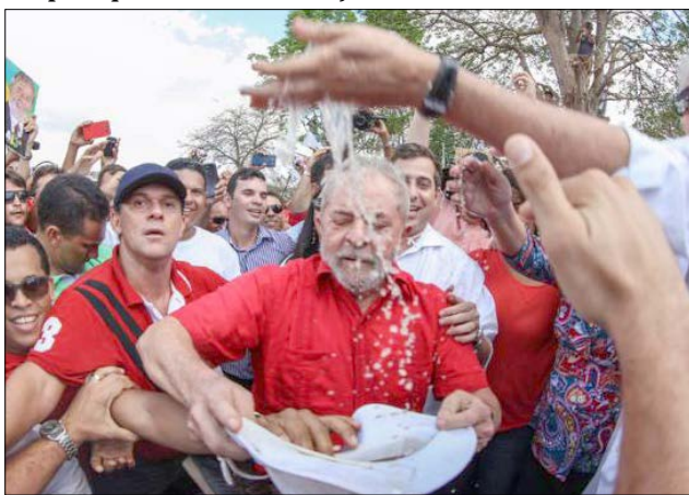
Os ex-presidentes Lula e Dilma Rousseff em Monteiro (PB) ao lado do governador Ricardo Coutinho

Corrupto, em inauguração extraoficial da transposição do São Francisco, mirou em 2018 e lascou: "Eles que peçam a Deus para eu não ser candidato em 2018". Salvo melhor juízo, uma tentativa para sensibilizar as autoridades judiciárias para não o condenarem nos processos em que é réu, o que o tornaria inelegível, mesmo liderando as pesquisas de intenções de voto.