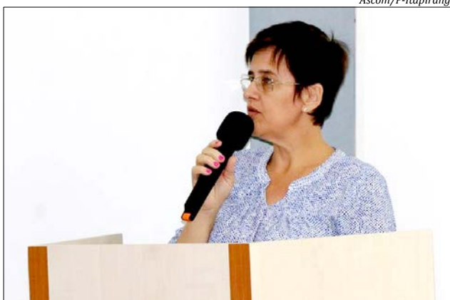
A secretária enfatizou as tratativas visando à permanência da unidade do Senai em Itapiranga