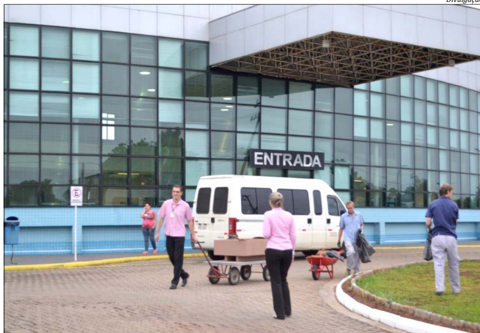
A gestão do serviço em São Miguel do Oeste ficará a cargo do Instituto Santé

Em 2016, segundo dados da Secretaria de Estado da Saúde, foram