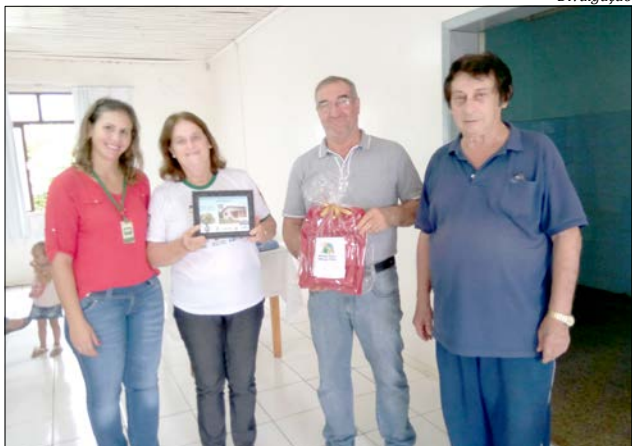
Foi entregue uma lembrança para cada família e um porta retrato com foto do antes e depois da reforma da casa