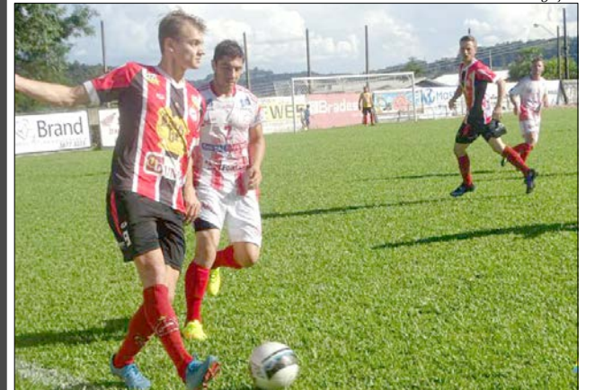
O Pérola interrompeu uma sequência de cinco jogos sem vitória