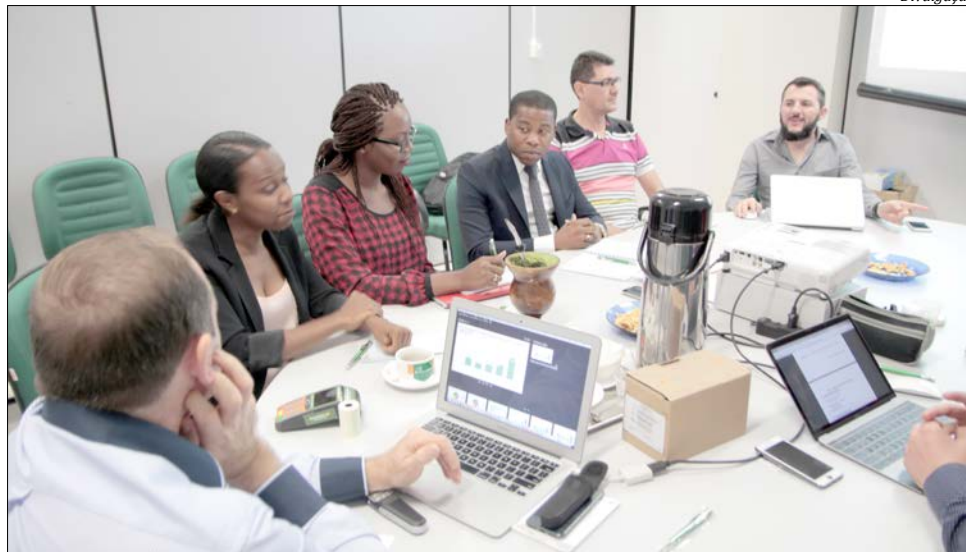
Direção da Sulcredi recepcionou a delegação vinda de Luanda, capital da Angola