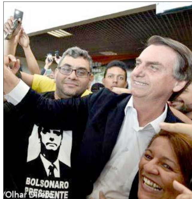
Chegada de Jair Bolsonaro a Cuiabá

No mesmo evento, Dilma acusou a Lava Jato de promover um "segundo golpe". "O objetivo é impedir que candidatos populares sejam colocados à disposição do povo. O Lula é esse candidato", discursou.