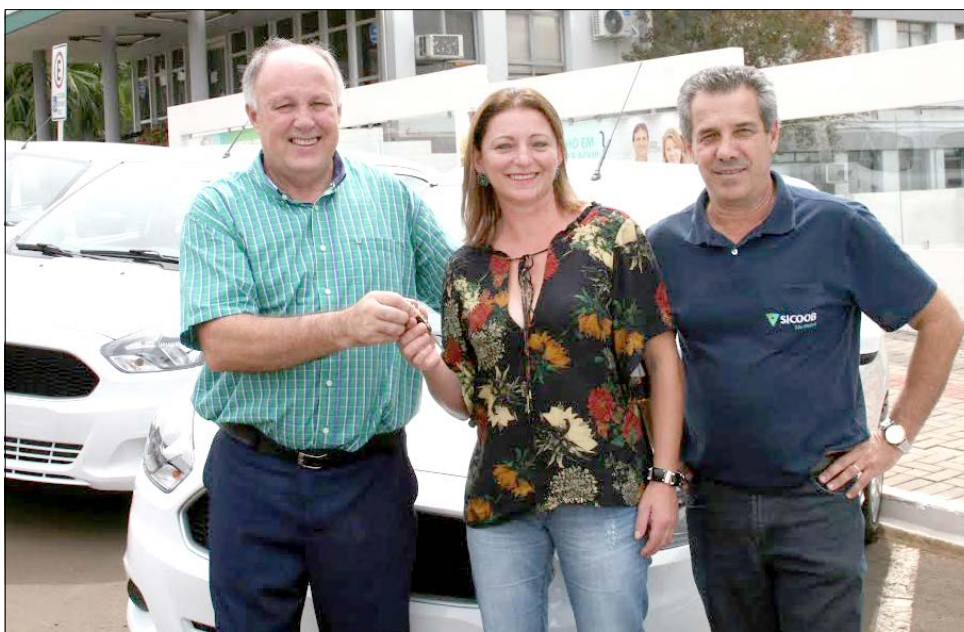
Durante a assembleia foram sorteados e entregues carros aos associados

Durante a assembleia, ainda ocorreu a aprovação dos nomes dos representantes do conselho de administração e diretoria executiva para os próximos quatro anos.