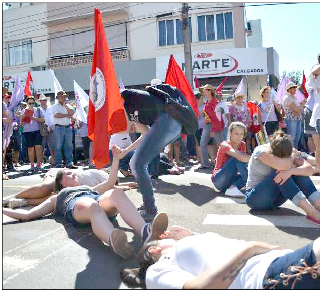
Fechamento de ruas impede o sagrado direito de ir e vir

Entre os adjetivos das pessoas que tiveram o seu direito de ir e vir limitado em função das manifestações ouviu-se frases tipo: "Marcha das vadias e dos vadios também. Fossem trabalhadores estariam trabalhando. A polícia recebeu mil policiais pra serem babás dos movimentos sociais. Em São Miguel do Oeste, qualquer zé ruela bloqueia o trânsito. A mulher quer direitos e salário iguais, por que quer se aposentar antes? As vagas de estacionamento estão reservadas para alguns. Não adianta fechar o trevo, tem que ir a Brasília. Qual ladrão querem eleger agora? O aposentado tem mais tempo para esperar na fila do que o não aposentado." Entre outros.