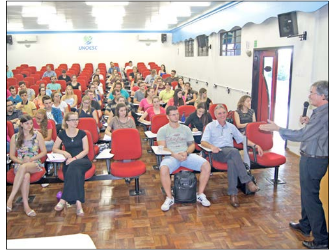
Karine Bender/Ascom Unoesc

Segundo Plácio, no país africano a mulher é vista como símbolo da vida e da fertilidade. Já o homem é visto como um símbolo de autoridade e é responsável pela cons-