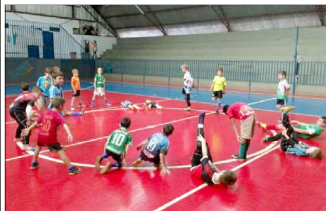
Os alunos que se destacam representam o município em competições regionais e estaduais