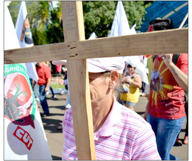
Protestos contra a reforma da Previdência deveriam ser feitos em Brasília, e não aqui

Diante disso, podemos entender que há uma bipolarização, de um lado os manifestantes e de outro os que têm a convicção de que as ruas são para os pedestres e veículos, os que correm para se manter no emprego, para manter as contas em dia, as empresas funcionando e os casos urgentes, tipo urgência médica. A solução é simples: realizar o manifesto fora do horário de expediente. Até mesmo para desmistificar a lenda do "pão com mortadela" para angariar manifestantes.