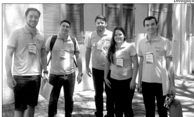
Cinco membros da JCI local estiveram presentes ao evento

o Brasil. Esse encontro é feito com a junta diretiva nacional, um representante mundial e conselho diretor de todas as Organizações Locais da JCI do Brasil. A reunião tem por objetivo definir as ações a serem tomadas durante todo o ano.