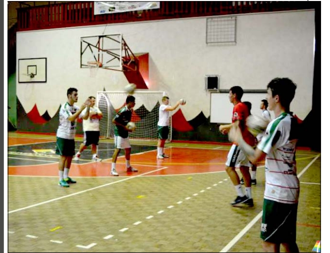
Treinos ocorrem os treinamentos ocorrem nas terças, quartas e sexta-feira à noite