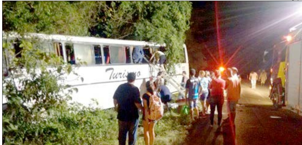
Ônibus foi interceptado pelos assaltantes na Serra da Maria Preta, na BR-163

No intuito de fugir dos bandidos, o motorista acelerou e continuou dirigindo por mais de 500 metros até ser atingido por pelo menos dois disparos. Após ser ferido, o motorista perdeu o controle do veículo, saiu da pista e colidiu em uma árvore, onde