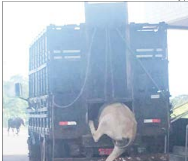
Transporte de animais estava irregular e os bois foram apreendidos pela Cidasc

No registro da Guia de Transporte de Animais (GTA) constava autorização para nove bois. Alguns dos animais não tinham brinco de identificação nem a orelha furada. Os animais foram apreendidos pela companhia para abate. O motorista foi encaminhado à Polícia Federal de Dionísio Cerqueira.