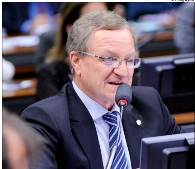
Deputado federal Valdir Colatto