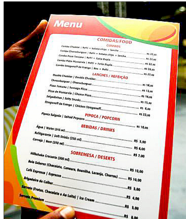
Cardápio do camarote da prefeitura no Sambódromo do Anhembi

"O tempo da mordomia acabou", afirmou o prefeito que ficou das 22h às 2h no camarote sem comer e beber nada. Não comeu e nem bebeu por que, neste ano, o prefeito não autorizou a compra de bebidas e nem comida para os camarotes. Nos anos anteriores, os comes e bebes nos camarotes eram patrocinados com dinheiro público. Dizem as más línguas que a abstenção do prefeito da capital paulista economizou algo em torno de R$ 3 milhões. Milhões destinados para regar a pança dos abonados, com o que existia de melhor no mercado.