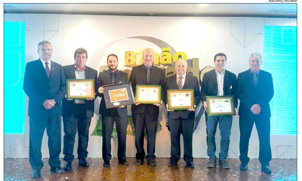
Representantes das Cooperativas de Santa Catarina participaram de cerimônia realizada em Brasília