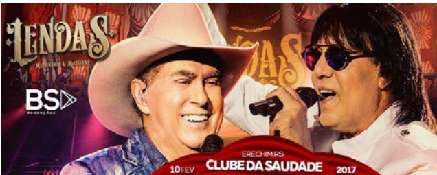
Para quem mora na região e quer quebrar a rotina, nesta sexta, no Clube da Saudade, em Erechim, tem show com Milionário e Marciano (Lendas)

"Quarenta mil estrelas na noite. Olha elas caindo do céu. Quarenta mil razões para viver. Quarenta mil lágrimas nos teus olhos". Parte da letra de 'Texarkana' - REM.