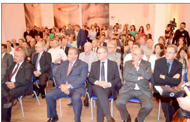
Público prestigiou a inauguração da noite de segunda-feira