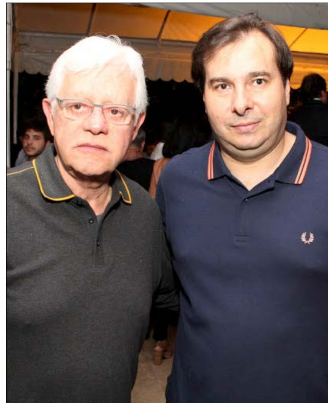
Moreira Franco e Rodrigo Maia têm ancestrais que era chaleiras de Getúlio Vargas

Tanto Moreira Franco como Rodrigo Maia foram os escolhidos por que os seus ancestrais foram chaleiras de Getúlio. Desde então, de governo em governo, se mantiveram na elite da política nacional. Tudo em família.