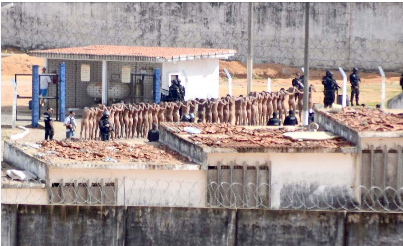
Depósito de bandidos interessa à OAB, Direitos Humanos e aos políticos