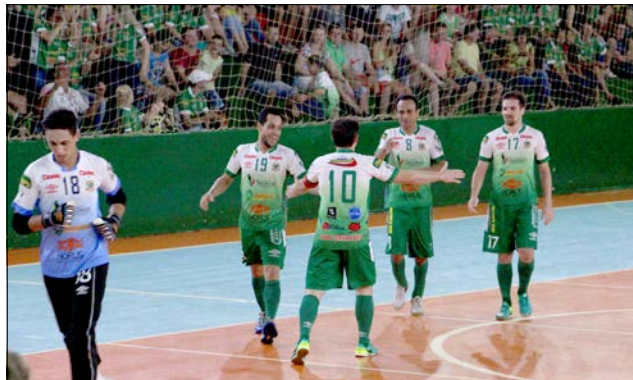
Jogo foi todo favorável à Adaf, que abriu o placar já na primeira etapa