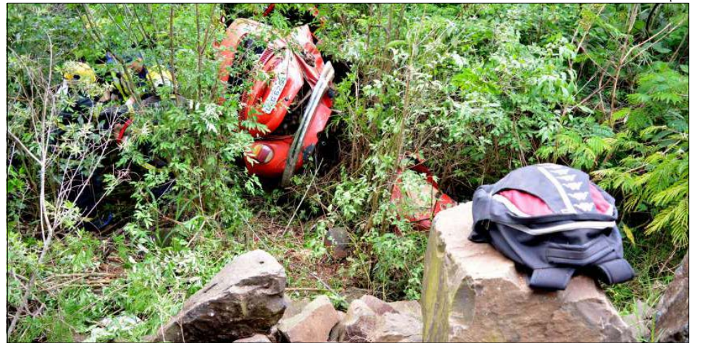
Carro desceu a ribanceira de pedras e só parou quando se chocou com as árvores