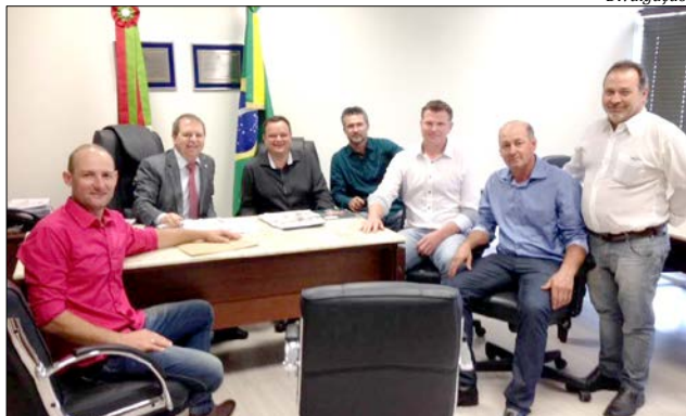
Prefeito, vice e vereadores eleitos levaram as reivindicações do município