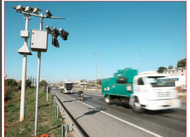
Todos processos sobre o tema foram suspensos.

A 1ª seção do Superior Tribunal de Justiça, em sede de Recursos repetitivos, decidirá se o DNIT tem competência para fiscalizar o trânsito e aplicar multas por descumprimento de normas em rodovias Federais e estaduais, como por excesso de velocidade. Dois recursos sobre o tema foram afetados pela ministra Assusete Magalhães, que determinou a suspensão de todos processos que discutem essa questão.