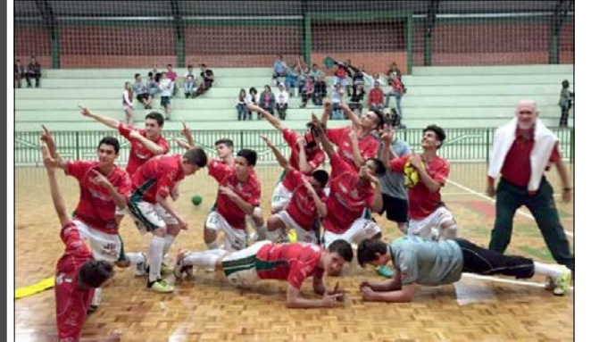
Com a vitória, o Joni Gool garantiu a primeira vaga na final e na decisão enfrentará o Apaf, de Joaçaba