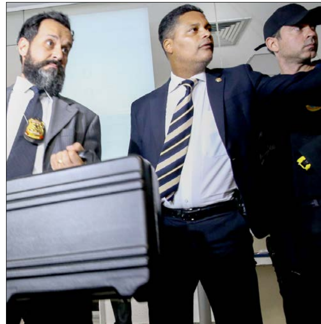
Polícia Federal apreende maletas de grampo no Senado

Sobre o abuso de autoridade, há uma gritaria absurda contra a lei que pune. Na esteira desse debate, já há uma frente que pede até que a Procuradoria-Geral da República represente contra o ministro Gilmar Mendes. O pretexto falacioso é que um texto de 2009 teria o objetivo de combater a Lava Jato, que é de 2014. A coisa parece piada? Parece piada, mas é assim.