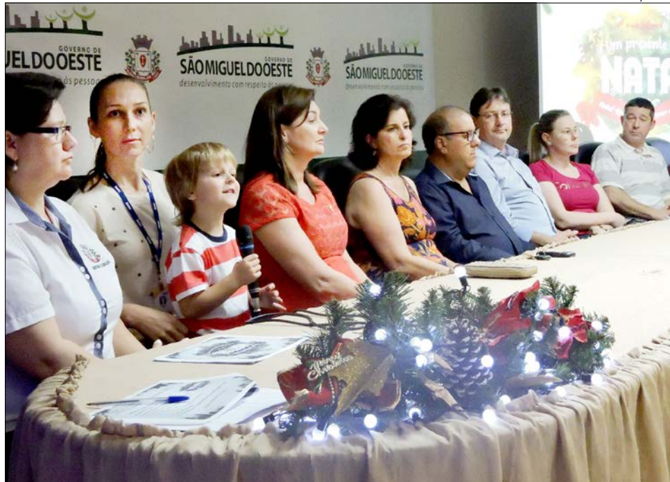
Lançamento do Natal e do Anjo da Solidariedade aconteceu na noite de quarta-feira