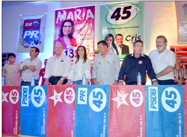
Deputados estaduais do PSDB e PT reforçaram a concentração da coligação "Juntos por São Miguel", no Bairro Agostini