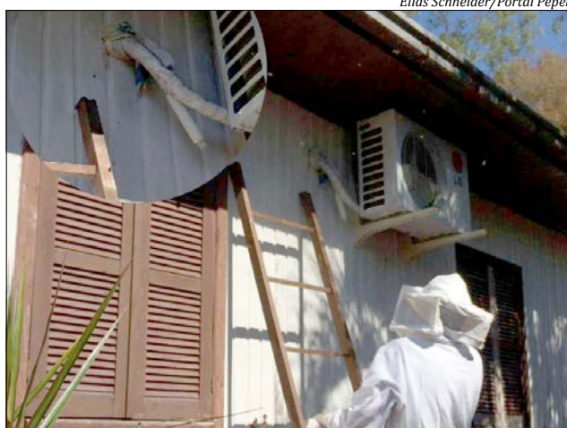
Em vários locais o acesso aos enxames é fácil e as pessoas são orientadas a aguardarem a visita de um apicultor

O apicultor reforça a necessidade de evitar que