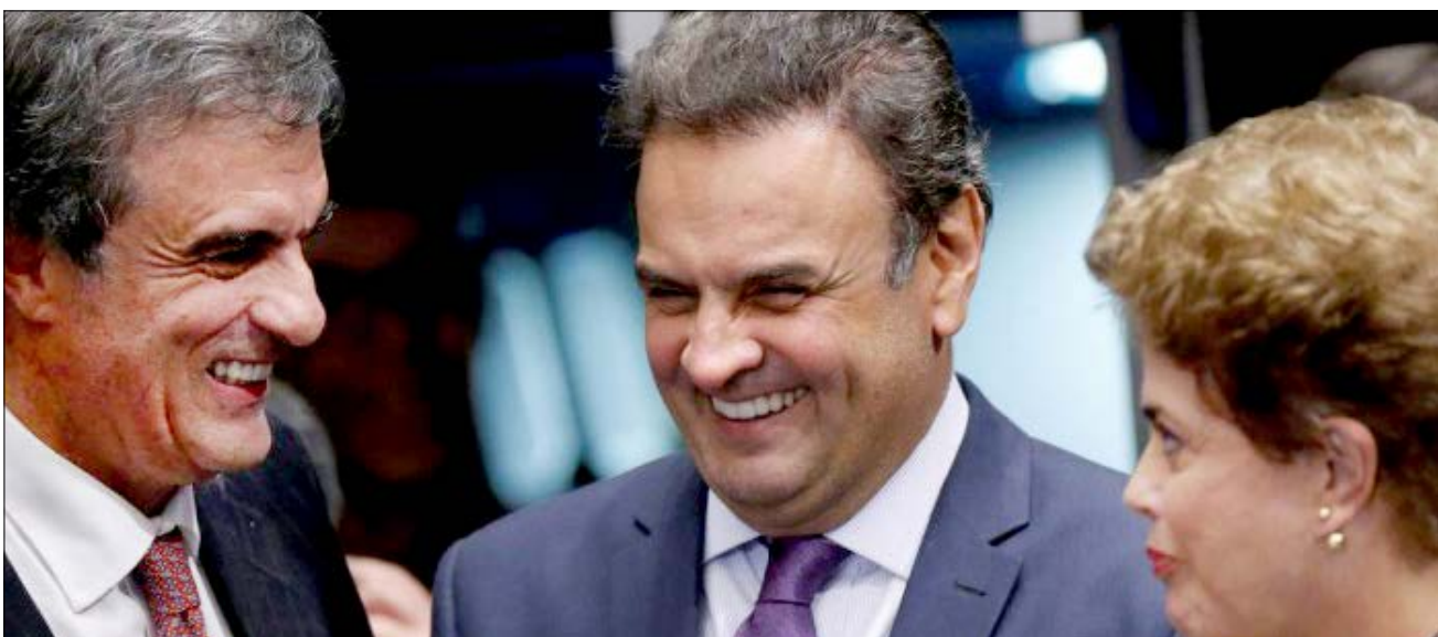
Durante sua defesa no processo de impeachment no Senado, Dilma Rousseff teve tempo para piadinhas com seu arquirrival Aécio Neves e seu defensor José Eduardo Cardozo

Tudo isso se deve a política partidária nas escolas.