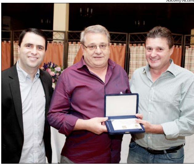
O jantar festivo foi no Restaurante Di Fiori e na programação foram prestadas homenagens aos profissionais da área

Os corretores de imóveis lutaram por muitos anos para que a sua profissão fosse regularizada no Brasil. O primeiro registro é de 1951, com a proposta de Lei nº 1.185, enviado para a Congresso Nacional, que pedia a regulamentação da profissão e definição legal dos direitos e deveres. No entanto, apenas em 27 de agosto de 1962, com o Decreto Lei nº 4.116, a profissão foi regu-