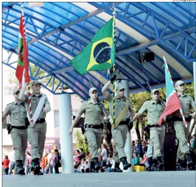
Desfile abre às 8h30 de quarta, na área coberta da praça