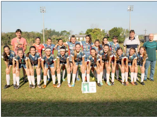
Descanso conquistou o primeiro lugar no feminino

ca de 200 atletas de 11 a 14 anos. Os campeões vão representar a região na etapa Regional em Quilombo, no mês de outubro. O Moleque Bom de Bola é um evento da Fundação Catarinense de Esporte (Fesporte). As etapas microrregionais e regionais contam com a organização das Agências Regionais e municípios.