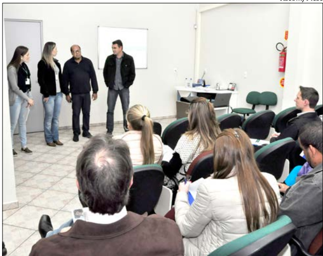
O curso foi realizado durante toda a quinta-feira